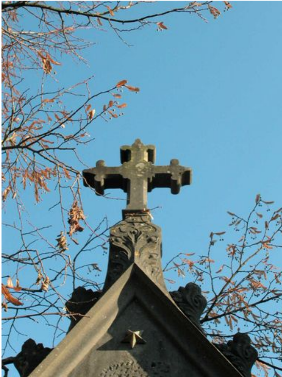
Détail de la croix.