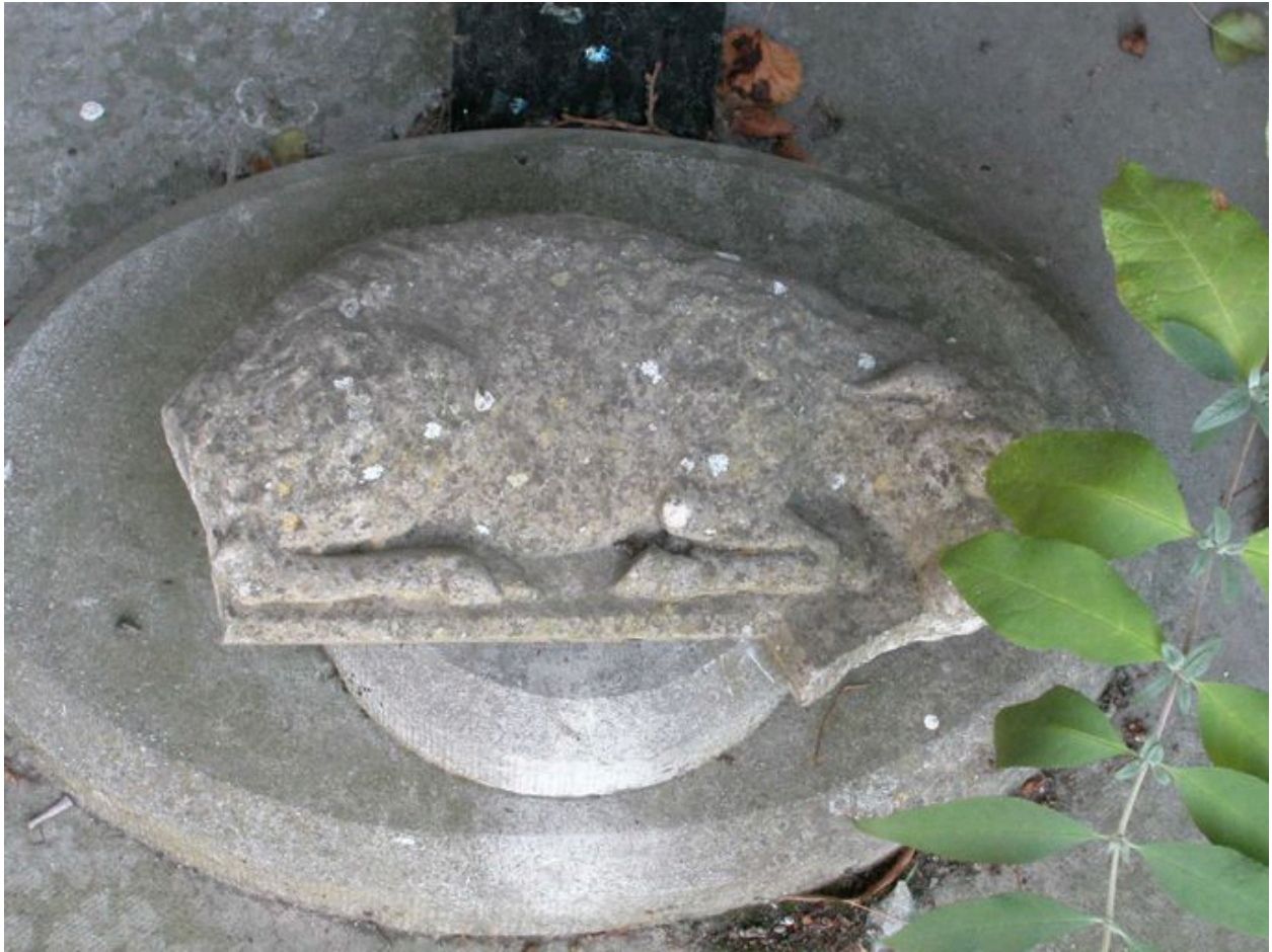
Relief avec Agneau mystique.