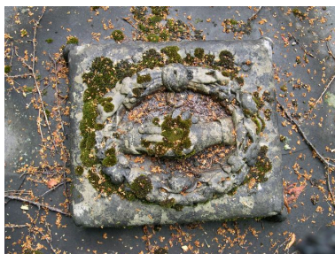
Vue de l'oreiller sculpté.