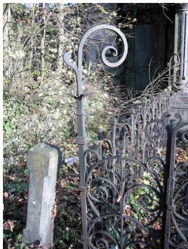
Détail du porte-couronne. IVR22_20048001288NUCA