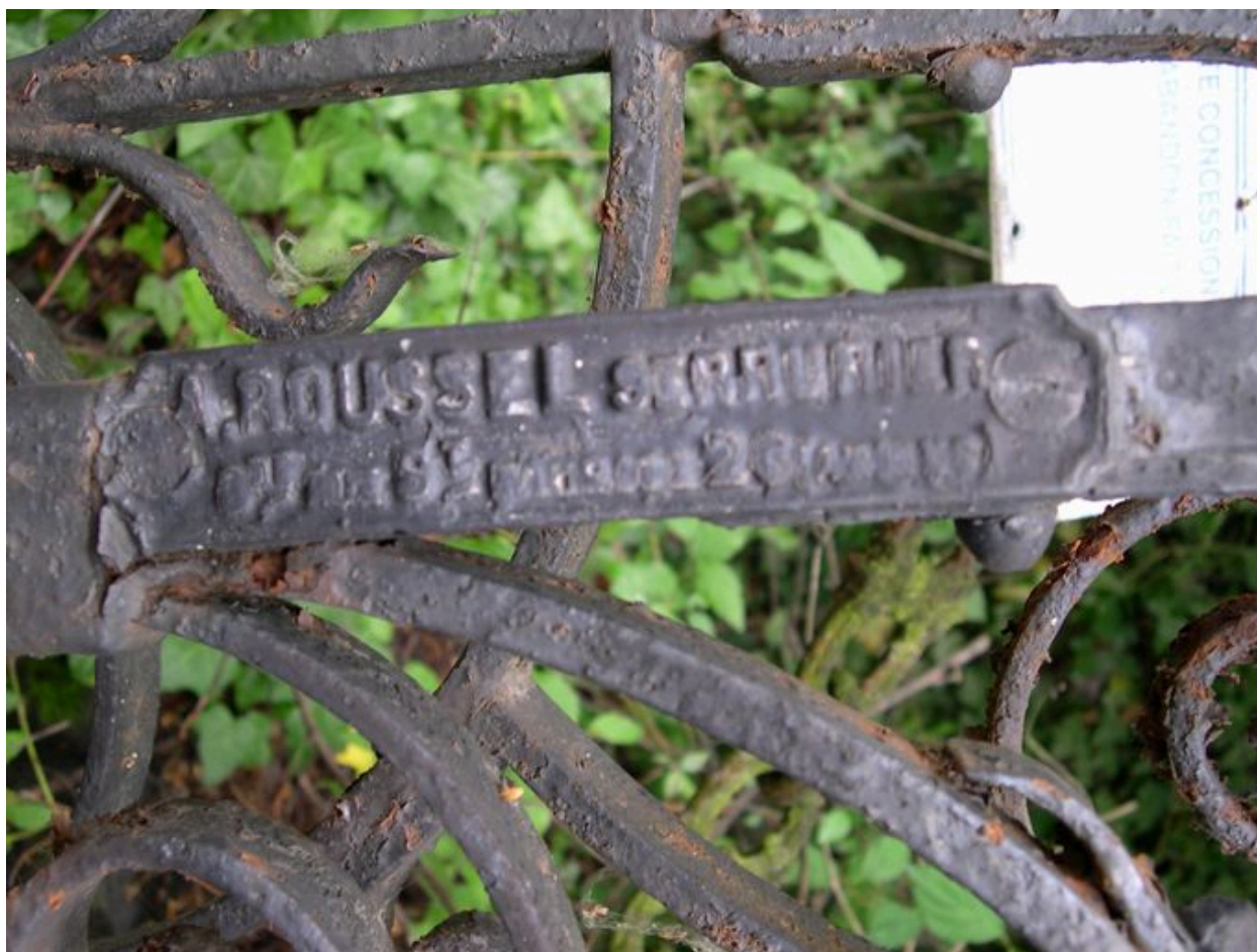
Signature du serrurier sur la clôture.