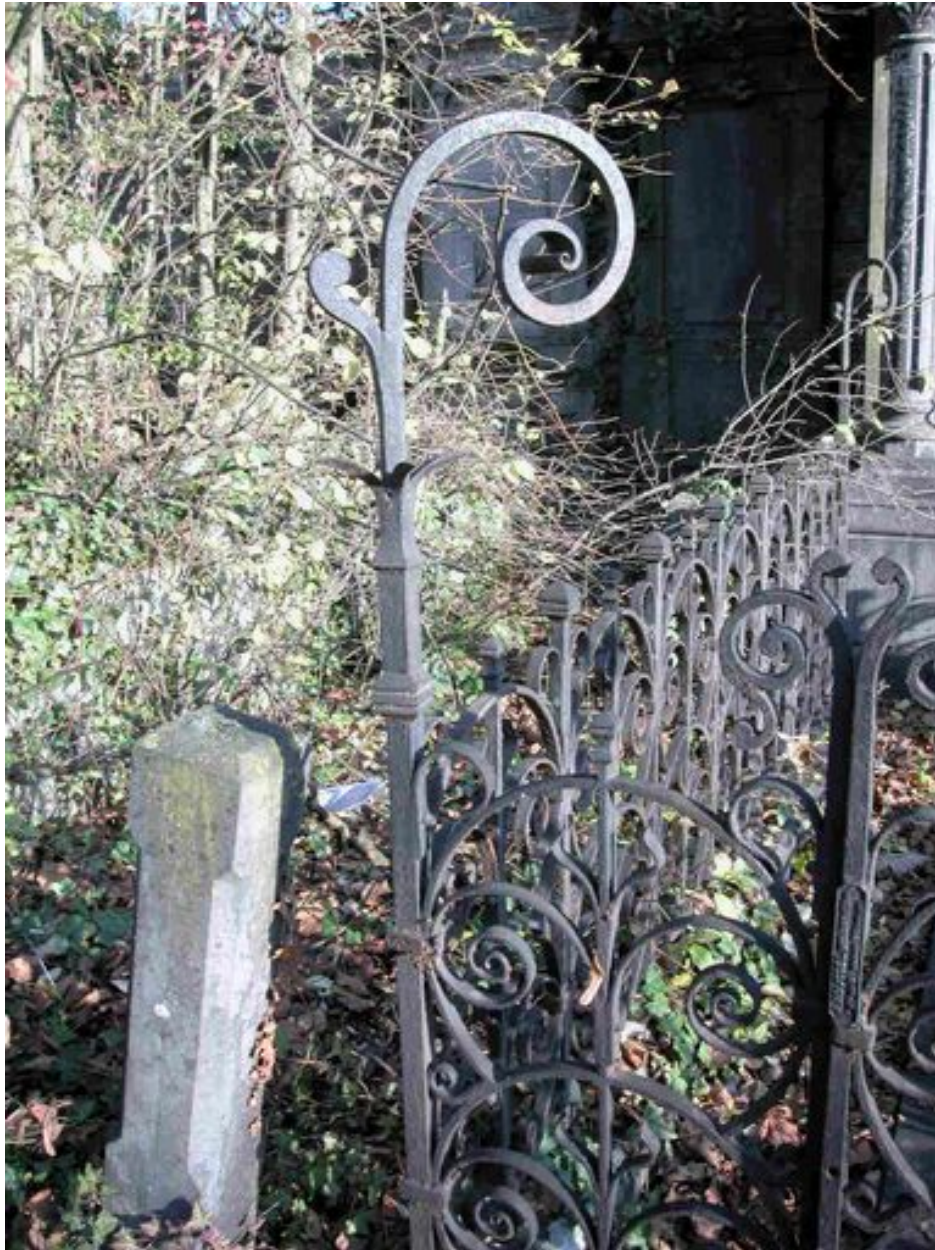
Détail du porte-couronne.