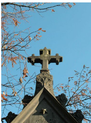
Détail de la croix. IVR22_20048001290NUCA