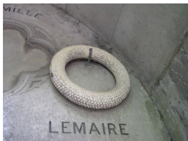
Couronne mortuaire en fonte.