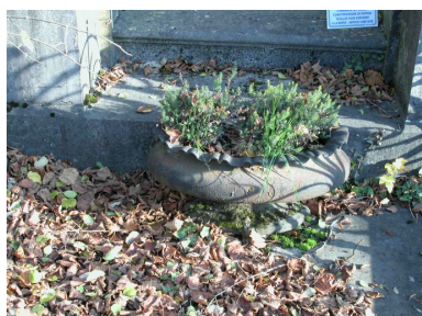
Jardinière.