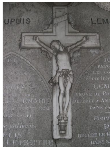
Christ en croix. IVR22_20058002148NUCA