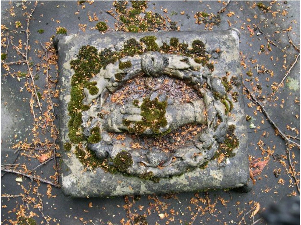
Vue de l'oreiller sculpté.