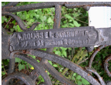
Signature du serrurier sur la clôture.