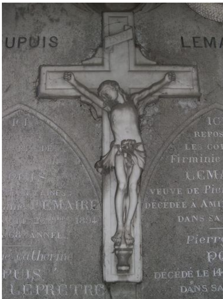
Christ en croix.