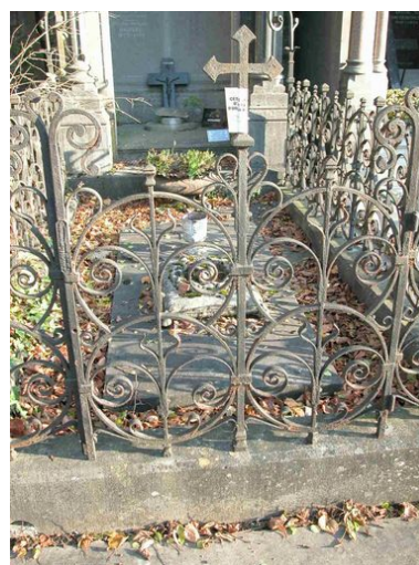
Vue du portillon.