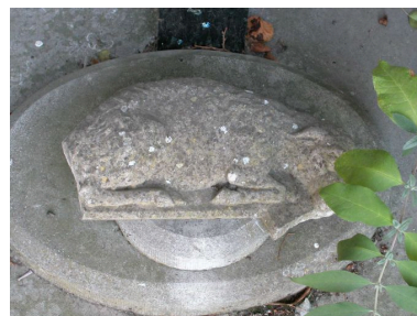
Relief avec Agneau mystique.