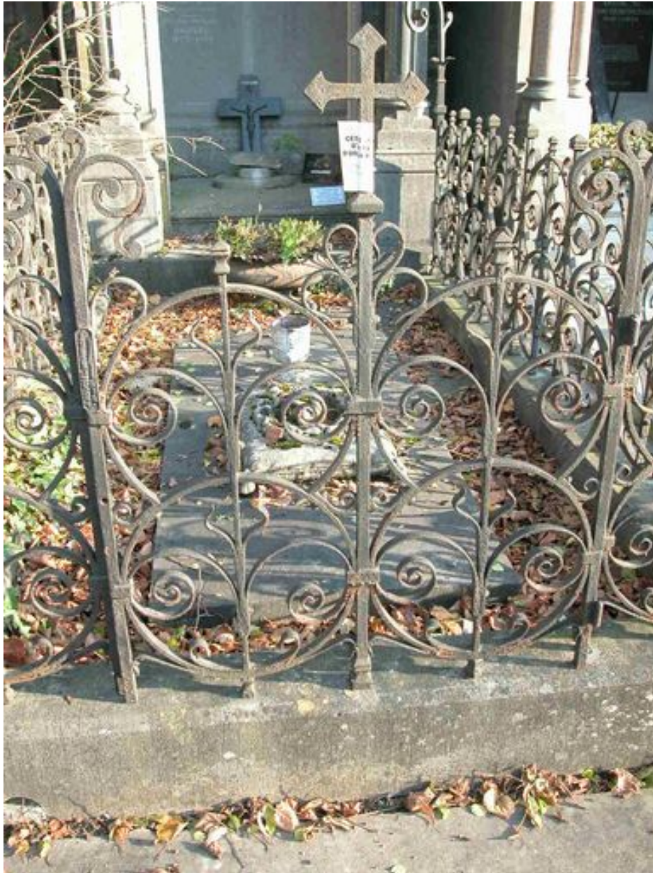
Vue du portillon.