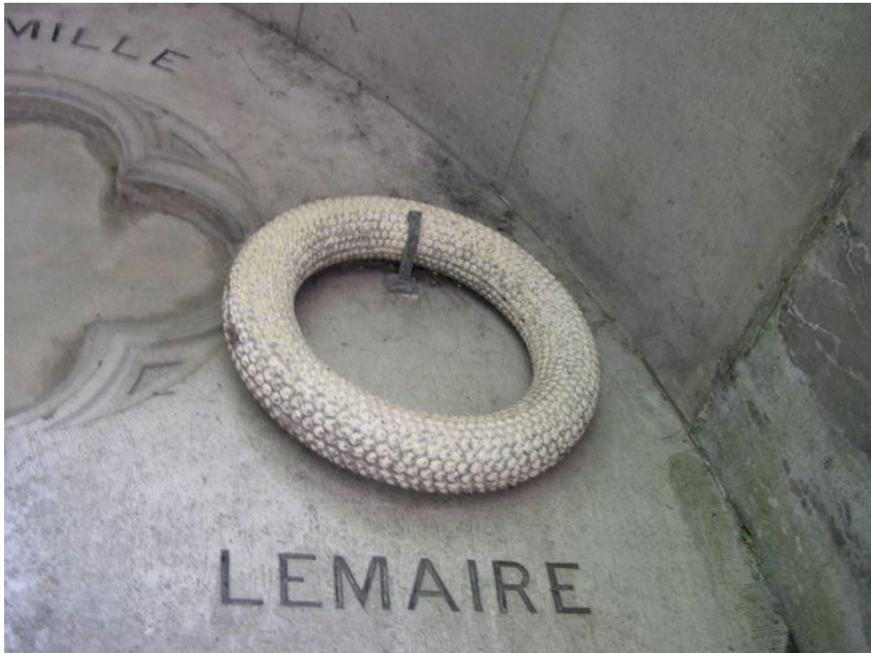
Couronne mortuaire en fonte.