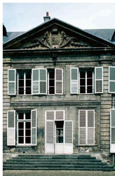
Elévation sur jardin, vue partielle. IVR22_19856000649ZA