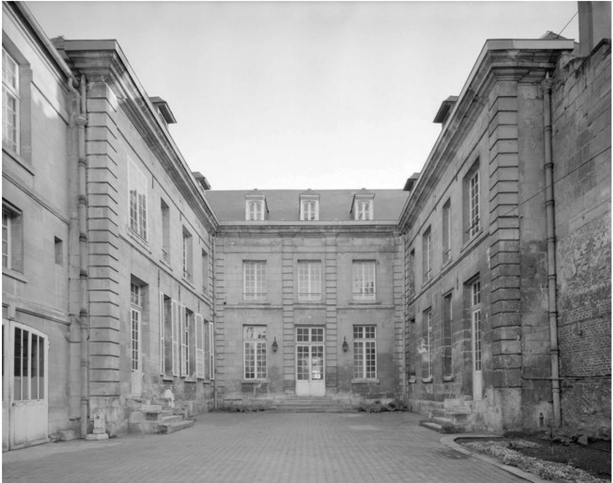
Elévation sur cour.