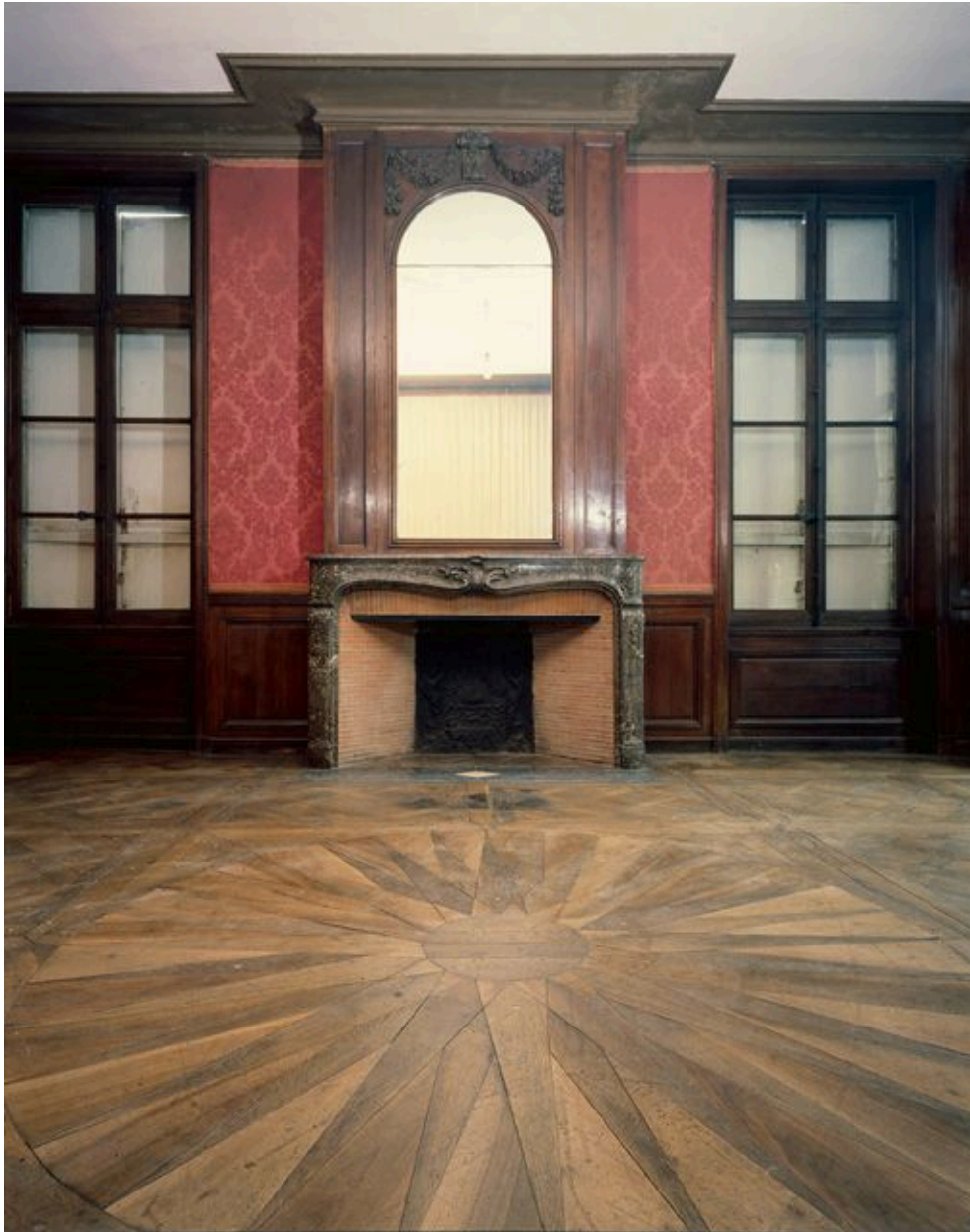
Salon du rez-de-chaussée.