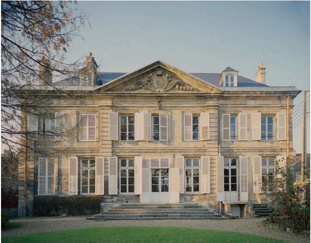
Elévation sur jardin.