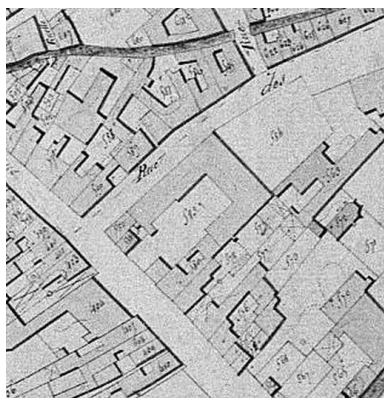
Extrait du cadastre napoléonien (DGI).