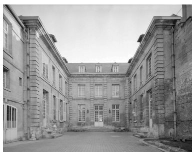
Elévation sur cour. IVR22_19856001470V