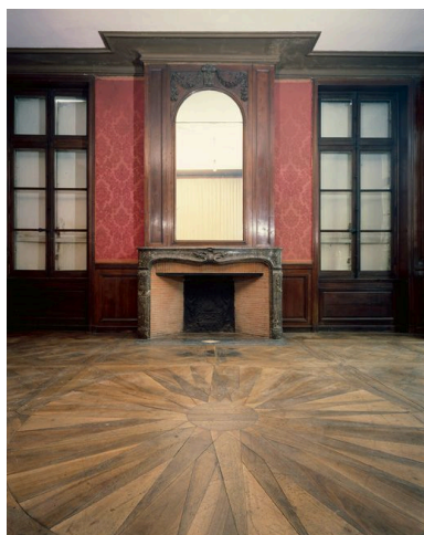
Salon du rez-de-chaussée. IVR22_19856001499VA