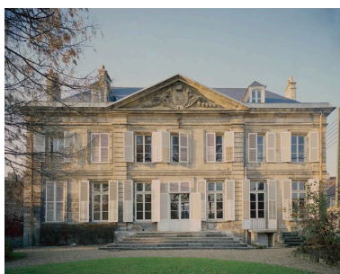
Elévation sur jardin. IVR22_19856001468VA