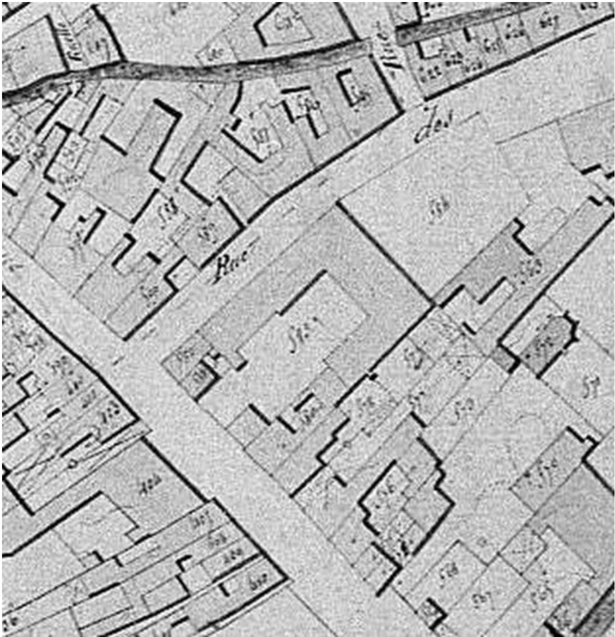
Extrait du cadastre napoléonien (DGI).