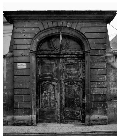
Portail d'entrée. IVR22_19856001551X