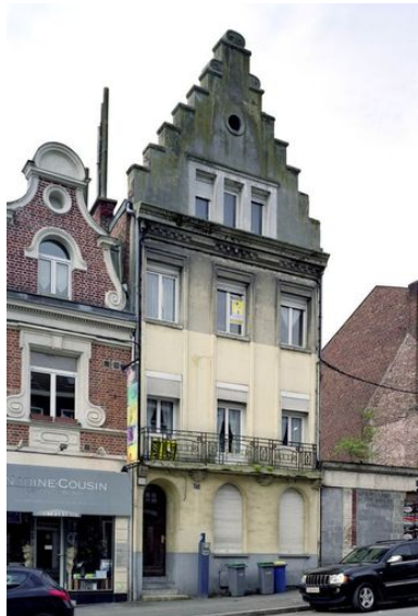
Vue générale. IVR31_20086200161XE