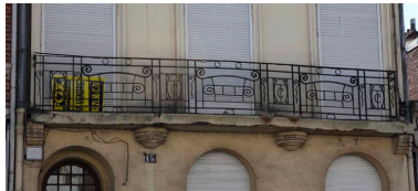
Ferronnerie Art déco. IVR31_20096200292NUCA