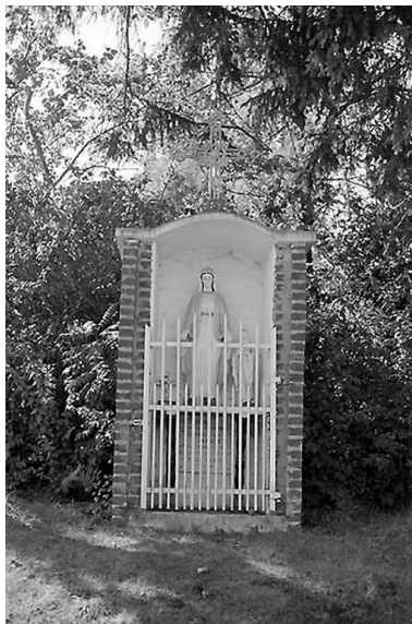
Vue générale. IVR22_19970201653Z