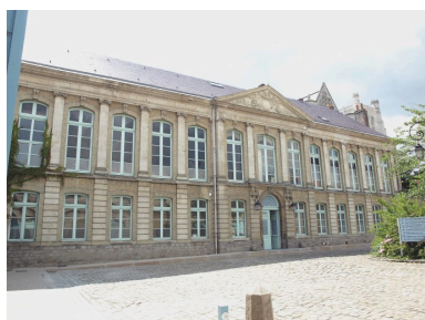
Vue générale sur le corps de logis sud