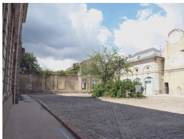
Vue sur la cour IVR31_20106202511NUCA