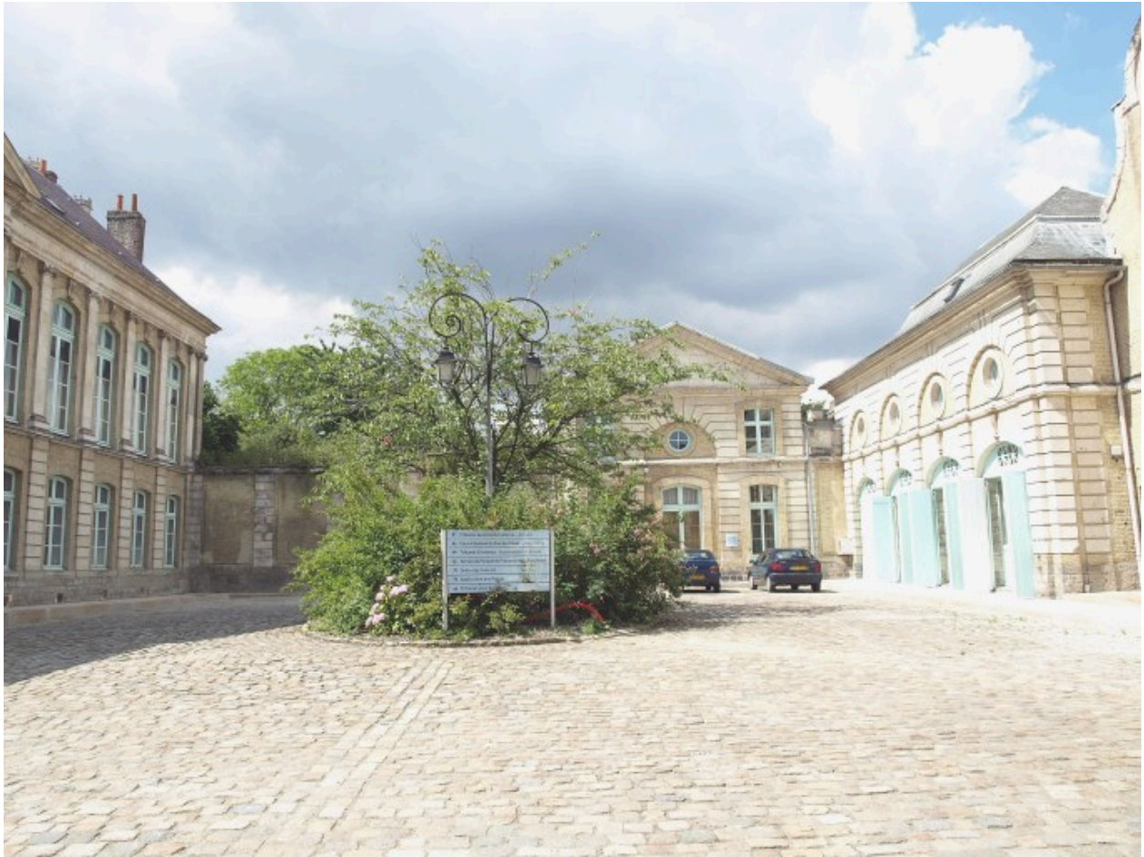
Vue sur le fond de cour, vers le nord