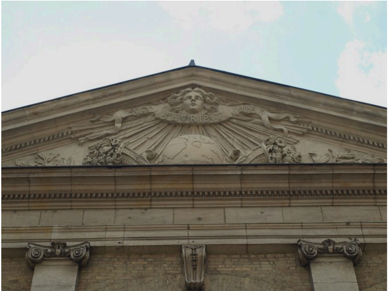
Fronton du corps de logis principal