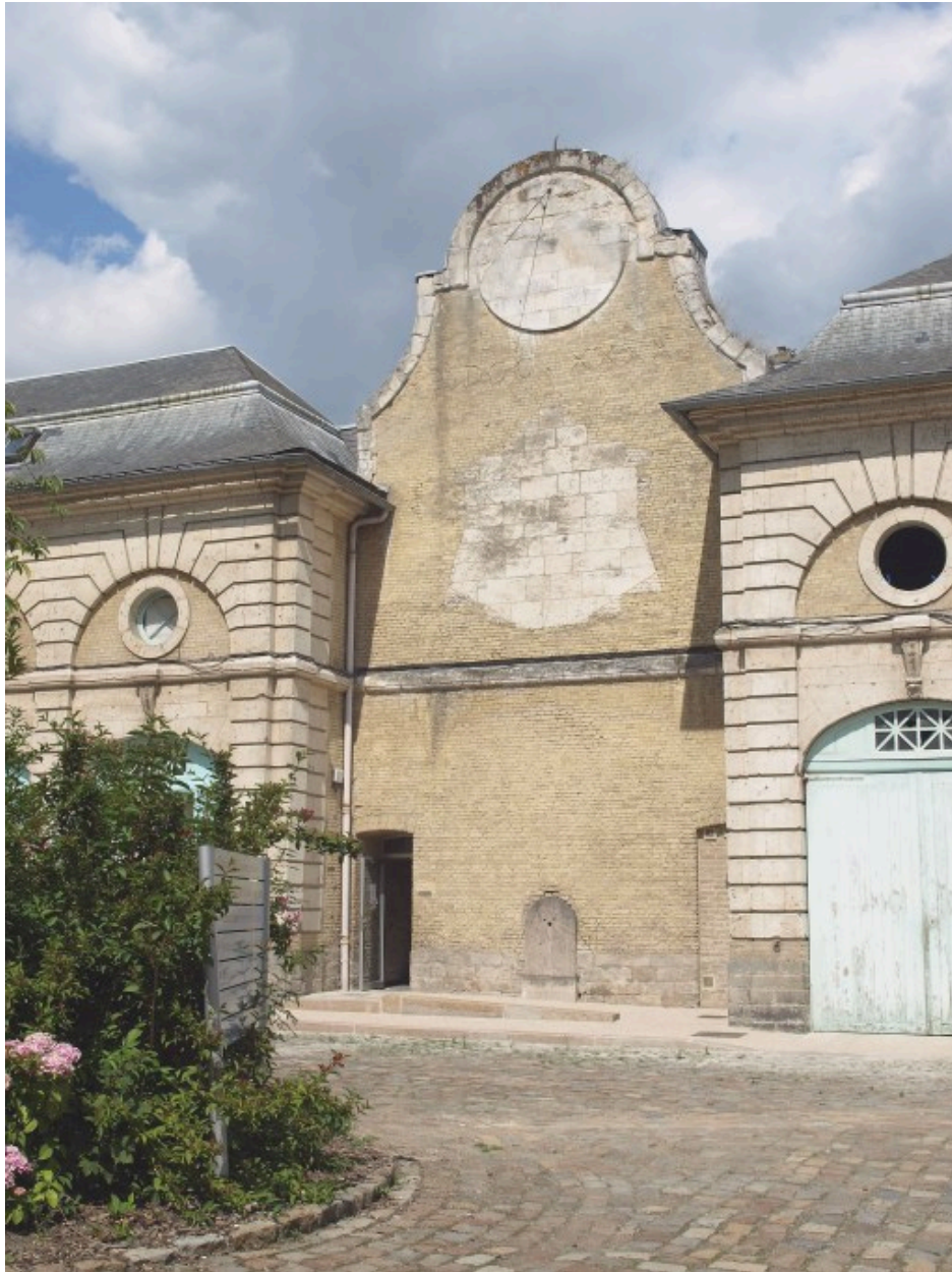
Vue sur le revers du fronton situé au nord