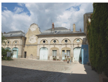
Vue sur les bâtiments donnant sur la rue des tribunaux, vus depuis la cour