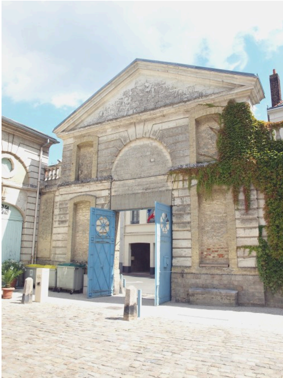
Le portail du palais de justice, vu depuis la cour