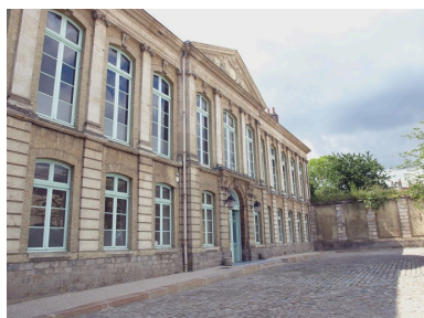
Vue sur le bâtiment principal IVR31_20106202513NUCA