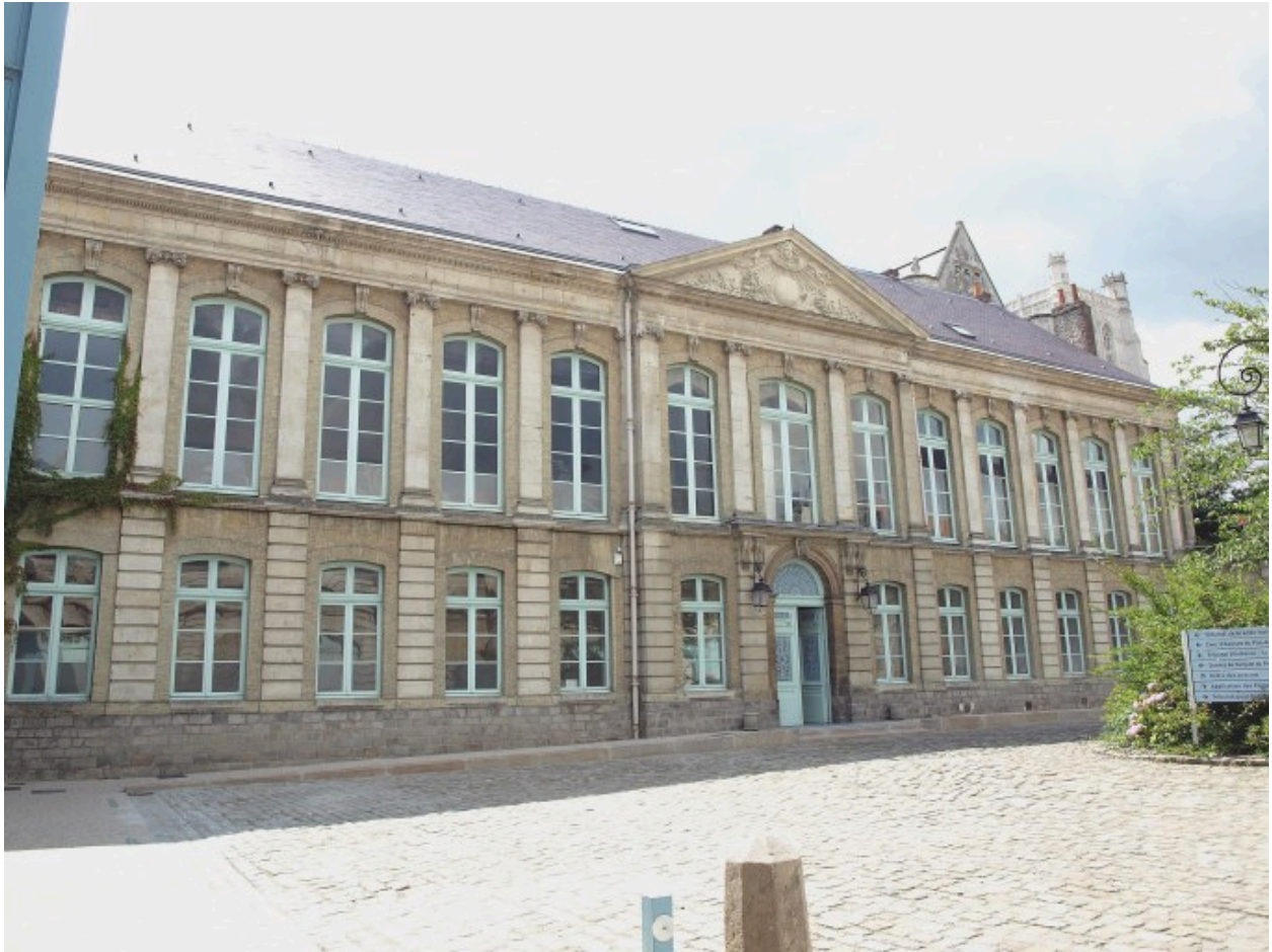
Vue générale sur le corps de logis sud