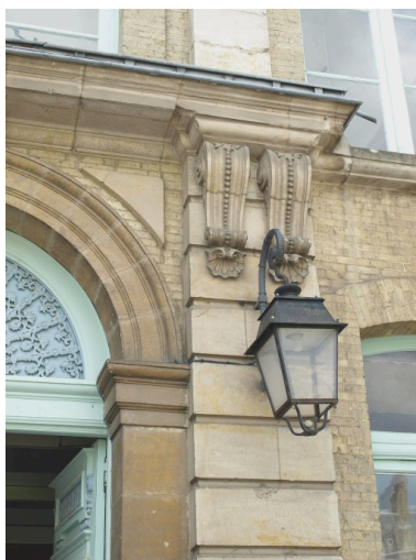
Détail sur la façade du bâtiment principal