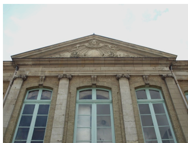
Vue sur la façade du corps de logis principal IVR31_20106202516NUCA