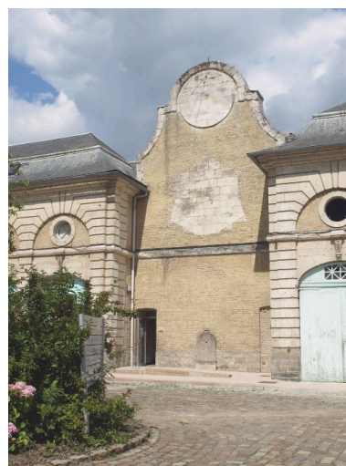
Vue sur le revers du fronton situé au nord IVR31_20106202520NUCA