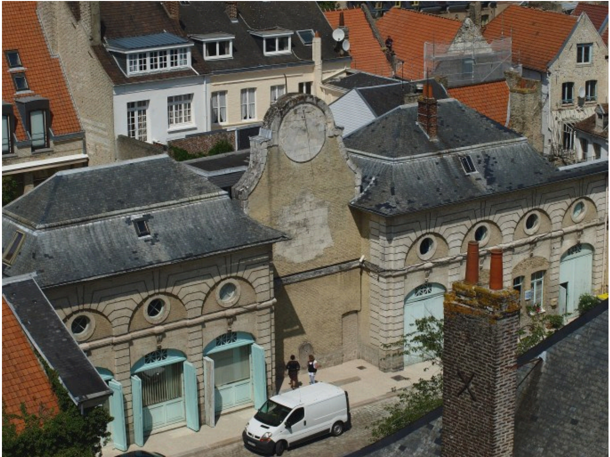
Vue sur la cour depuis la cathédrale