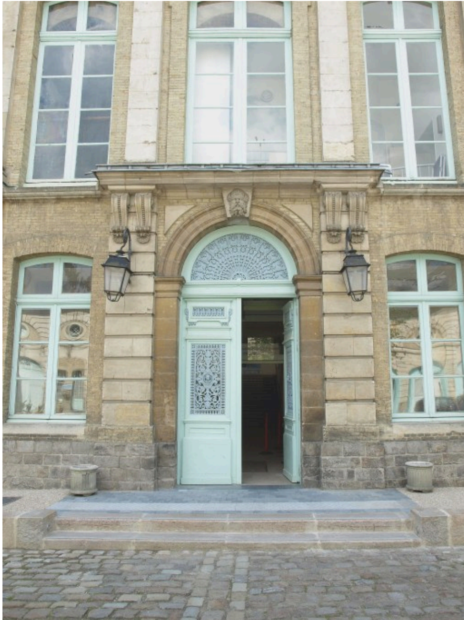
Façade et entrée principale