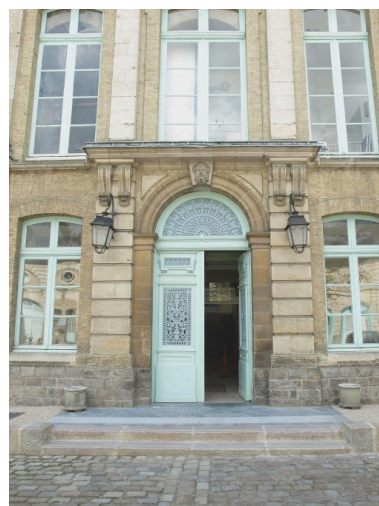
Façade et entrée principale