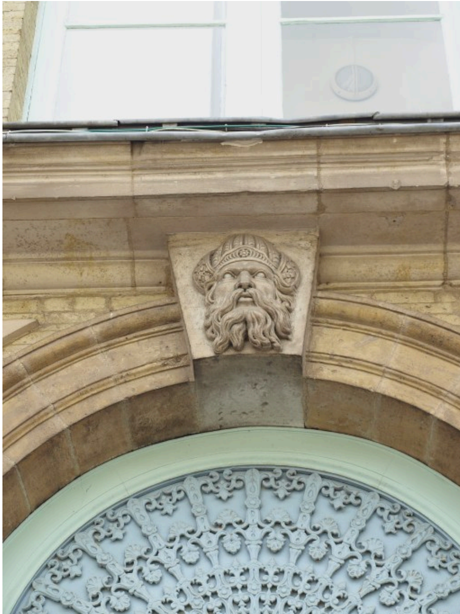
Mascaron de la grande porte d'entrée