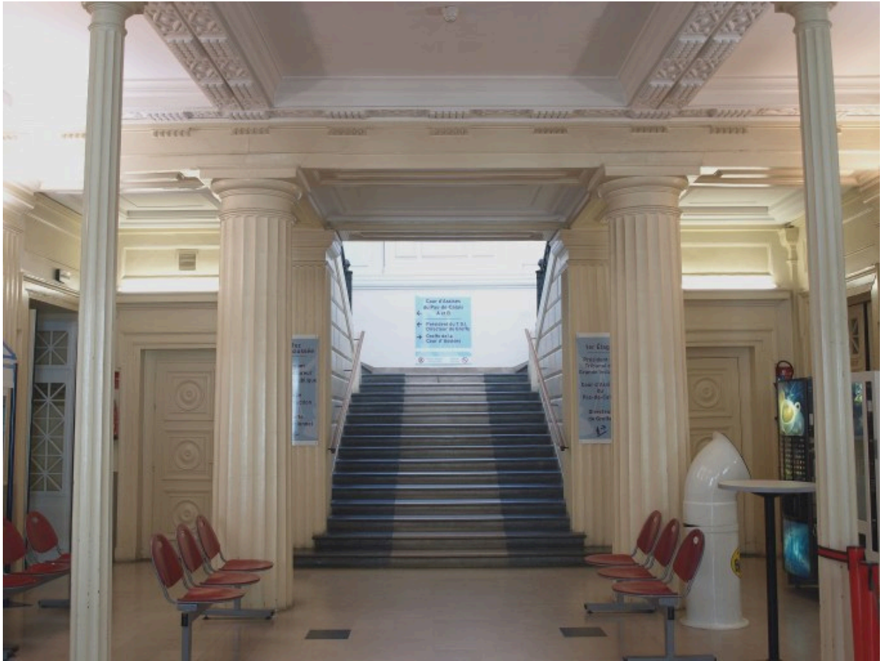
L'entrée du palais de justice. Vue au fond sur le grand escalier menant aux salles d'assises A et B