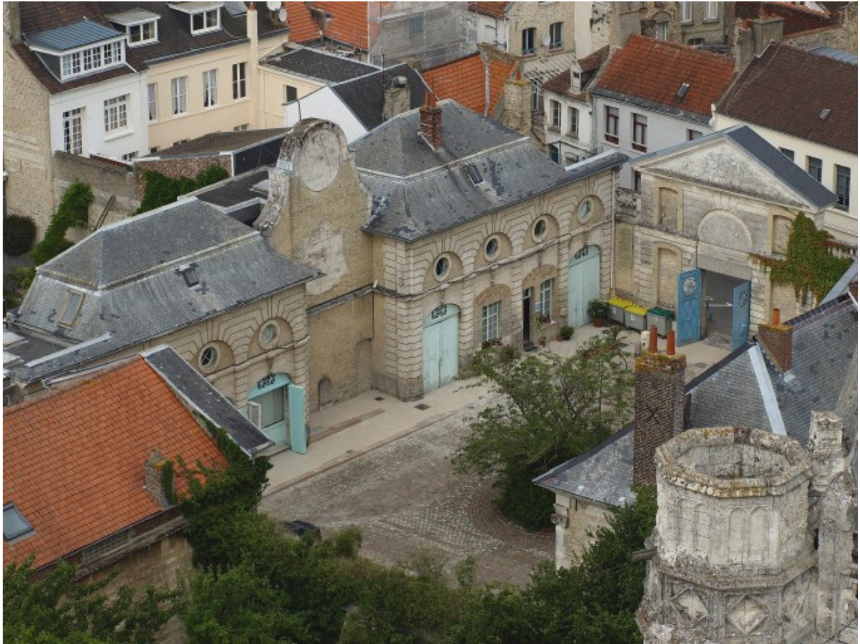
Vue sur le palais de justice depuis la cathédrale