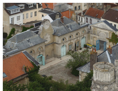
Vue sur le palais de justice depuis la cathédrale IVR31_20106202525NUCA