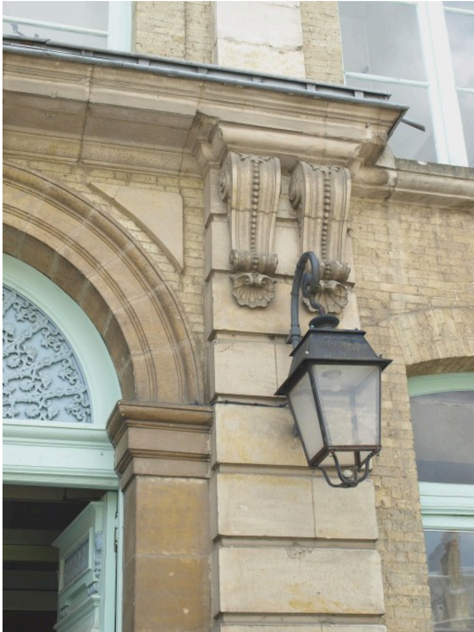
Détail sur la façade du bâtiment principal