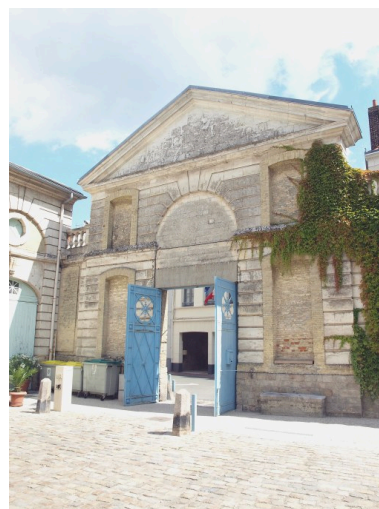
Le portail du palais de justice, vu depuis la cour