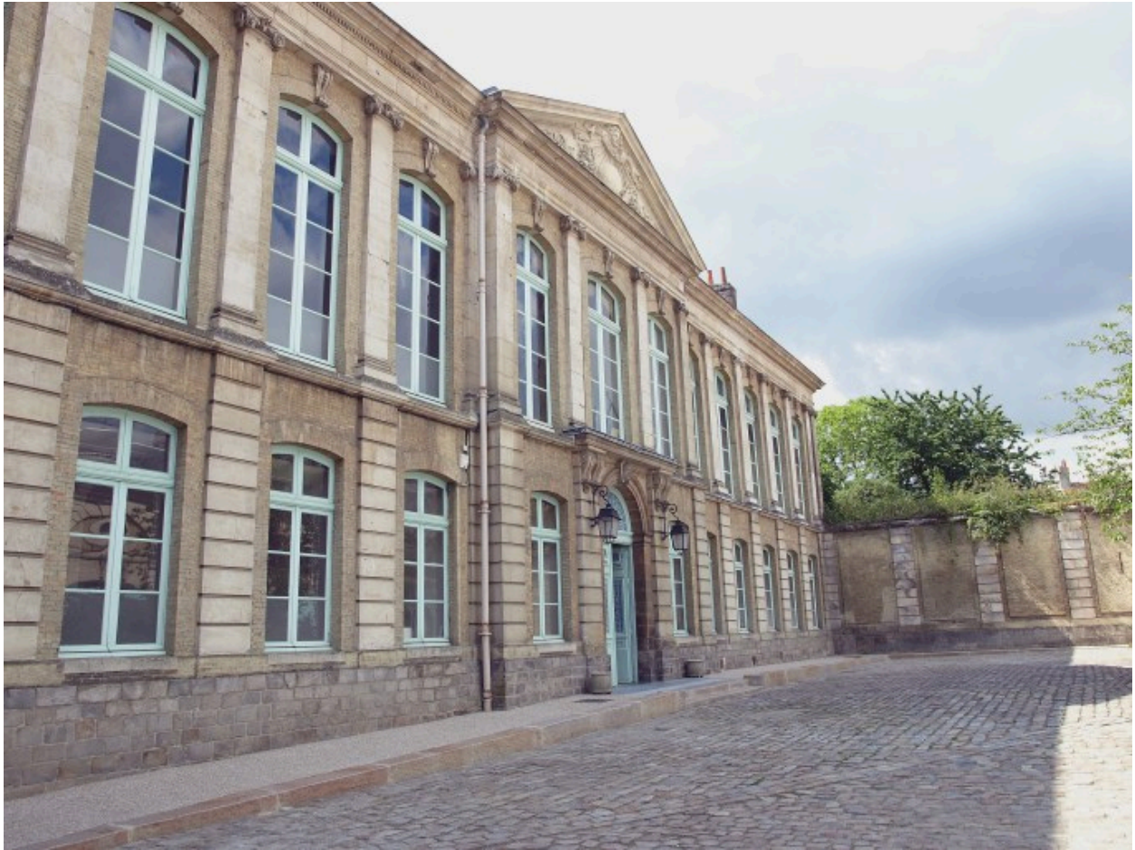
Vue sur le bâtiment principal