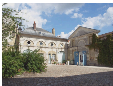
Vue sur la cour côté ouest, et sur le portail d'entrée IVR31_20106202514NUCA