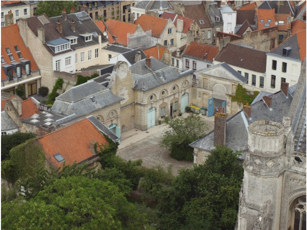
Vue générale prise depuis la cathédrale