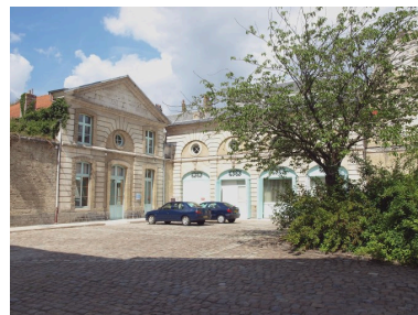
Vue sur la cour IVR31_20106202512NUCA