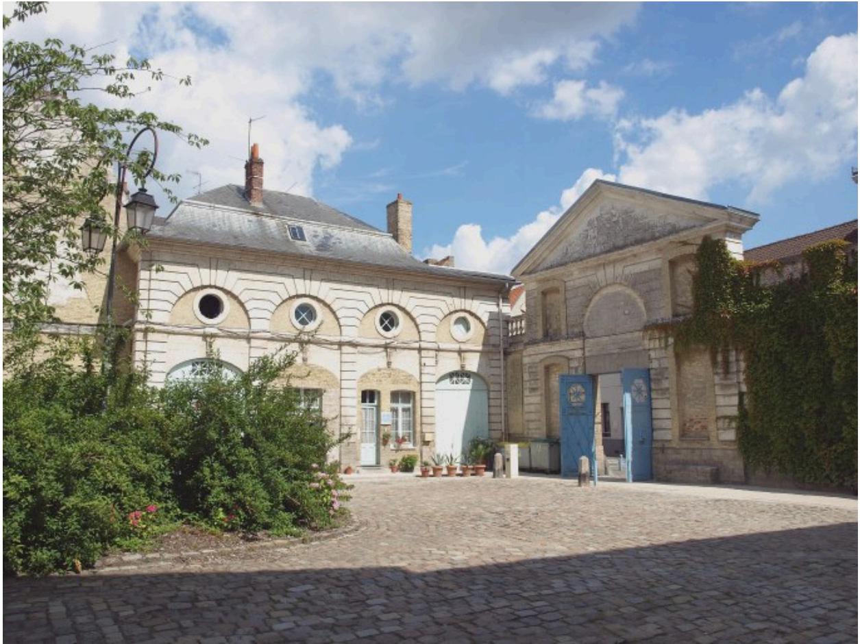
Vue sur la cour côté ouest, et sur le portail d'entrée