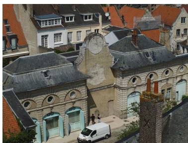
Vue sur la cour depuis la cathédrale IVR31_20106202526NUCA