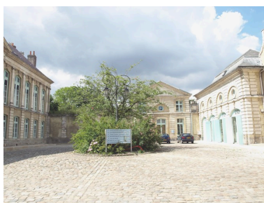
Vue sur le fond de cour, vers le nord IVR31_20106202510NUCA