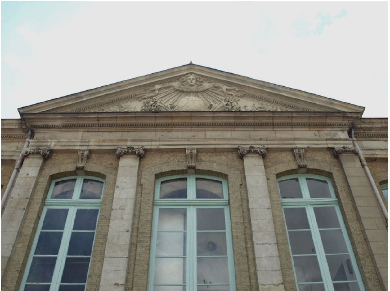
Vue sur la façade du corps de logis principal