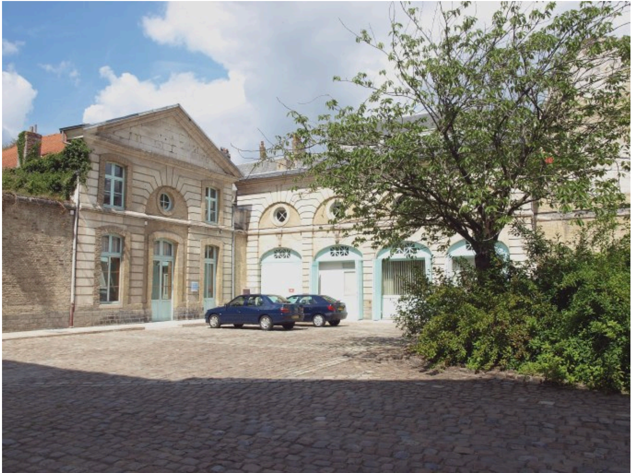
Vue sur la cour