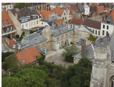
Vue générale prise depuis la cathédrale IVR31_20106202524NUCA