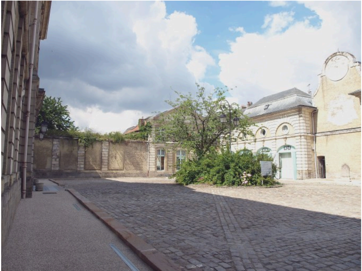
Vue sur la cour