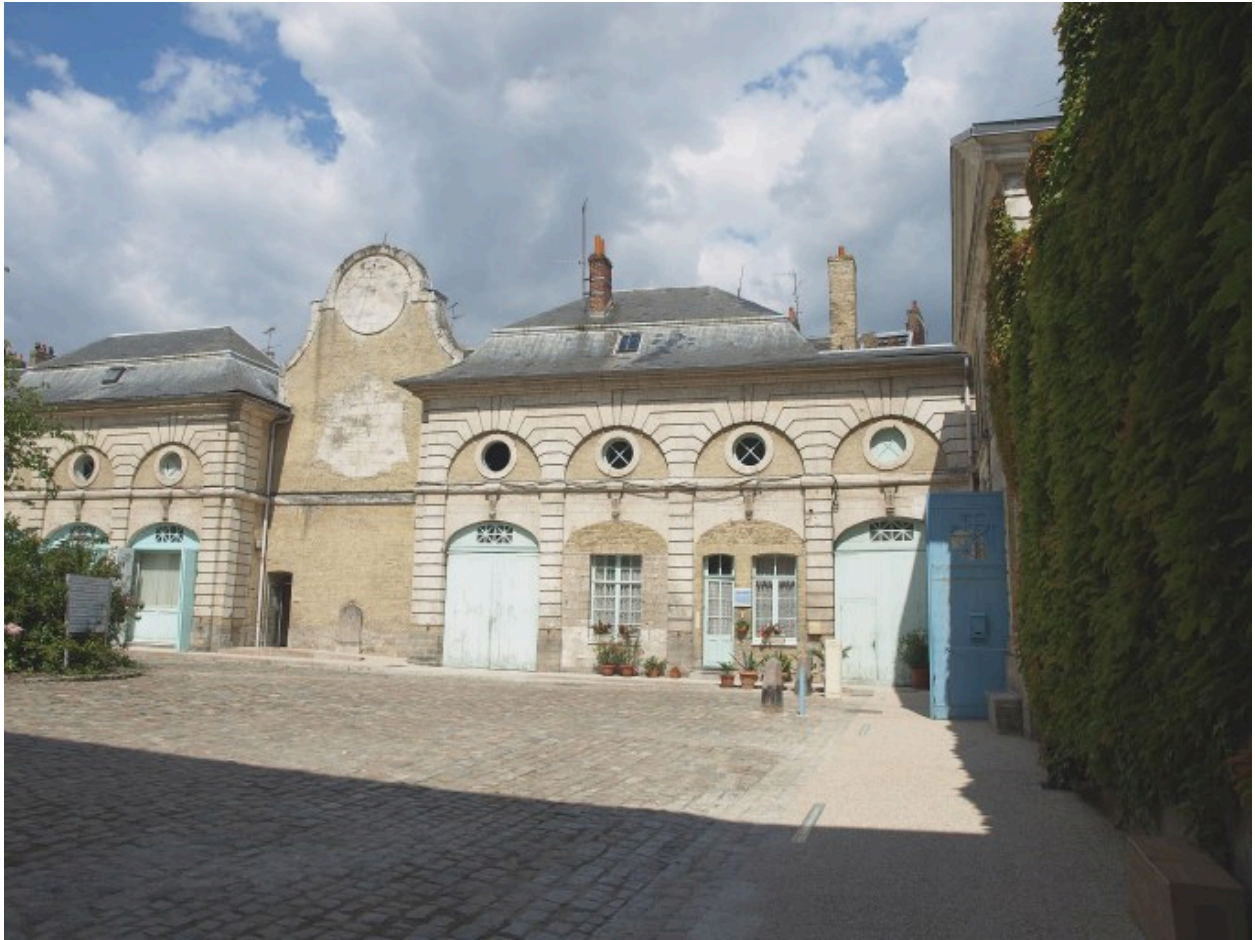
Vue sur les bâtiments donnant sur la rue des tribunaux, vus depuis la cour