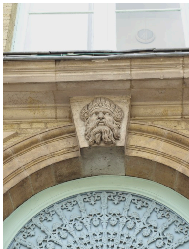
Mascaron de la grande porte d'entrée IVR31_20106202518NUCA