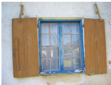
Vue d'un contrevent avec système d'attache à tourniquet.