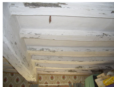
Vue du plafond de la chambre. IVR22_20068005229NUCA