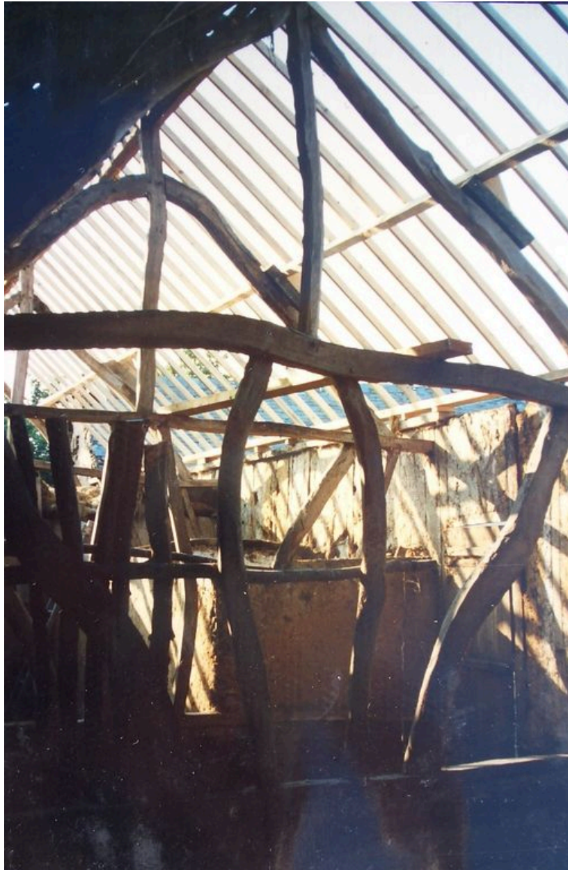
Vue de la charpente des étables.