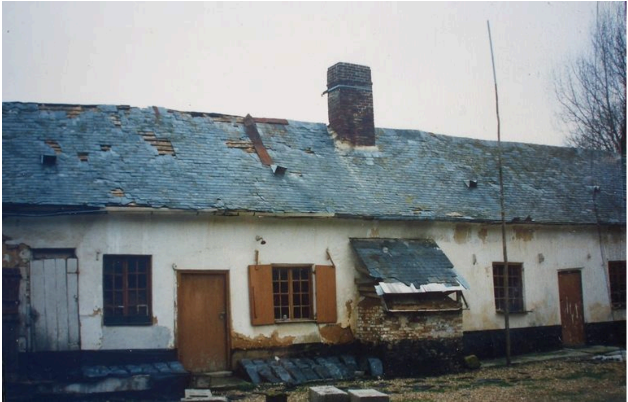
Vue du logis avant sa restauration.