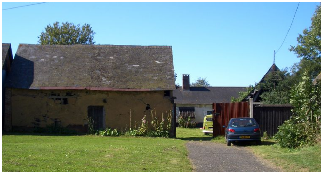
Vue générale depuis la place.