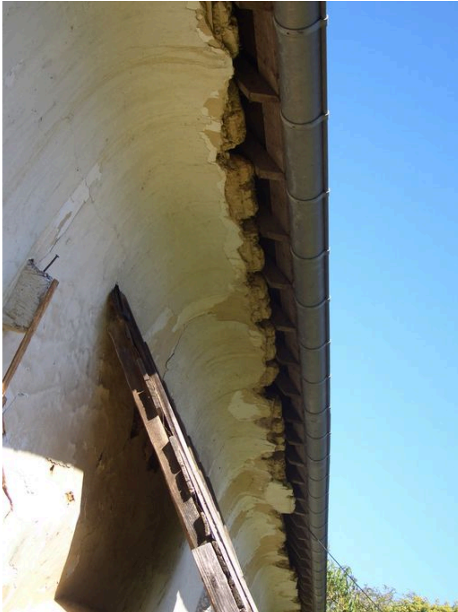
Vue de la corniche arrondie, dite voûte.