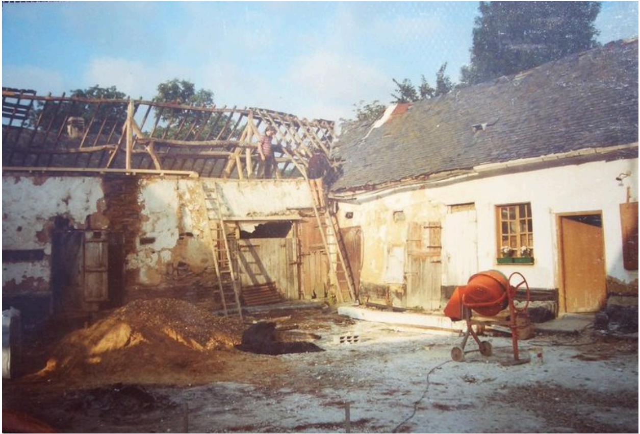
Autre vue des étables.