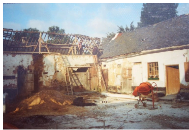
Autre vue des étables.