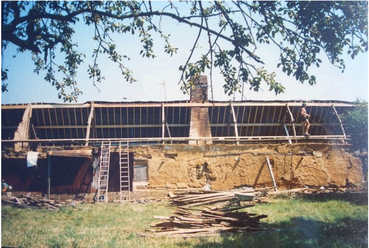
Vue postérieure du logis.