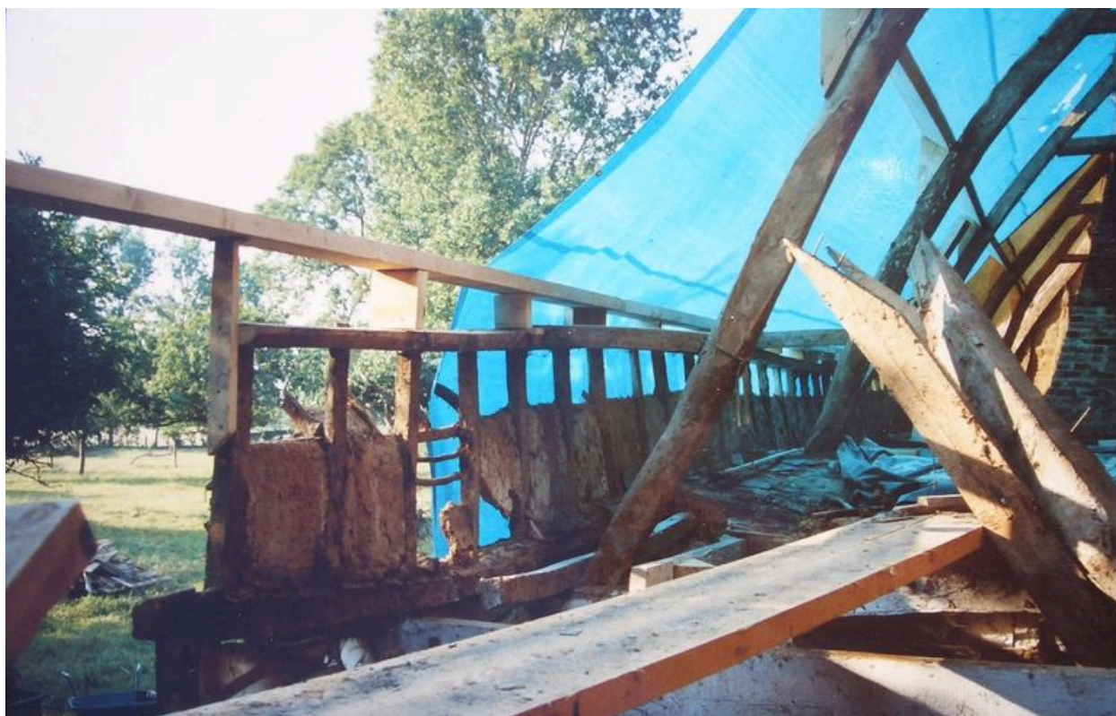
Vue de la charpente du logis.