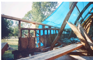
Vue de la charpente du logis.