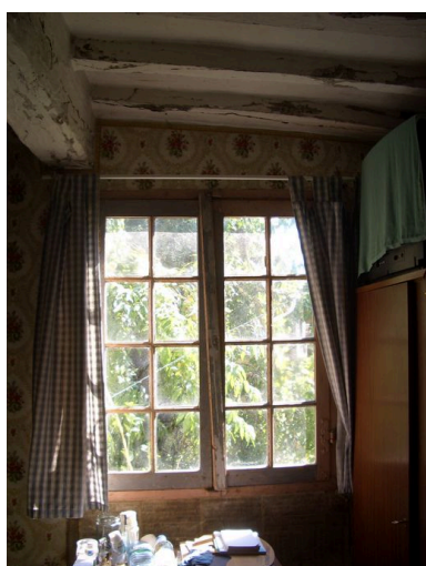
Vue de la fenêtre de la chambre avec système de fermeture à tourniquet.