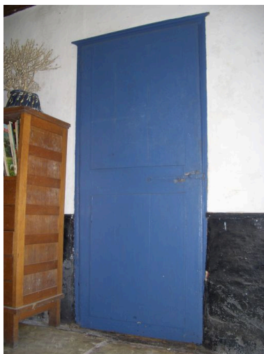
Porte menant de la salle commune à la chambre avec entablement mouluré. IVR22_20068005228NUCA