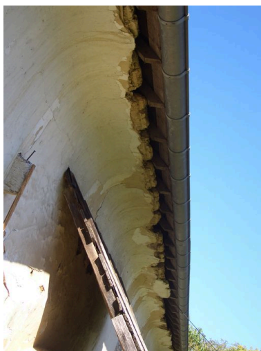
Vue de la corniche arrondie, dite voûte. IVR22_20068005218NUCA