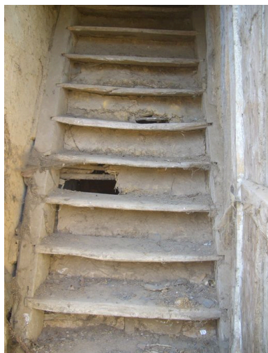
Vue de l'escalier de meunier menant aux combles.