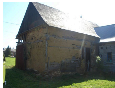
Vue de la grange sur rue.