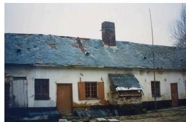
Vue du logis avant sa restauration. IVR22_20068005257NUCAB