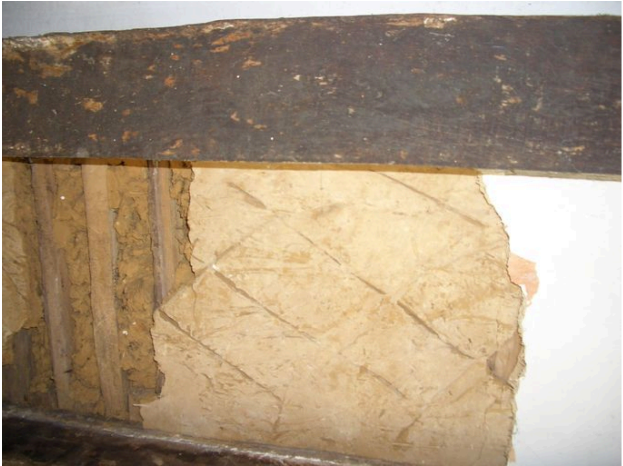
Vue détaillée du plafond de la salle avec système de stries pour une meilleure adhérence de l'enduit.