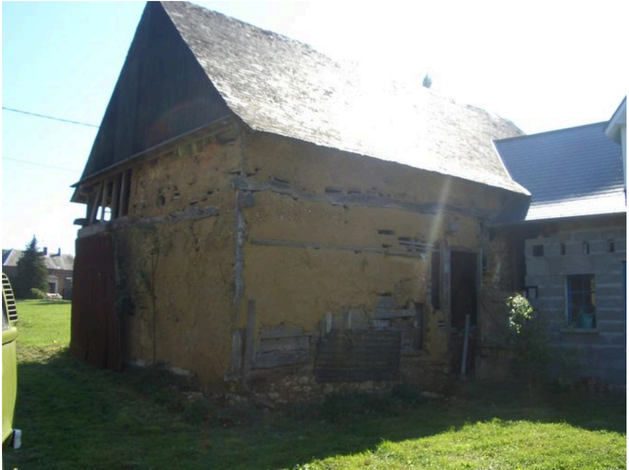
Vue de la grange sur rue.