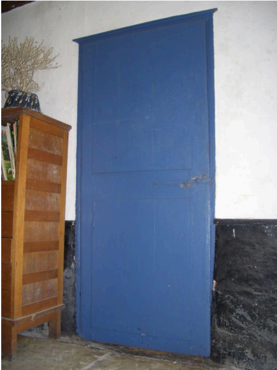
Porte menant de la salle commune à la chambre avec entablement mouluré.