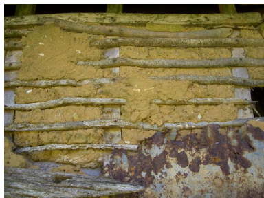
Détail de la confection du torchis. IVR22_20068005222NUCA