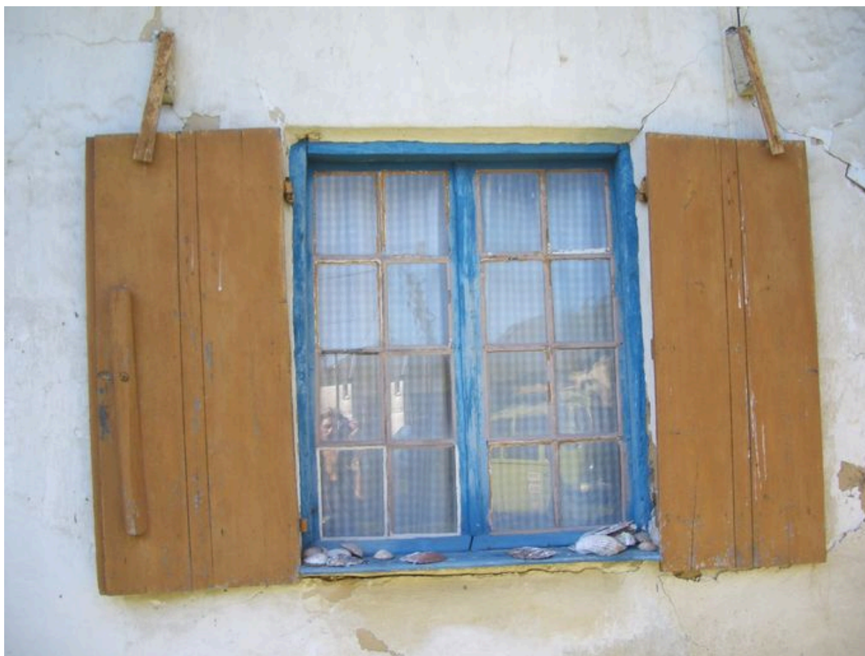
Vue d'un contrevent avec système d'attache à tourniquet.