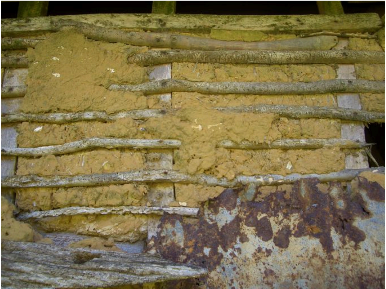
Détail de la confection du torchis.