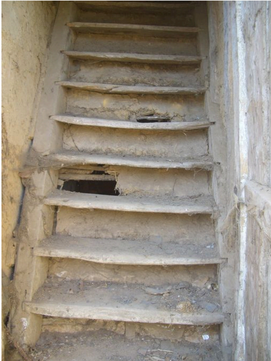
Vue de l'escalier de meunier menant aux combles.