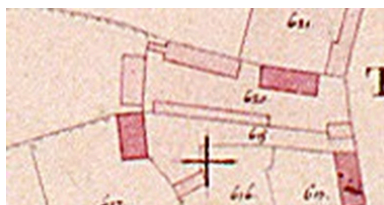
Plan de la ferme en 1832 extrait du cadastre napoléonien. IVR22_20068005683XAB