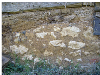
Vue du solin de la grange composé de moellons de calcaire et silex.