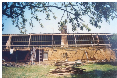
Vue postérieure du logis.