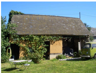
Vue de la grange située au sud avec puits mitoyen.