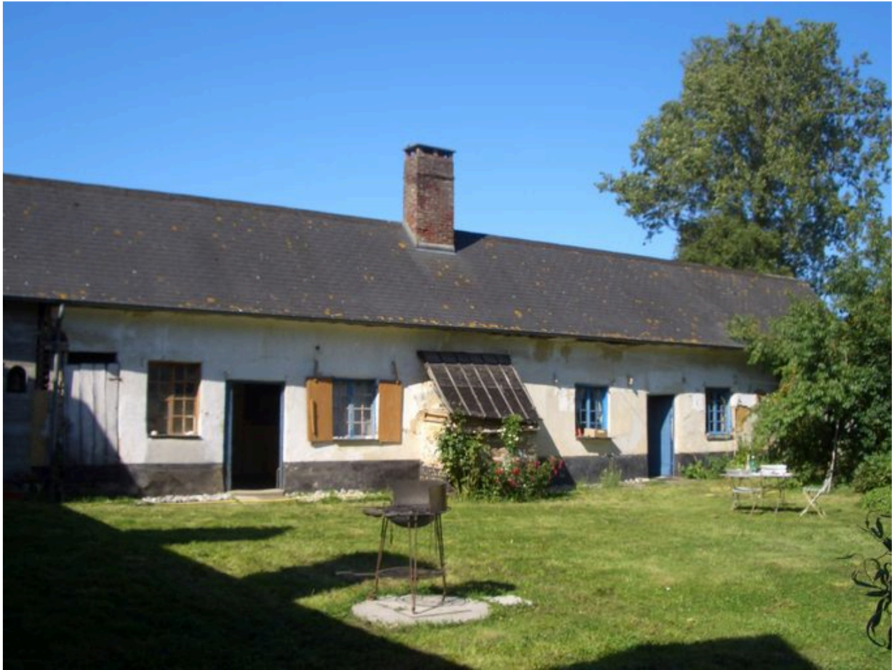
Vue du logis.