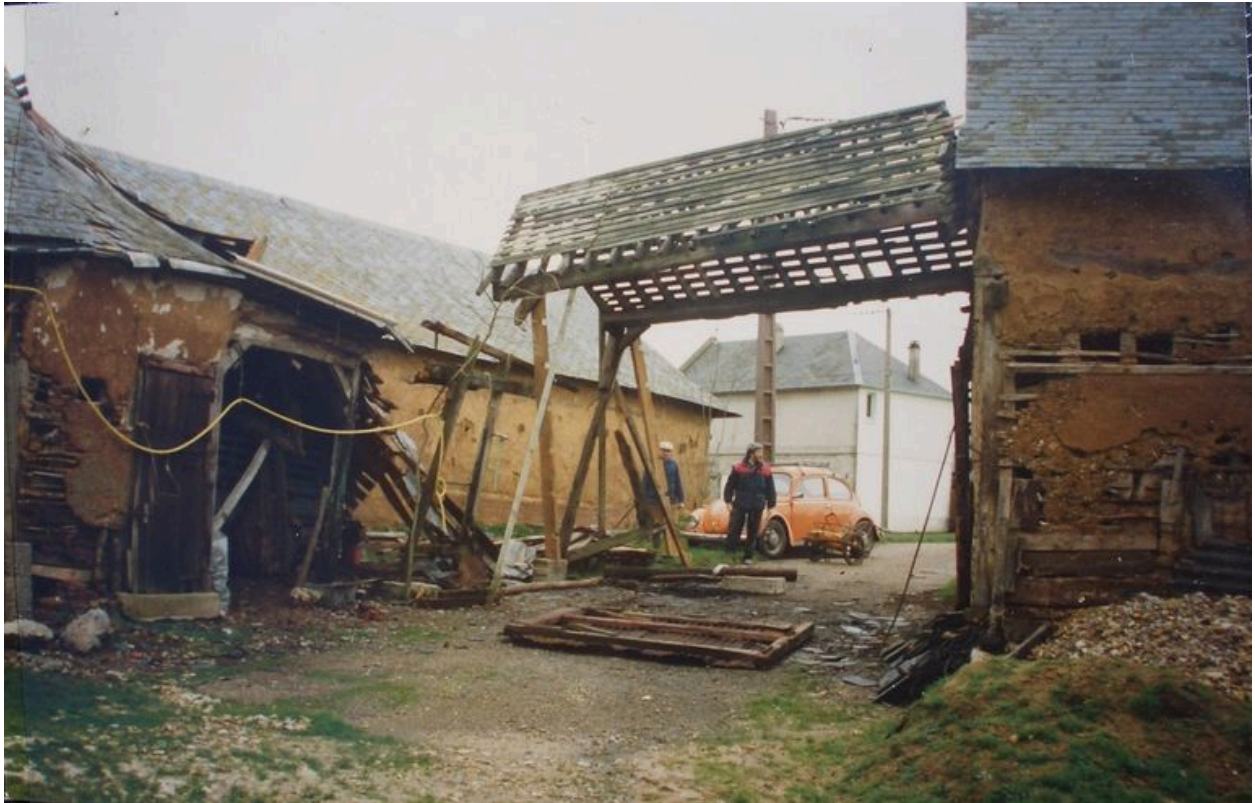
Vue du corps de passage en cours de démantèlement.