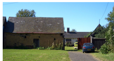
Vue générale depuis la place.