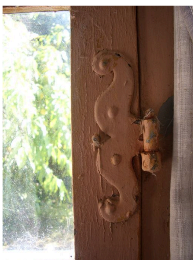
Détail de la ferrure de fenêtre à profil dit de vipère ou de moustache.