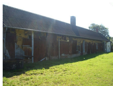
Vue postérieure.