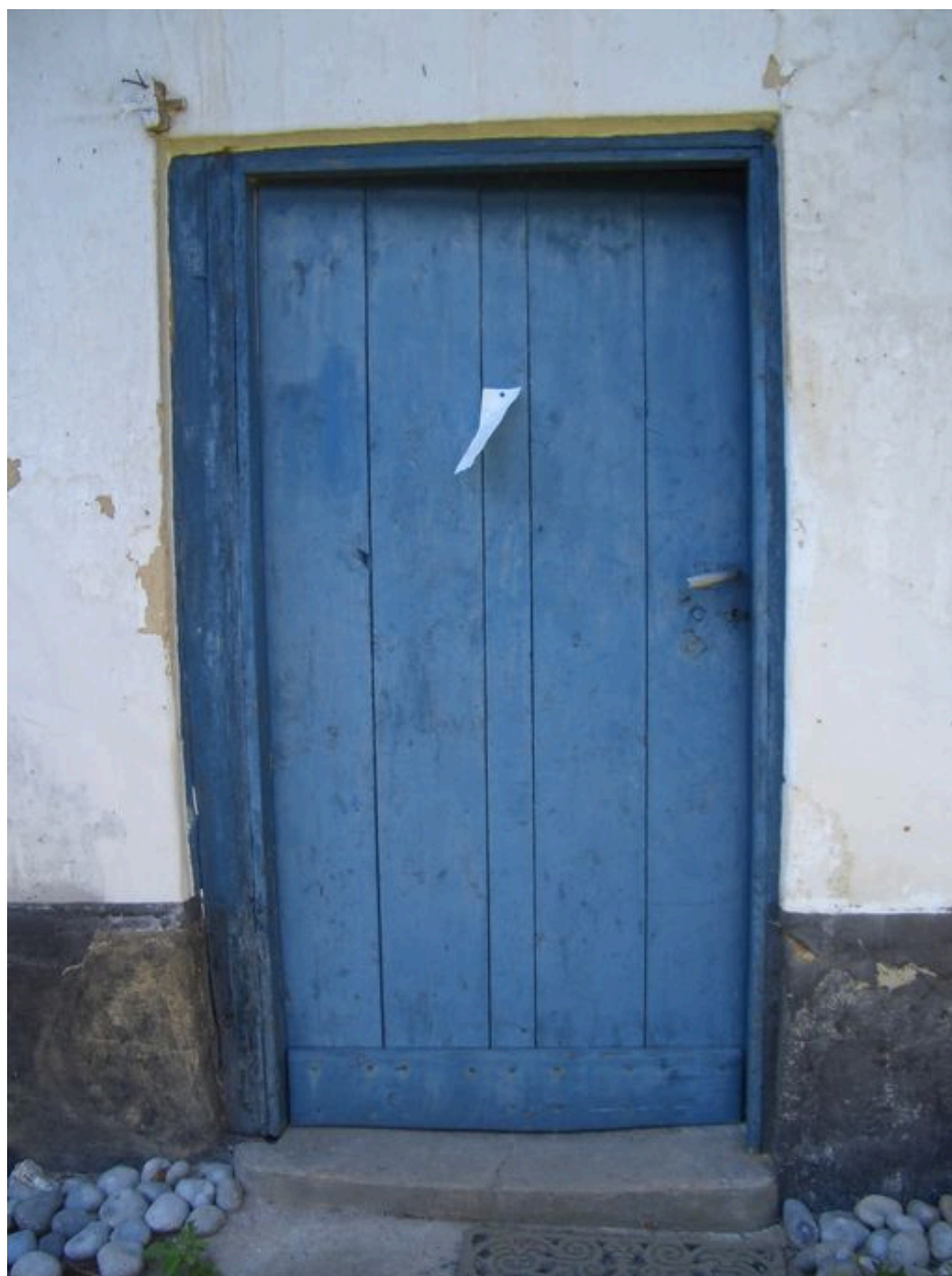
Vue de la porte d'entrée.