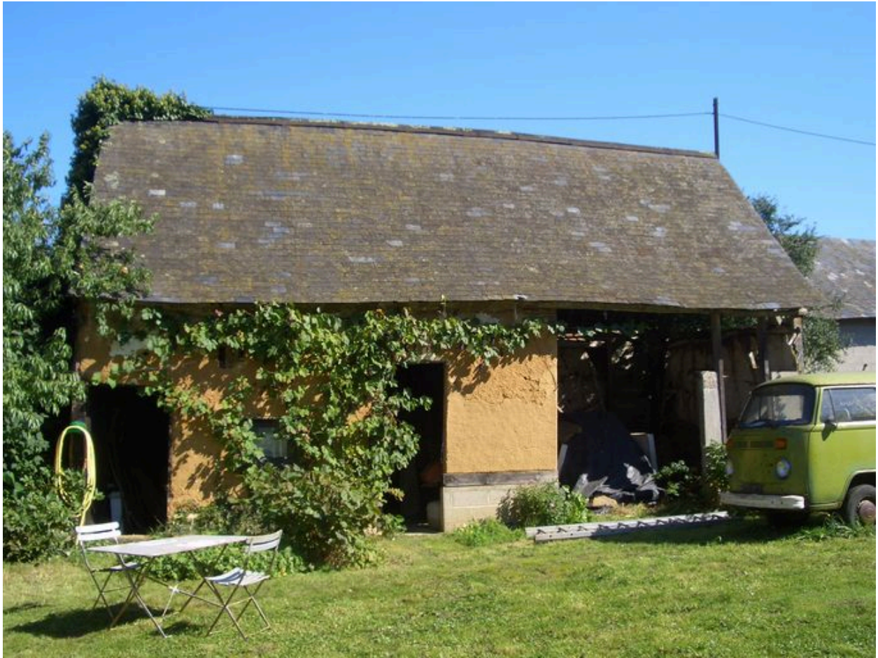
Vue de la grange située au sud avec puits mitoyen.