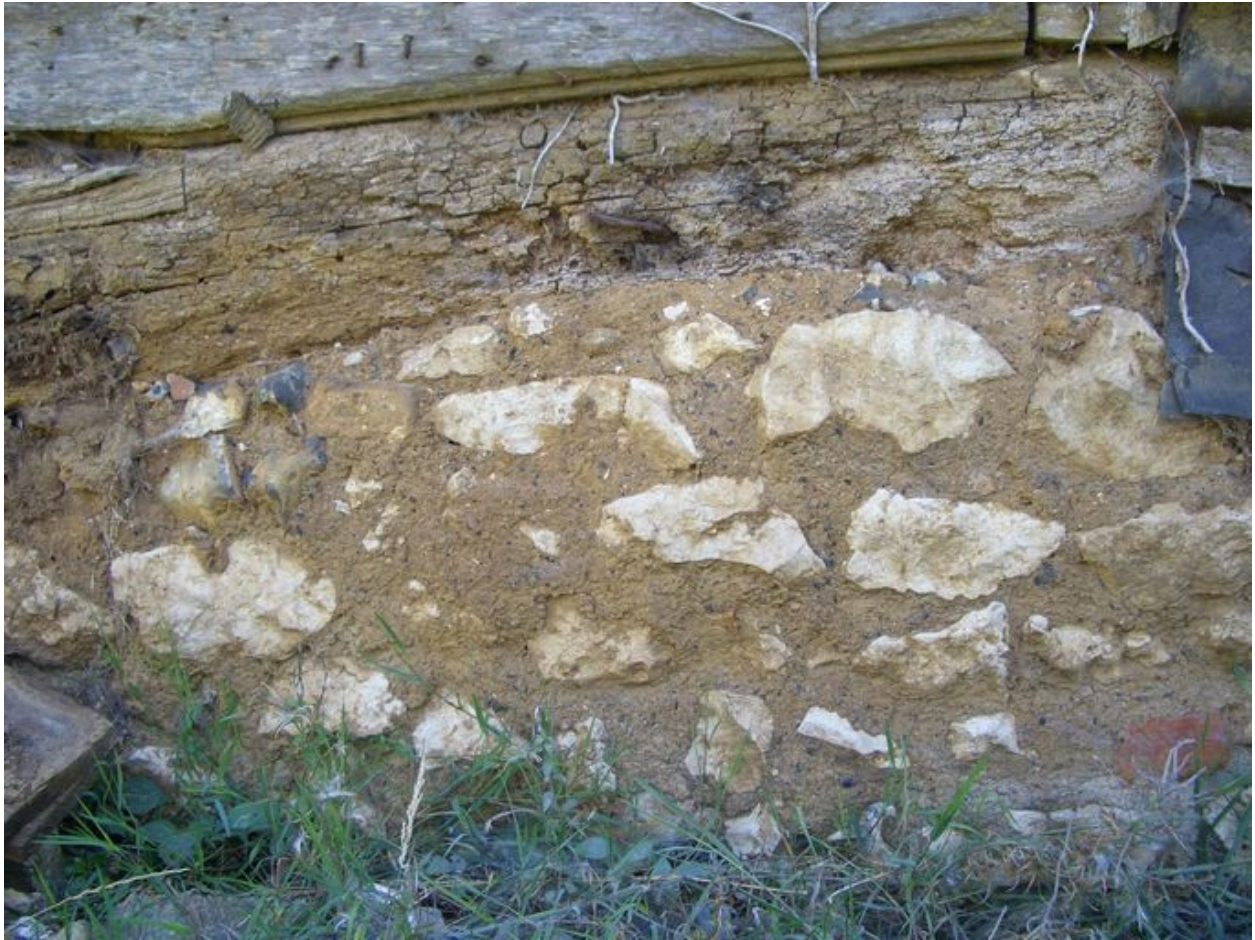
Vue du solin de la grange composé de moellons de calcaire et silex.