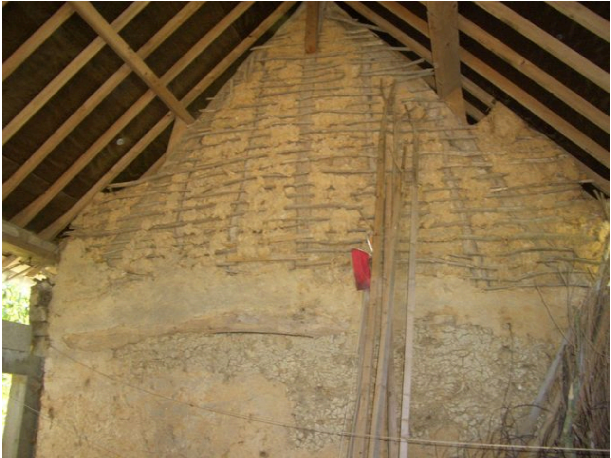
Vue du pignon sud du logis, mitoyen de l'espace dans lequel le cidre était confectionné.