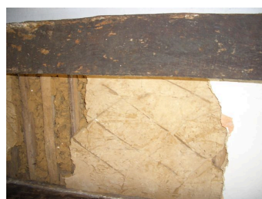
Vue détaillée du plafond de la salle avec système de stries pour une meilleure adhérence de l'enduit.