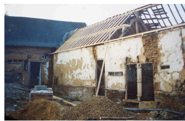
Vue des étables aujourd'hui entièrement reconstruites.