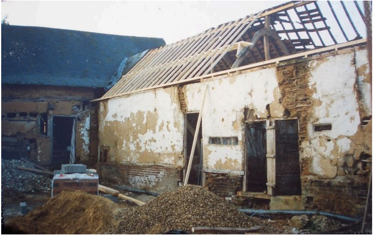
Vue des étables aujourd'hui entièrement reconstruites.