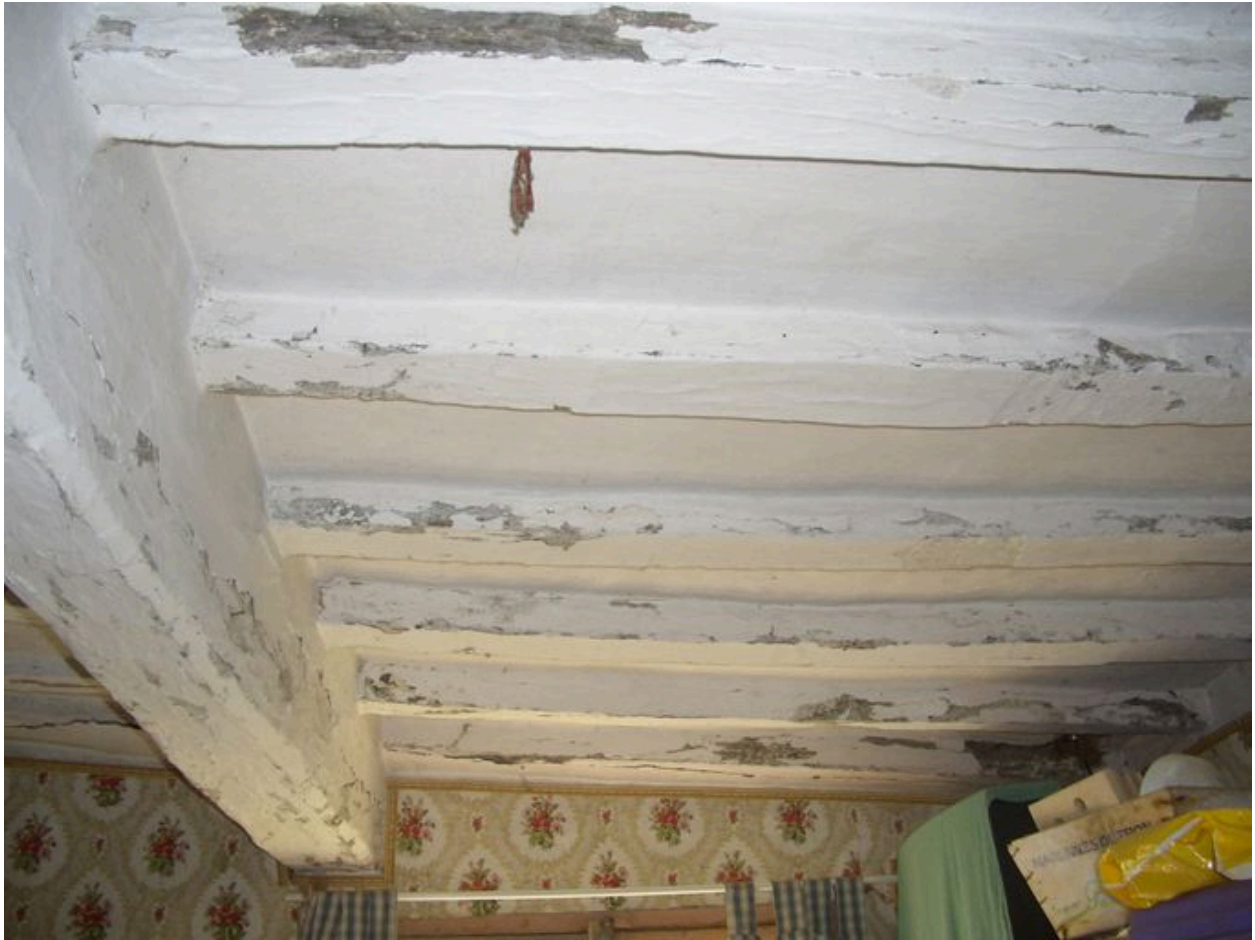
Vue du plafond de la chambre.