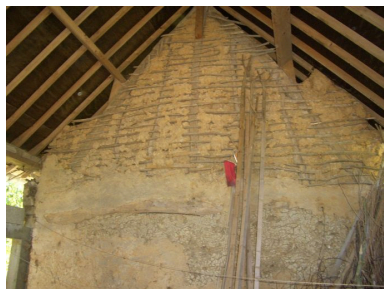
Vue du pignon sud du logis, mitoyen de l'espace dans lequel le cidre était confectionné.