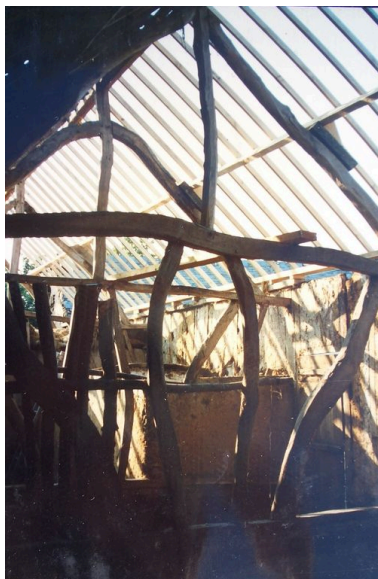
Vue de la charpente des étables. IVR22_20068005256NUCAB