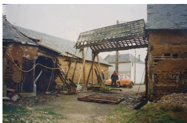
Vue du corps de passage en cours de démantèlement. IVR22_20068005251NUCAB