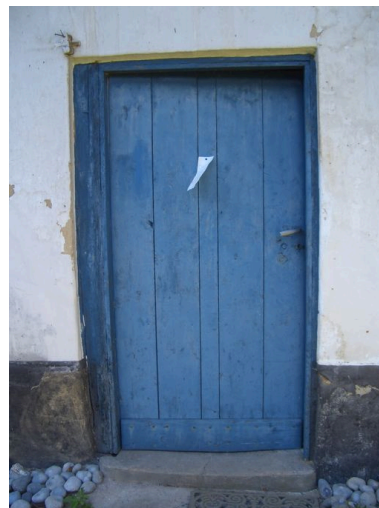
Vue de la porte d'entrée. IVR22_20068005225NUCA