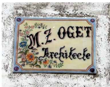
Détail du carreaux de céramique portant signature de l'architecte. IVR22_20048001493NUCA