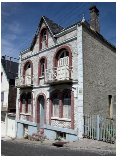
Vue d'ensemble. IVR22_20048001491NUCA