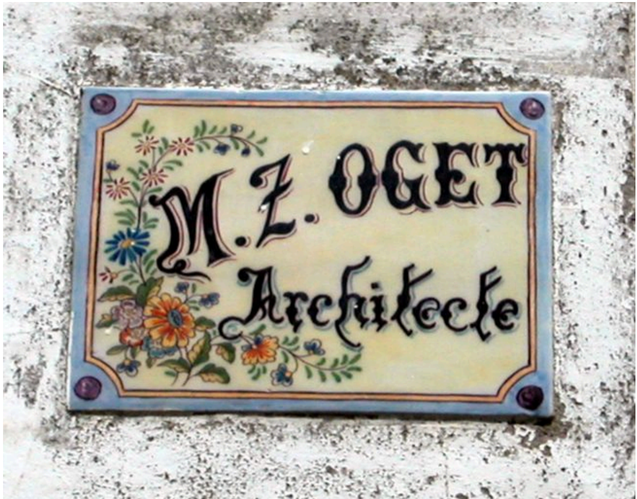
Détail du carreaux de céramique portant signature de l'architecte.