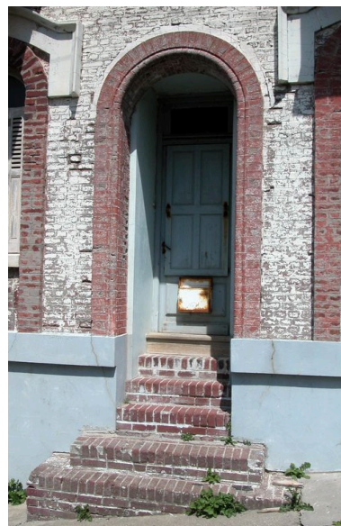
Détail de l'entrée.