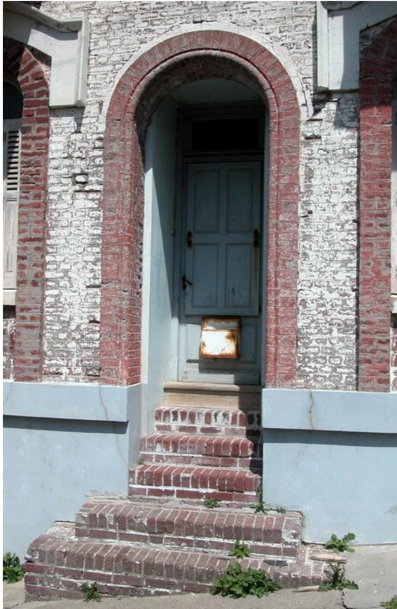
Détail de l'entrée.