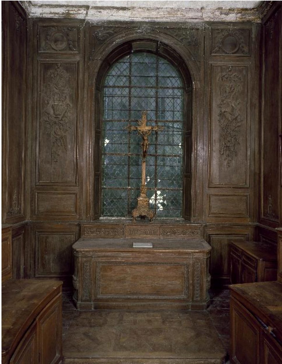
Vue générale de l'autel et de son environnement.