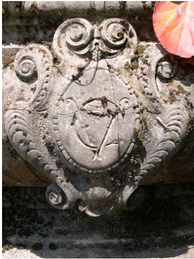
Vue de détail du monogramme gravé sur la face antérieure de l jardinière à plantes.