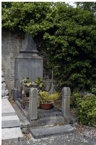
Vue générale. IVR22_20058001264NUCA