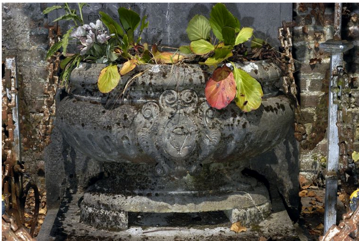
Jardinière à plantes en marbre.