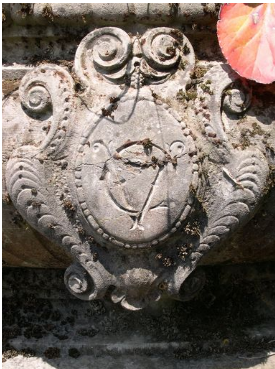
Vue de détail du monogramme gravé sur la face antérieure de l jardinière à plantes.