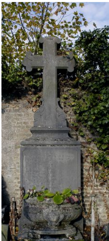
Vue de la stèle à croix. IVR22_20058002082NUCA