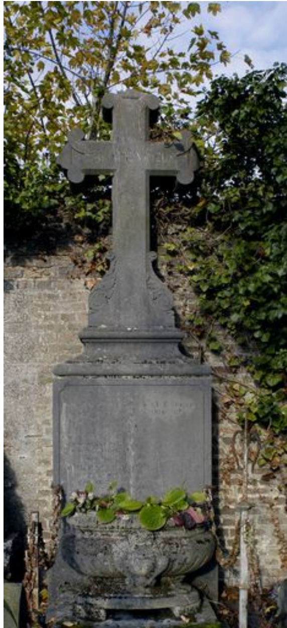
Vue de la stèle à croix.