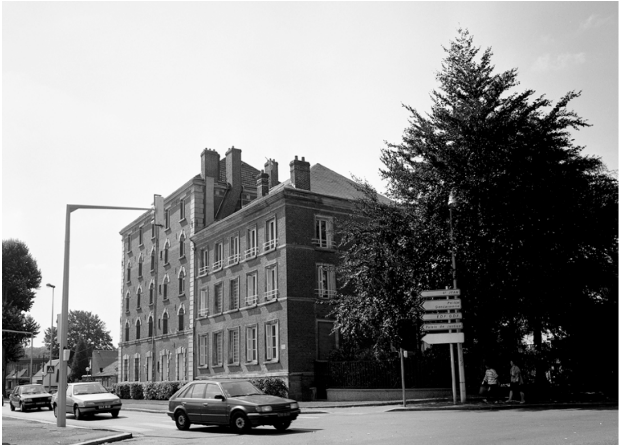
Vue latérale est-ouest.