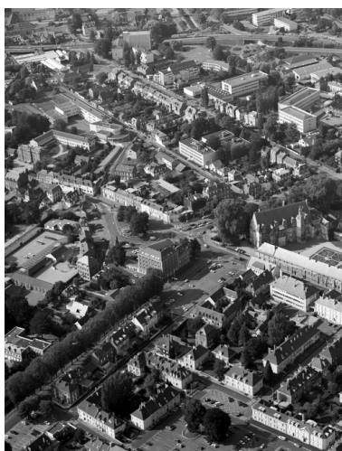
Vue aérienne du moulin en 1994. IVR22_19946001535X