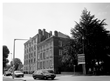
Vue latérale est-ouest.