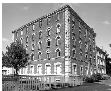
Vue latérale sud nord. IVR22_19966002703X