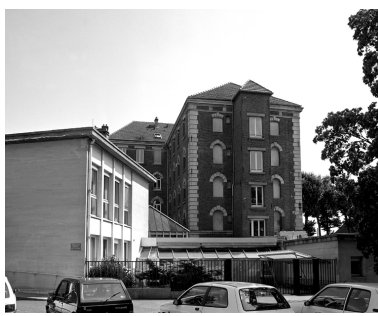
Vue antérieure ouest.