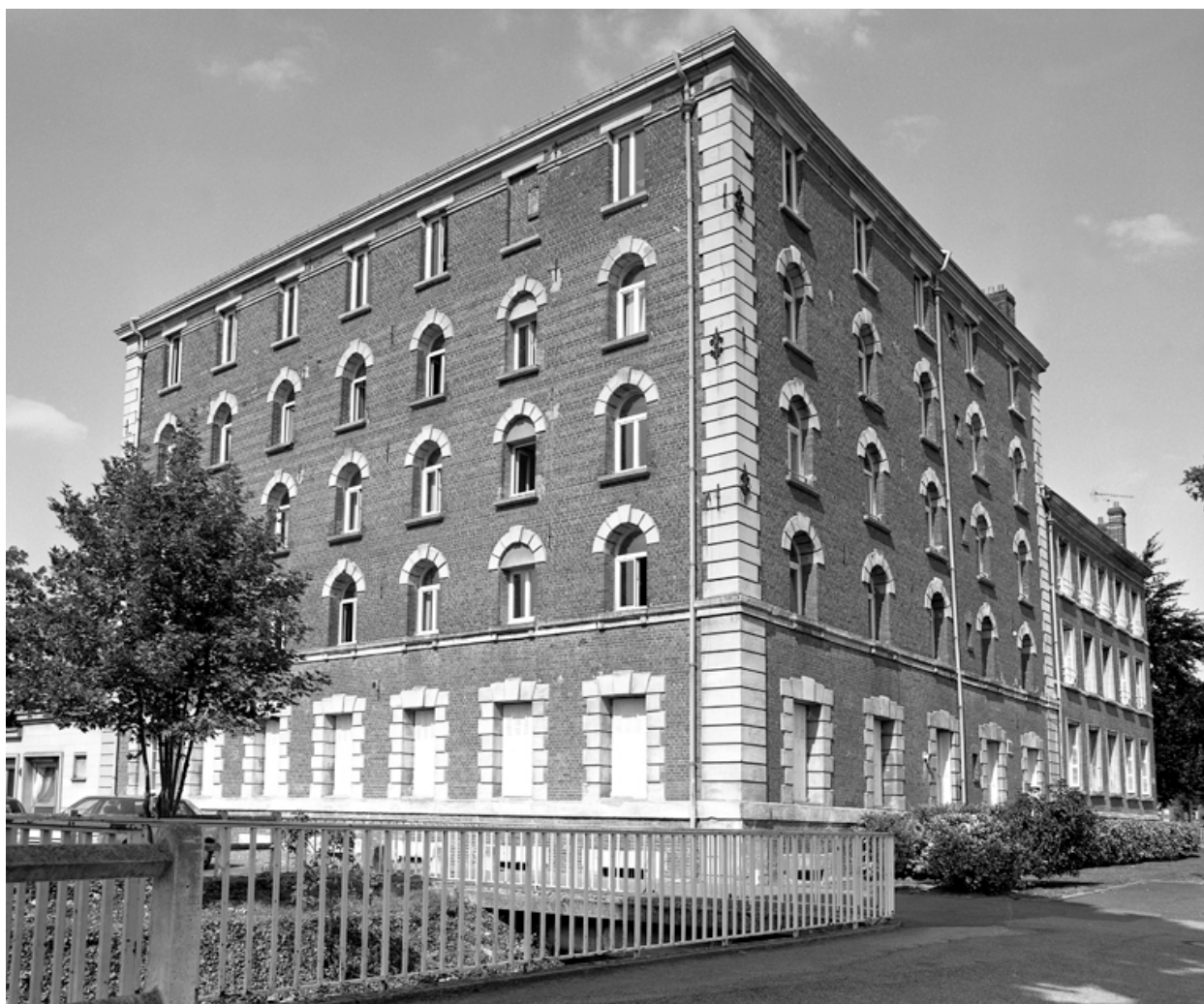
Vue latérale sud nord.