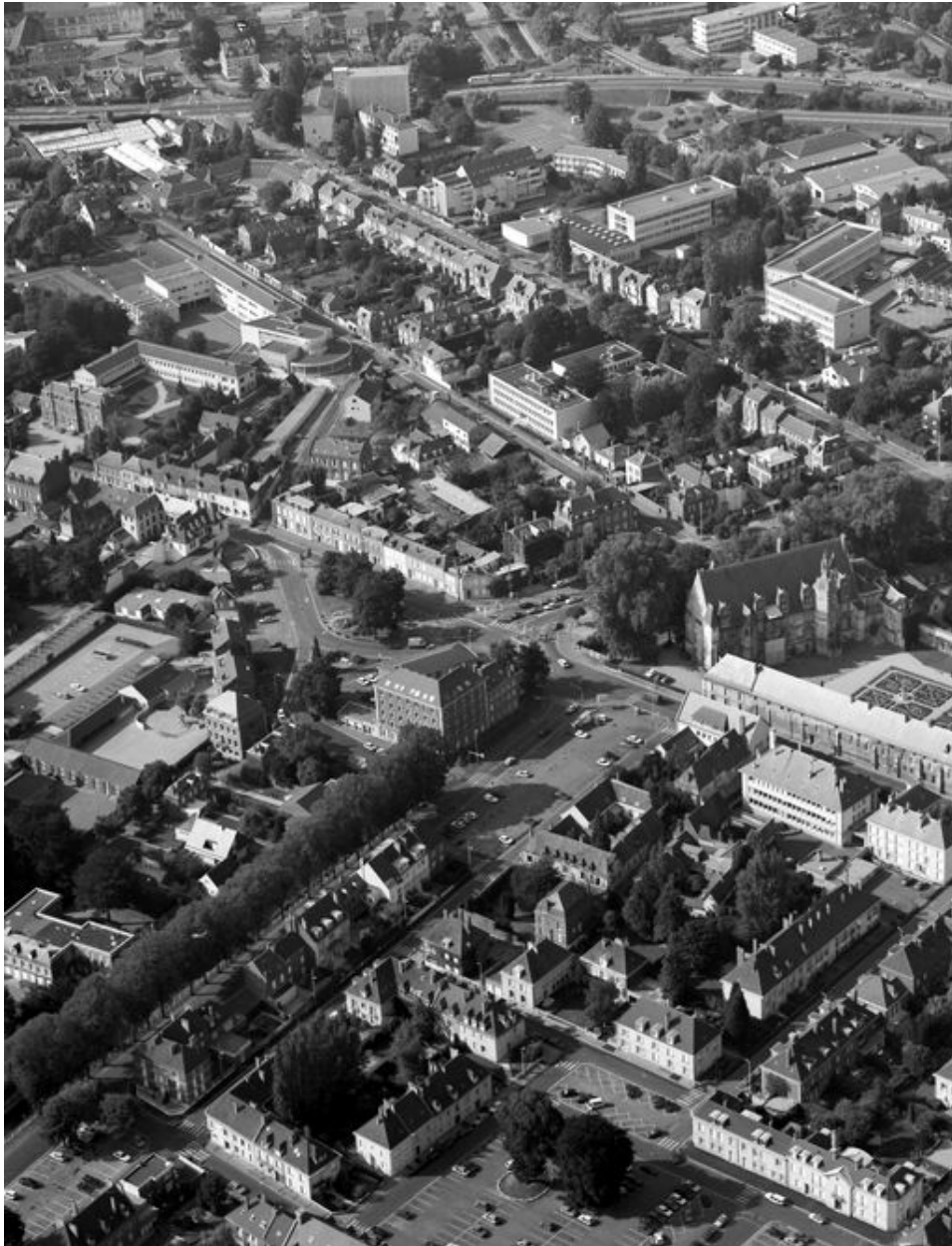
Vue aérienne du moulin en 1994.