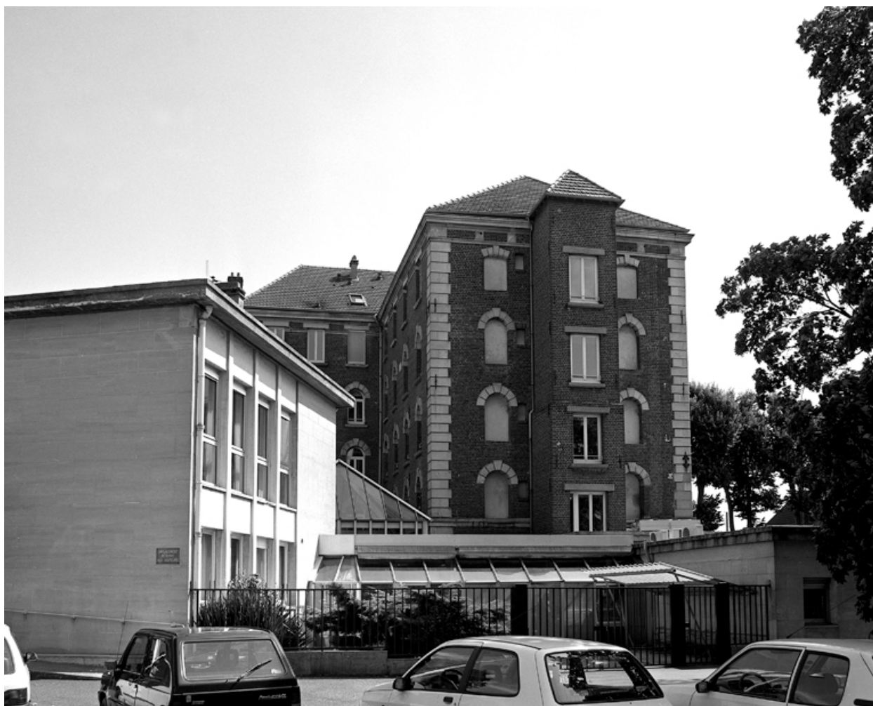
Vue antérieure ouest.