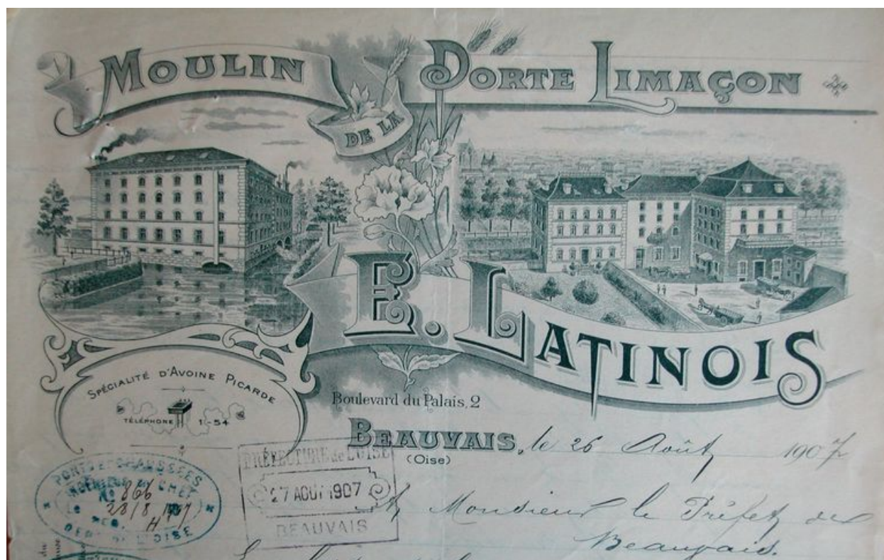
En-tête de lettre figurée de la minoterie du Limaçon, 1907.