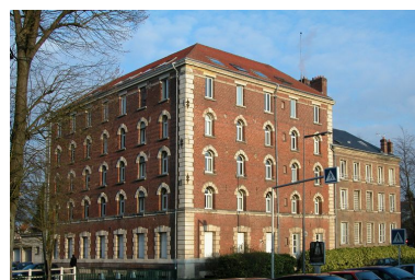
Vue générale. IVR22_20076000326NUCA