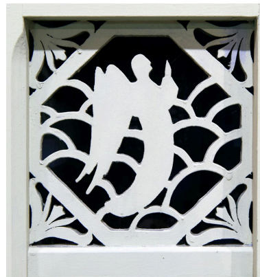
Confessionnal ouest : détail du décor en bois ajouré du battant de la porte centrale.

Phot. Pierre Thibaut IVR32_20215900297NUCA