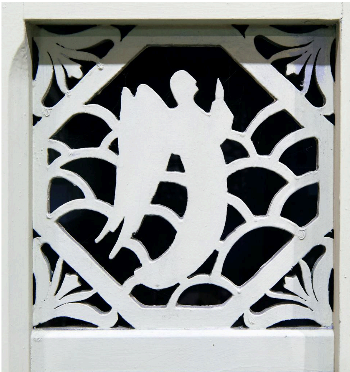
Confessionnal ouest : détail du décor en bois ajouré du battant de la porte centrale.