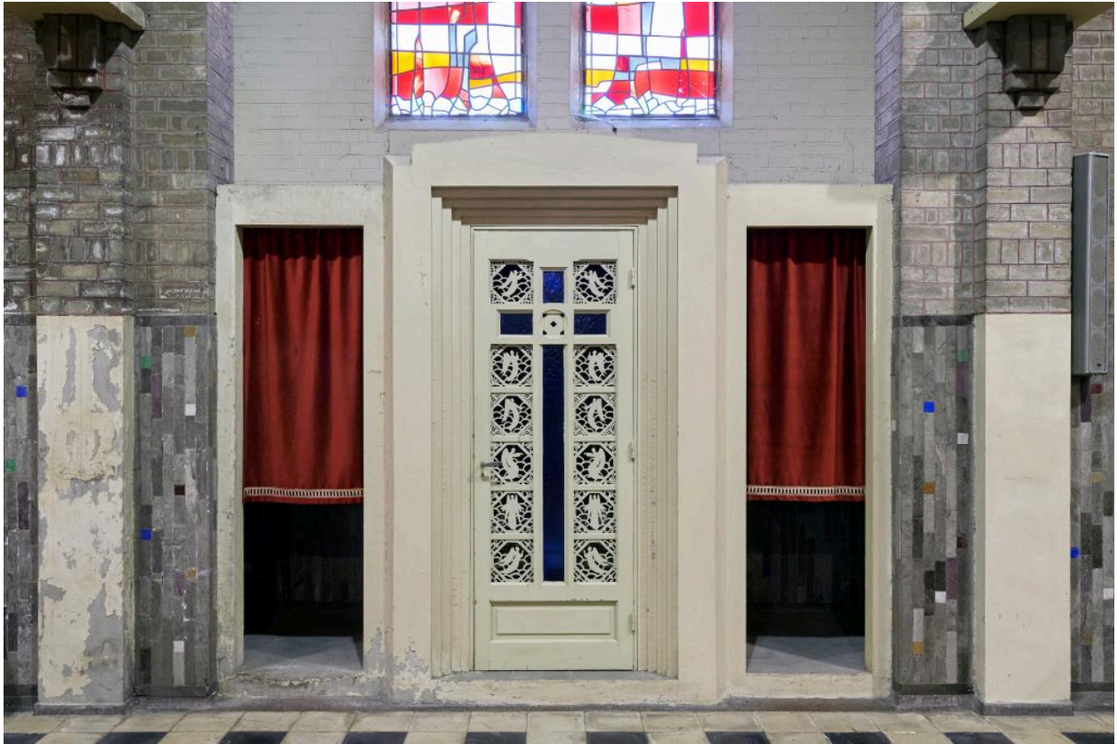
Vue générale du confessionnal ouest.