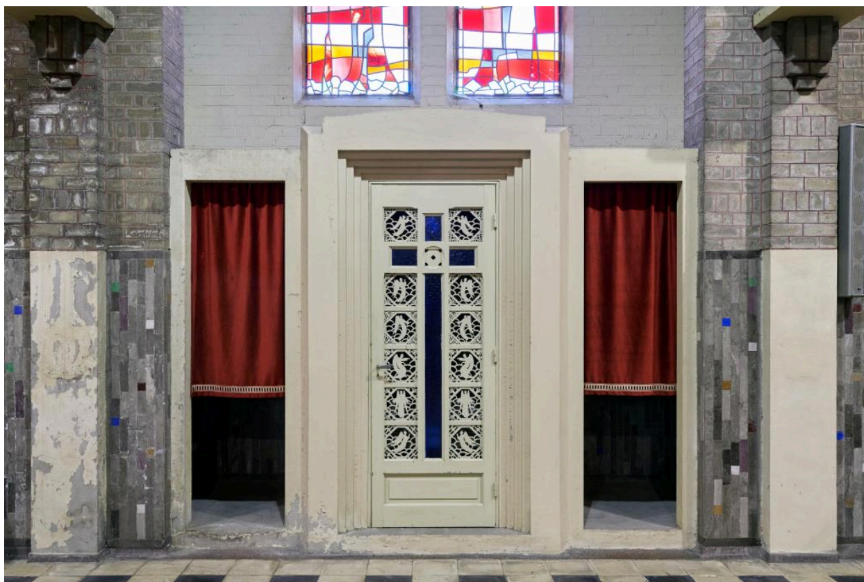
Vue générale du confessionnal ouest.