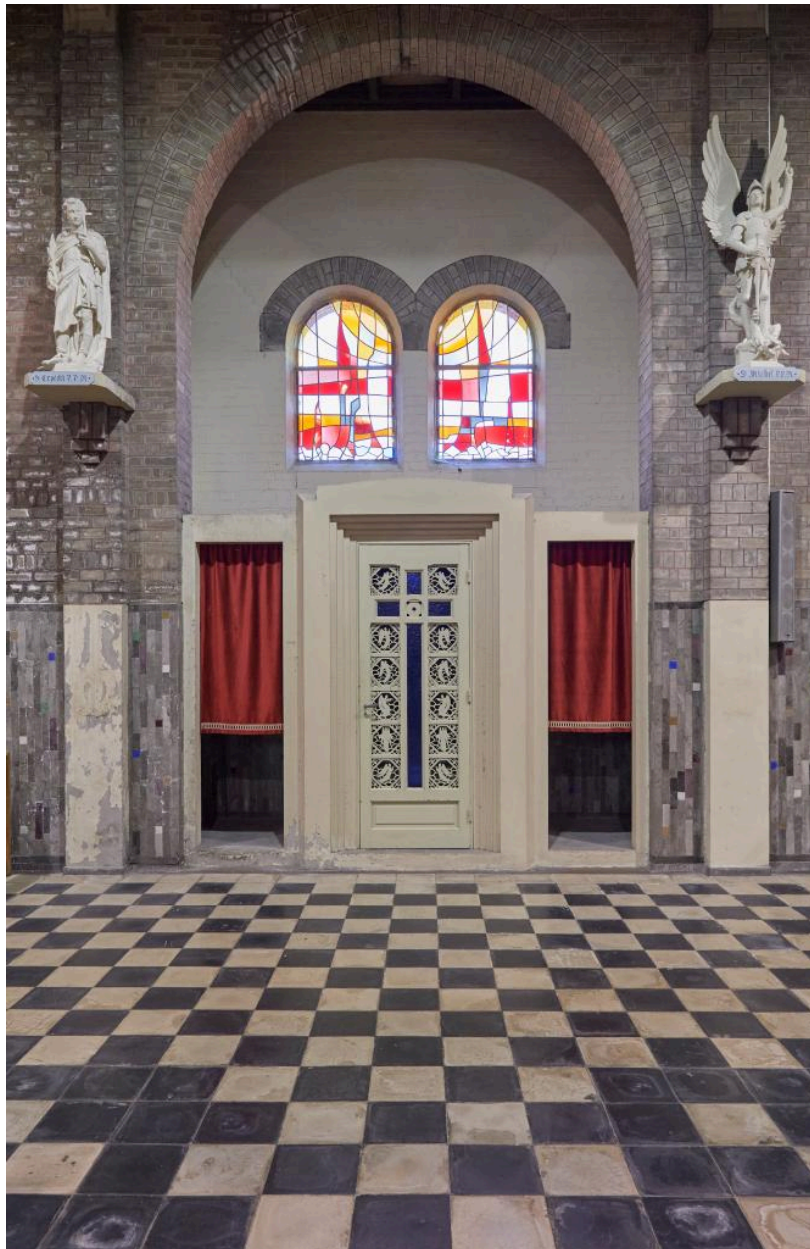
Vue générale du renforcement qui abrite le confessionnal ouest.