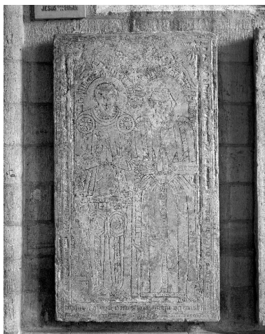
Vue générale de la dalle. IVR22_19950202835V