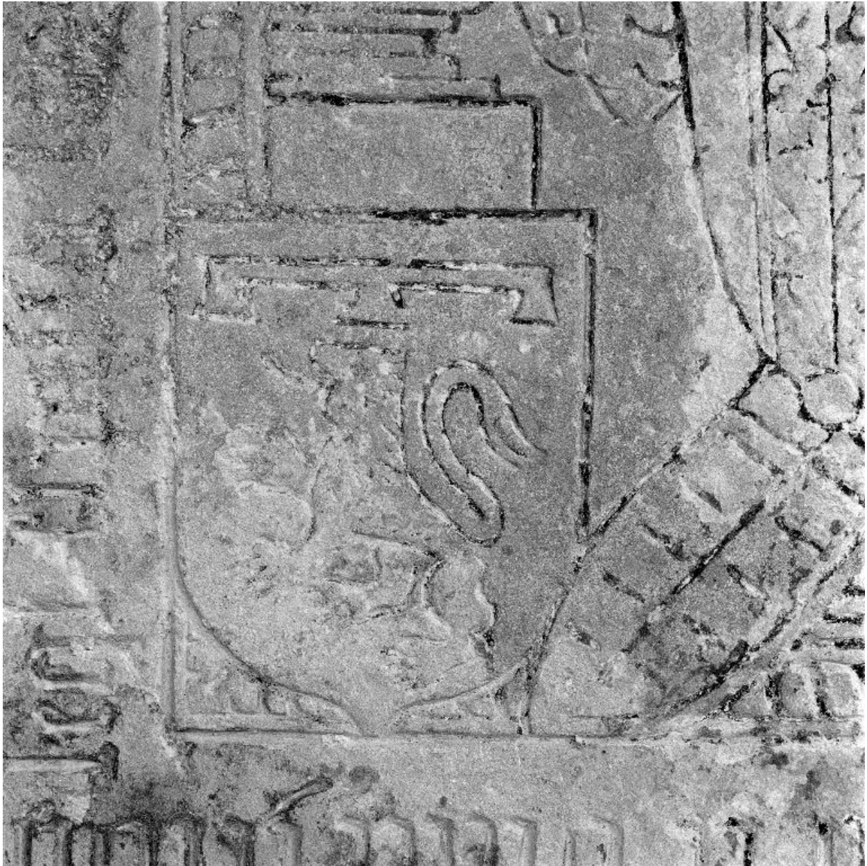
Détail des armoiries de Charles de Brouilly.