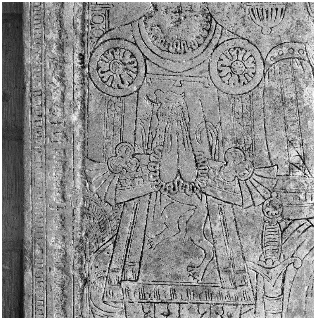
Détail des armoiries représentées sur la cotte d'armes du défunt.