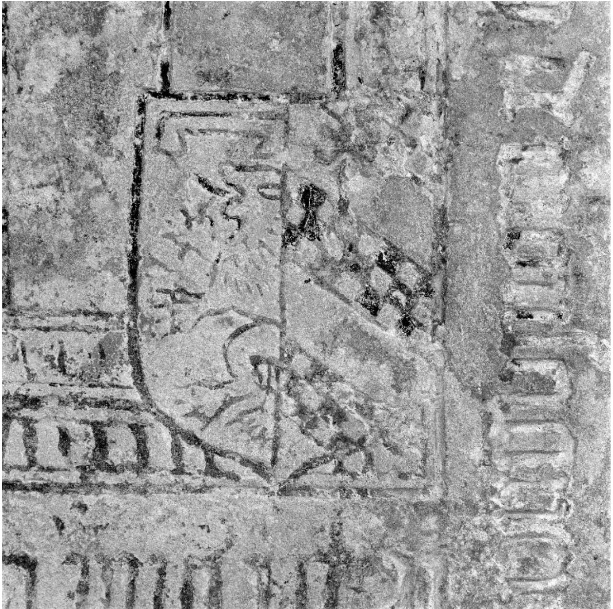
Détail des armoiries de Jeanne de La Fontaine.