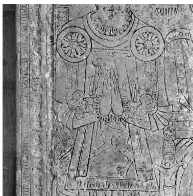
Détail des armoiries représentées sur la cotte d'armes du défunt. IVR22_19950202840X