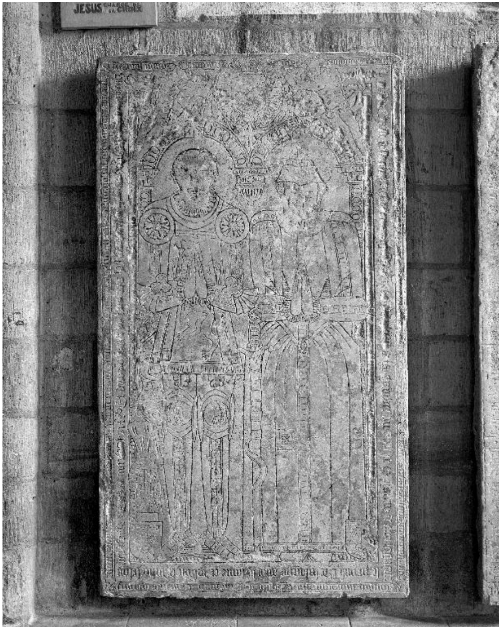
Vue générale de la dalle.