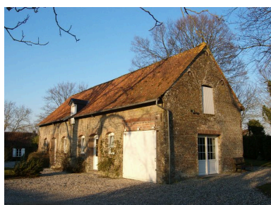
Vue latérale de la grange. IVR22_20058005313NUCA