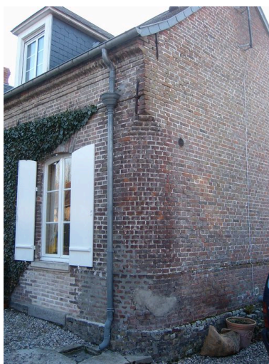
Vue de l'angle nord arrondi de la maison avec encorbellement.