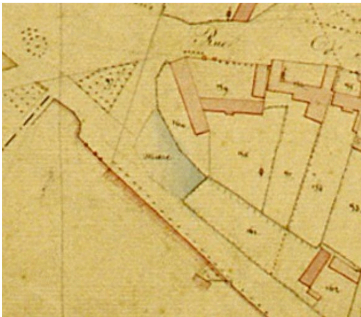
Extrait du cadastre napoléonien présentant le plan de la ferme en 1833.