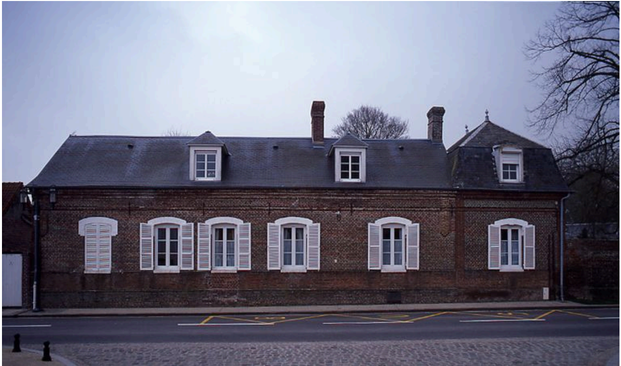
Vue du logis depuis la rue.