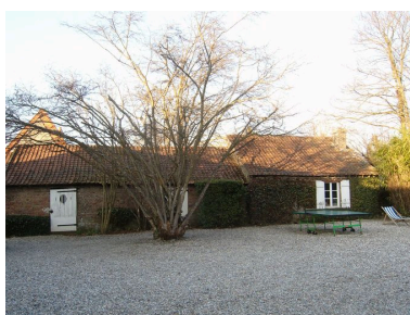
Vue des dépendances situées au nord de la propriété (écuries, étables et fournil). IVR22_20058005316NUCA