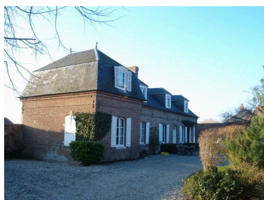
Vue du logis depuis la cour.