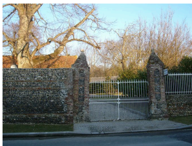
Vue du mur de clôture muni de son portail à deux piliers.

Phot. Monnehay-Vulliet Marie-Laure IVR22_20068005940XAB