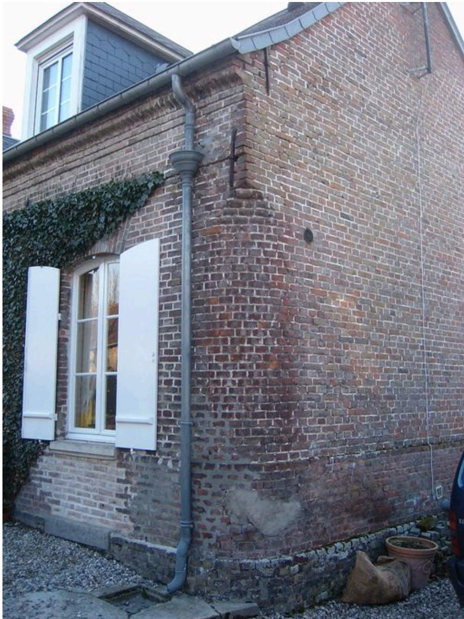
Vue de l'angle nord arrondi de la maison avec encorbellement.