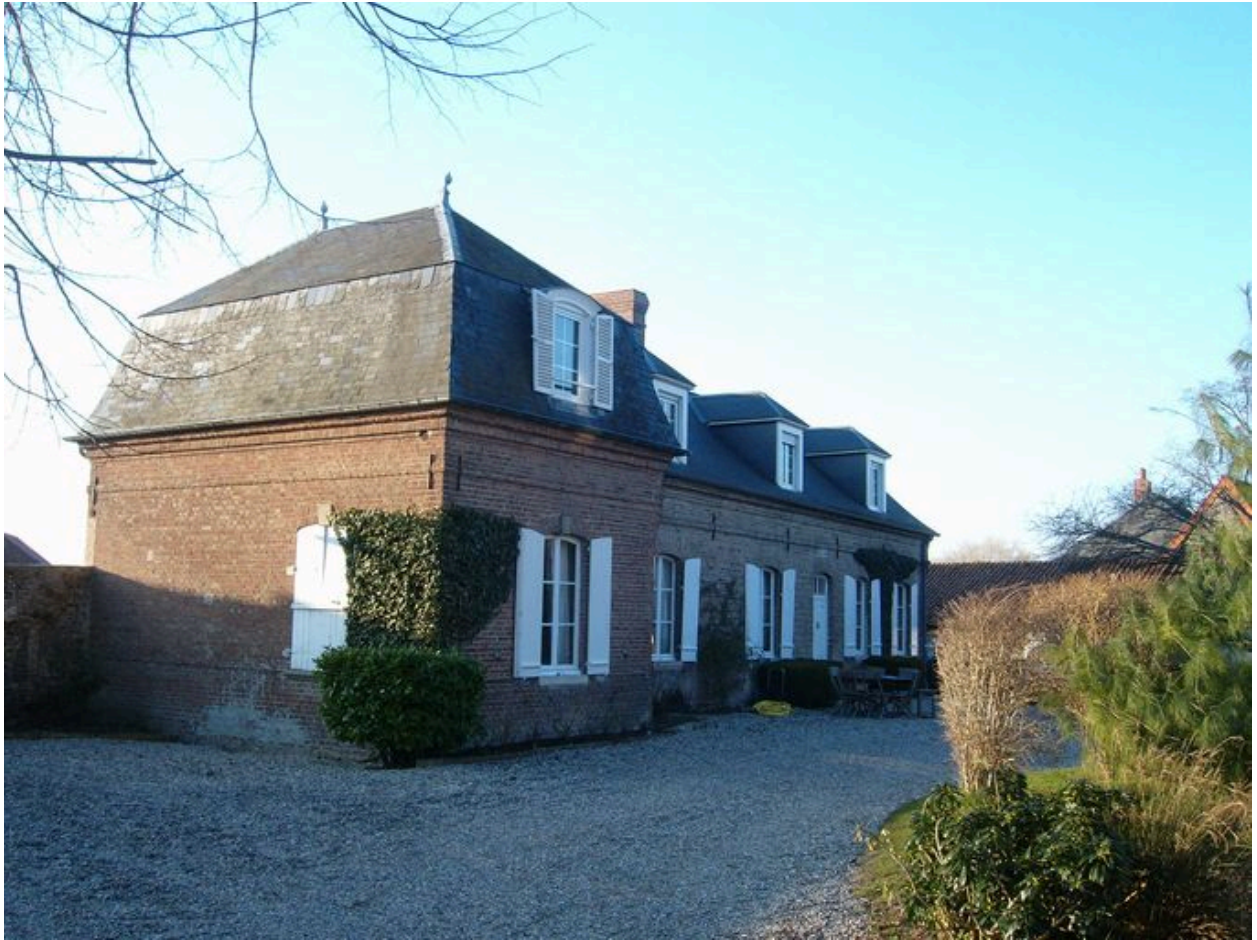
Vue du logis depuis la cour.