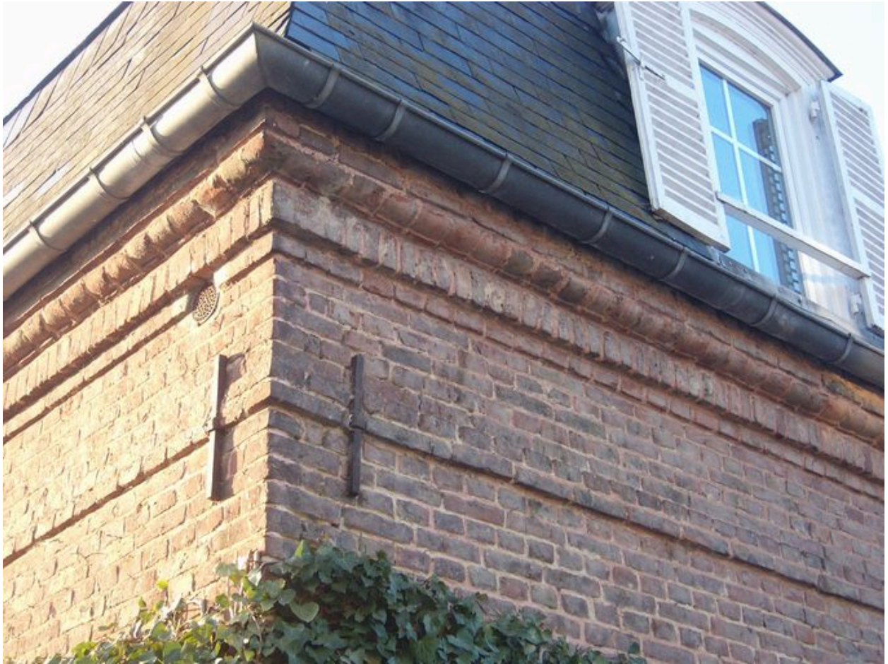
Détail du décor de la corniche.