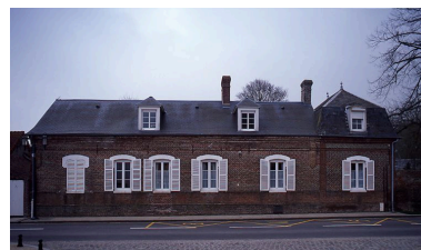
Vue du logis depuis la rue.

Phot. Irwin Leullier IVR22_20078000071XA