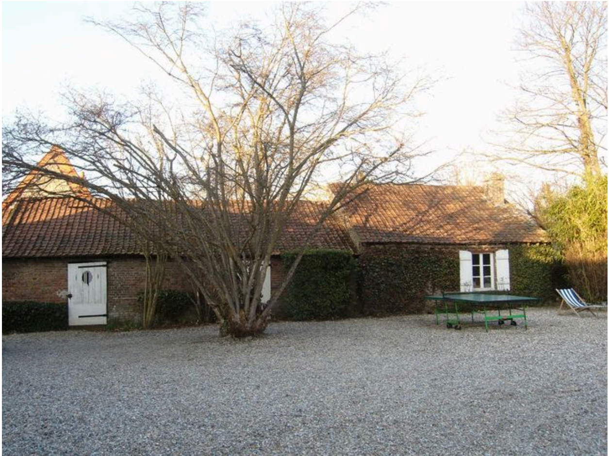
Vue des dépendances situées au nord de la propriété (écuries, étables et fournil).