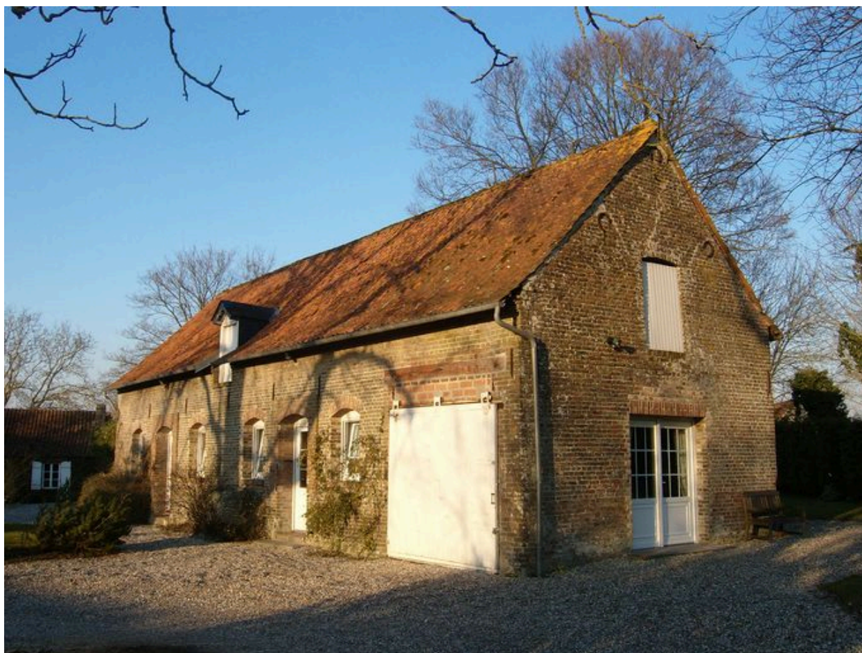
Vue latérale de la grange.