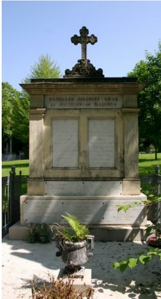
Stèle à entablement et corniche moulurée.