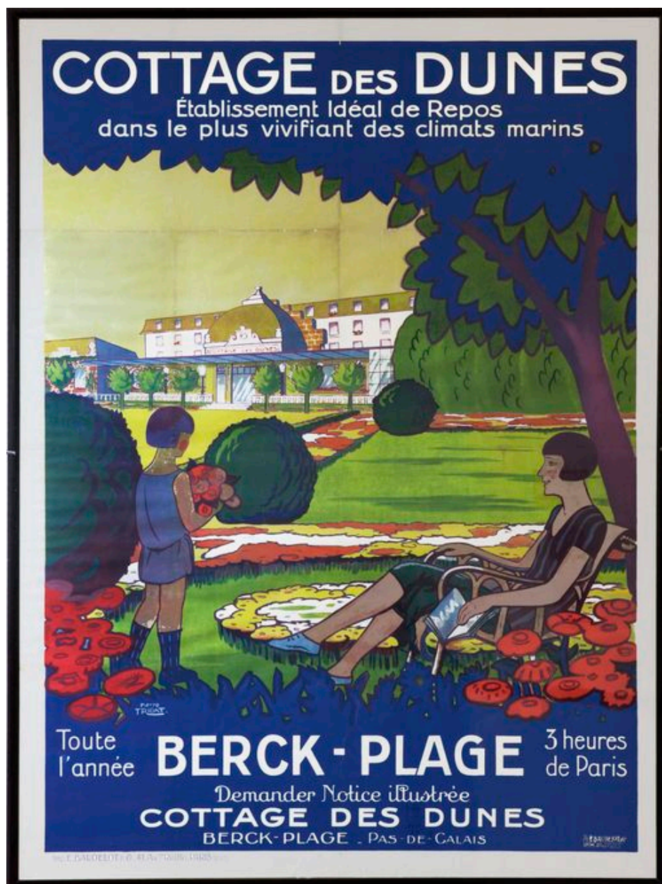
Affiche publicitaire pour le Cottage des Dunes.