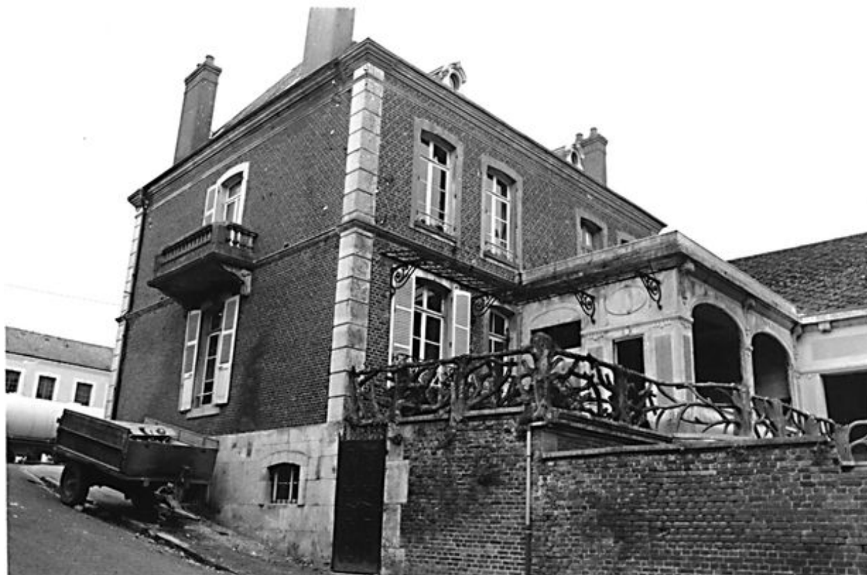
Elévation postérieure depuis le sud-ouest.