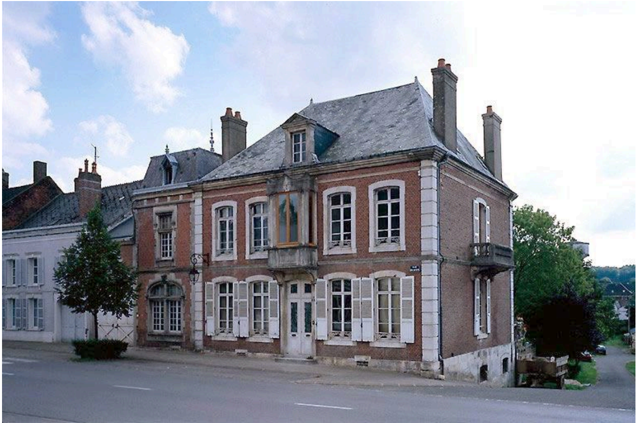
Elévation sur rue depuis le sud-ouest.