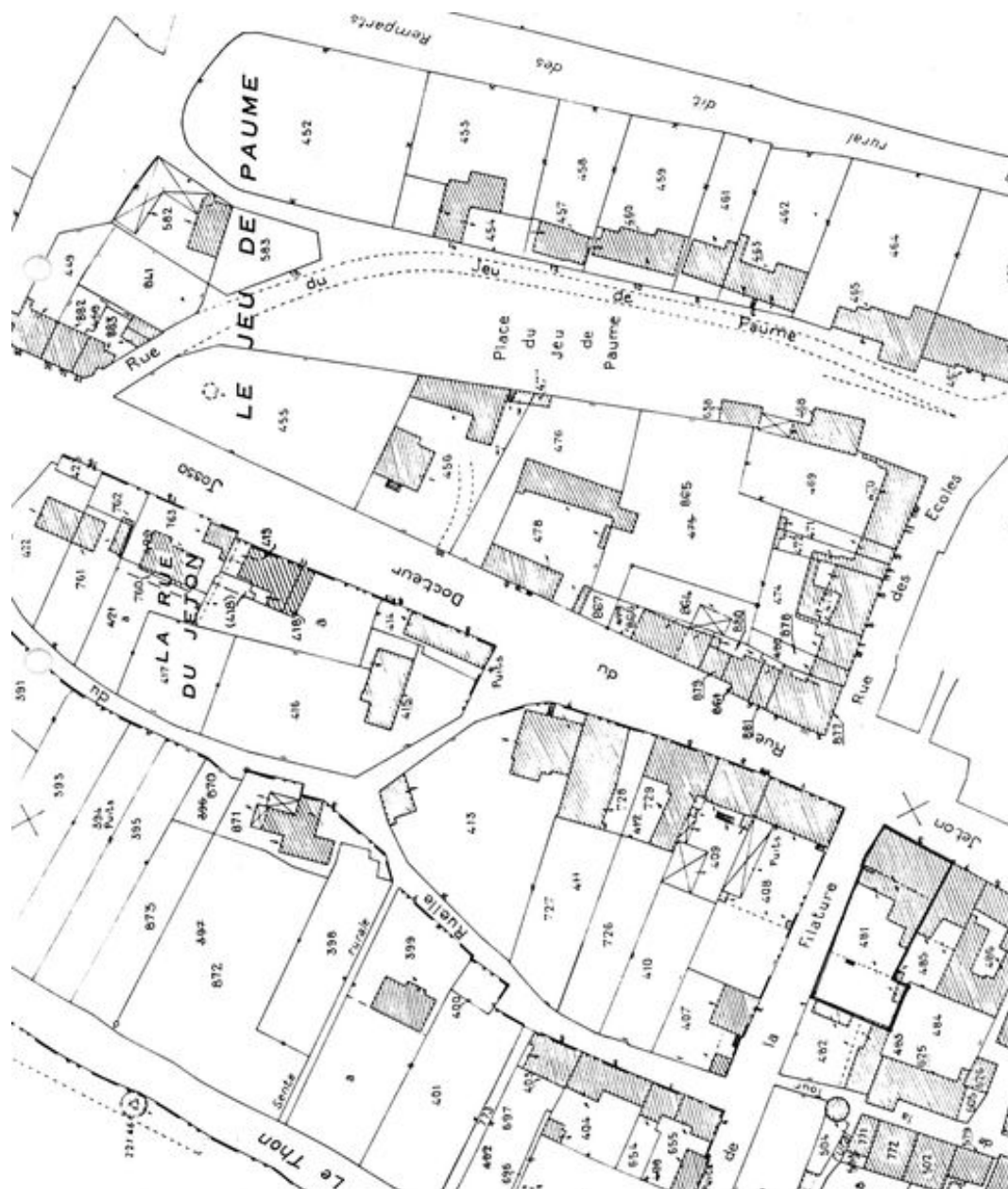
Plan de situation. Extrait du plan cadastral de 1986, section B.