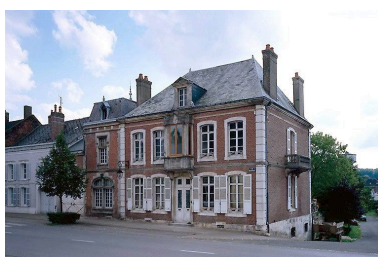
Elévation sur rue depuis le sud-ouest.

Phot. Martine Plouvier IVR22_19980203520ZA