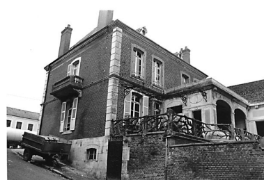
Elévation postérieure depuis le sud-ouest.

IVR22_20000202099XA