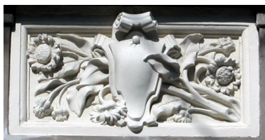
Détail d'un panneau d'allège.