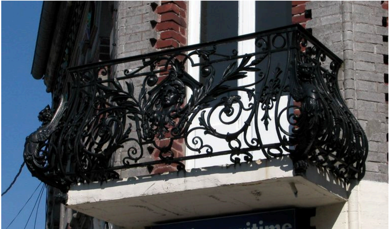
Détail du balcon en fonderie.