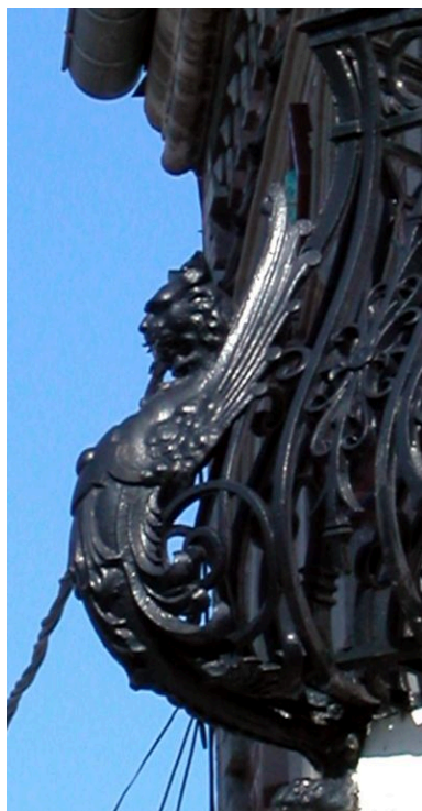
Détail de l'animal fantastique du balcon. IVR22_20058003791NUCA