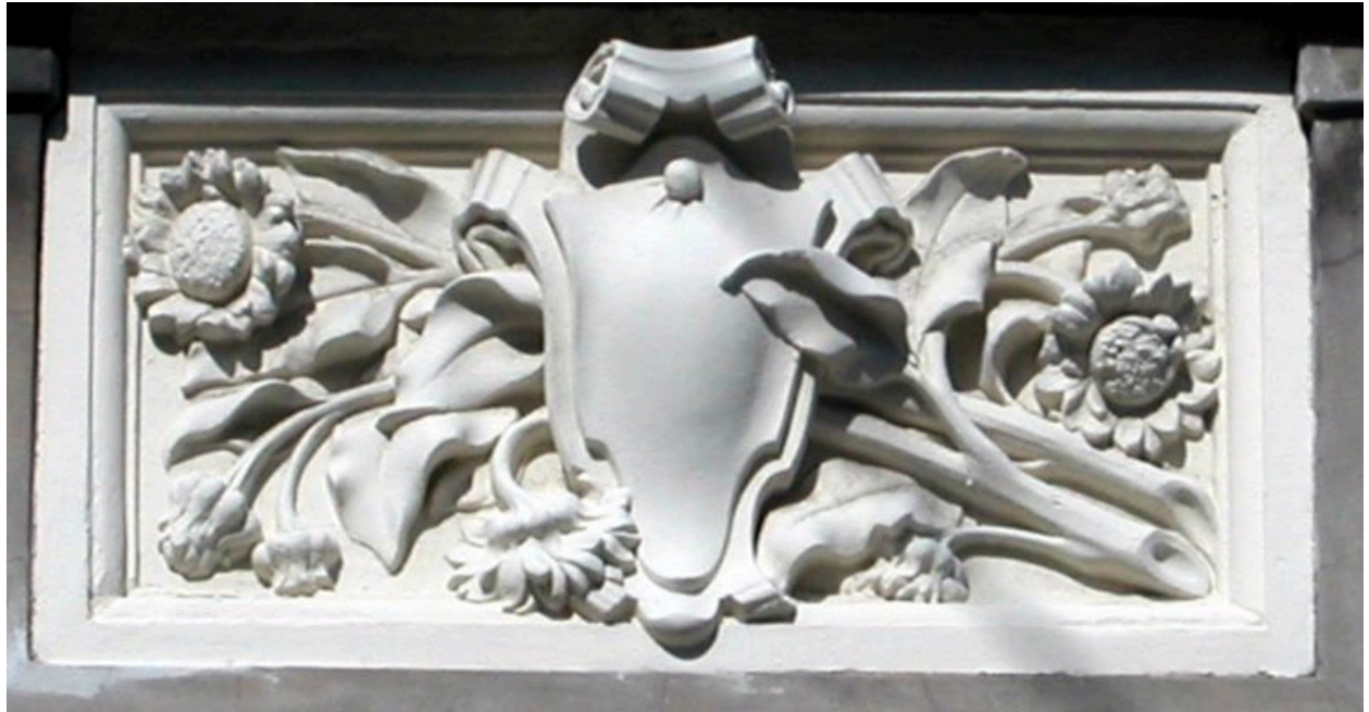
Détail d'un panneau d'allège.