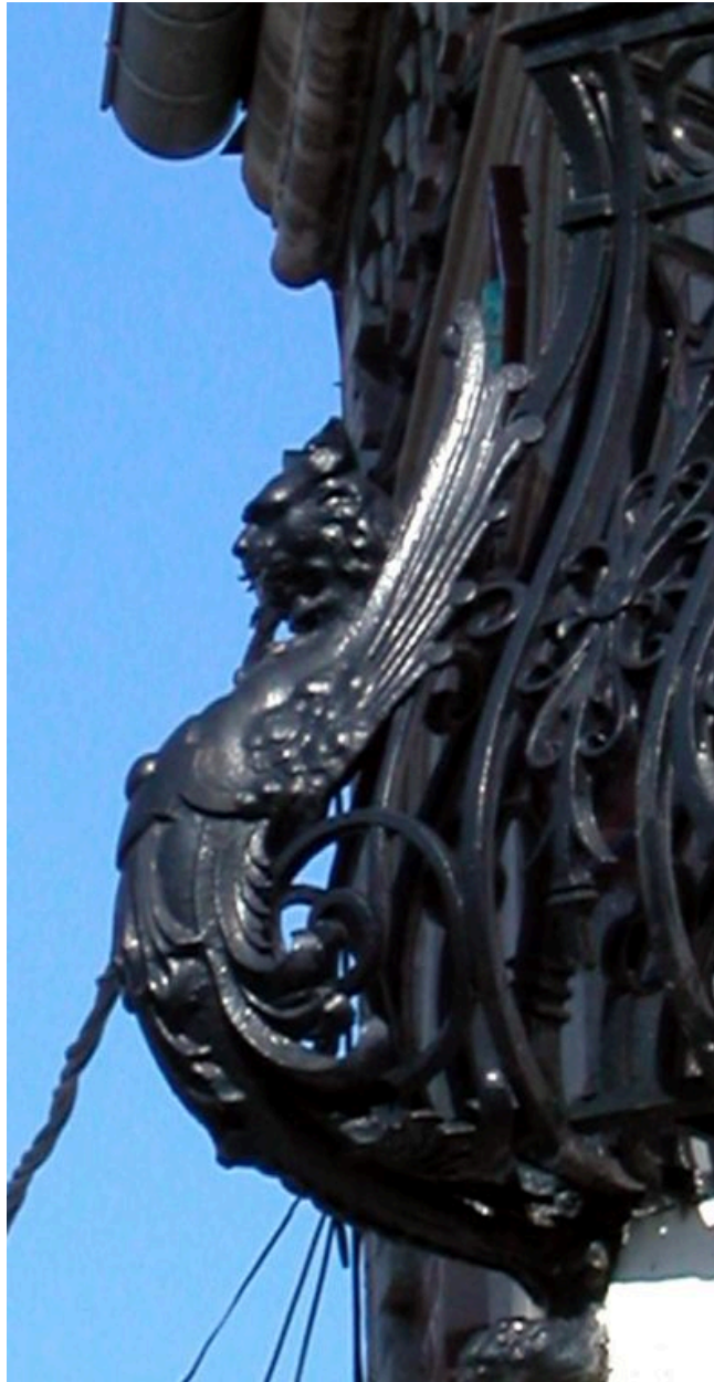
Détail de l'animal fantastique du balcon.