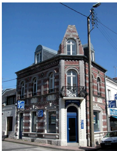
Vue d'ensemble. IVR22_20058003788NUCA