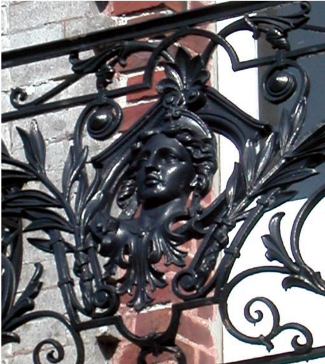
Détail de la tête de femme placée au centre du balcon.