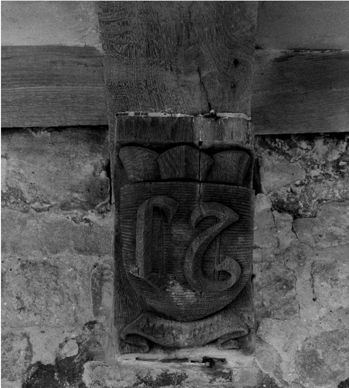
Vue des armoiries sculptées sur la 9e poutre du cloître : initiales LT.