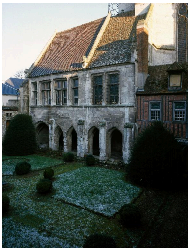
Vue du côté oriental du cloître, avec la salle capitulaire.