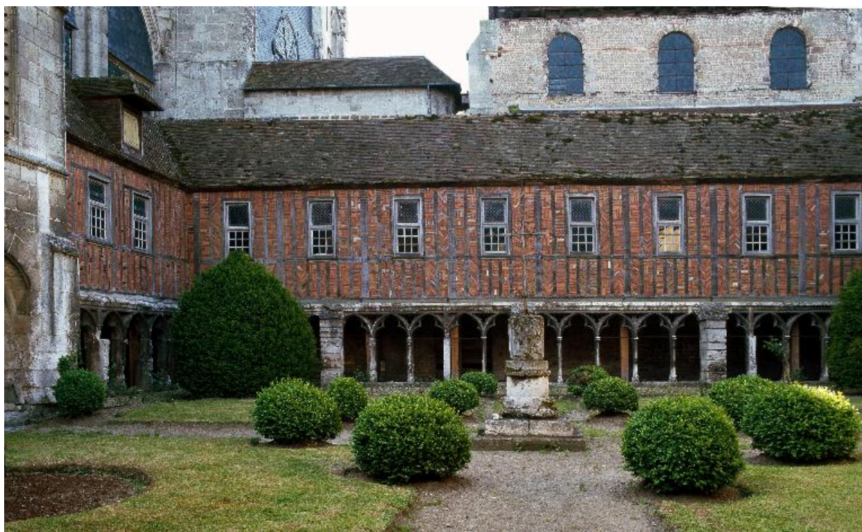
Vue de la galerie méridionale du cloître.