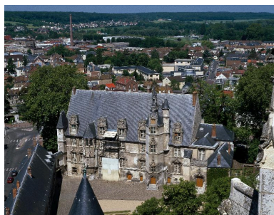
Le palais épiscopal vu depuis la cathédrale.