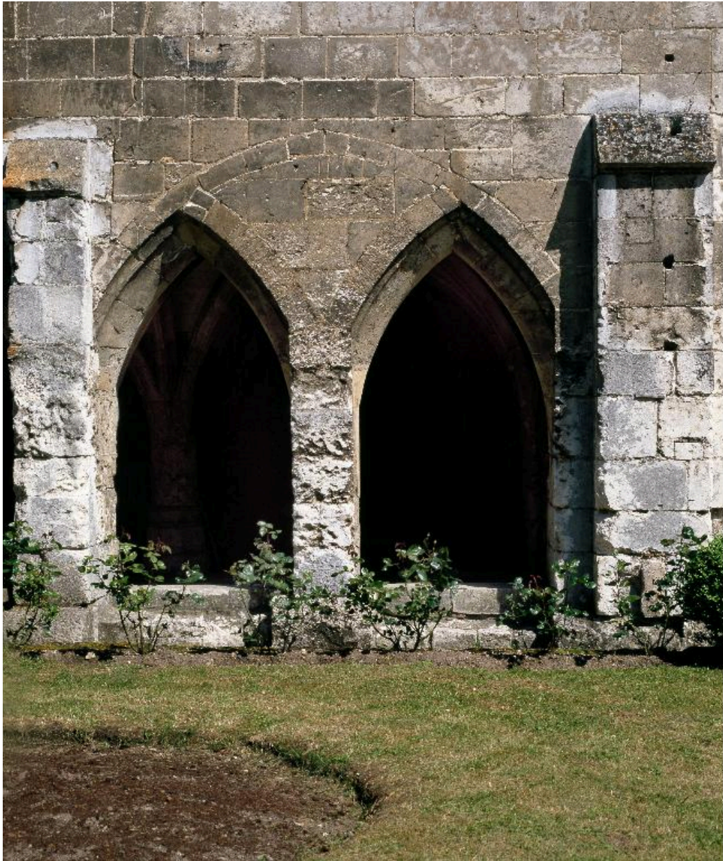
Vue des arcades sous la salle capitulaire.