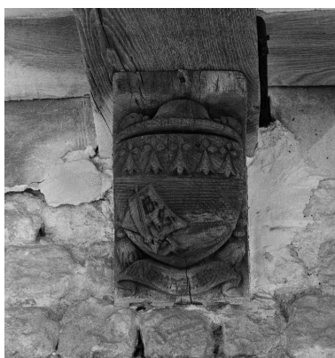
Vue des armoiries sculptées sur la 5e poutre du cloître.