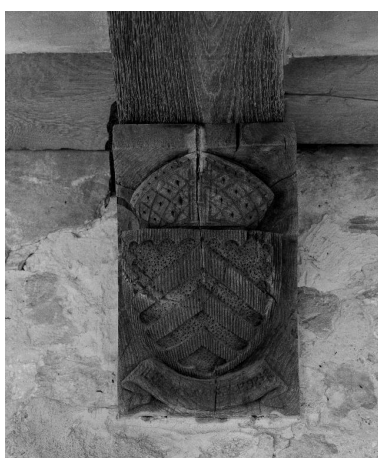
Vue des armoiries sculptées sur la 8e poutre du cloître : armes de Pierre de Savoisy.