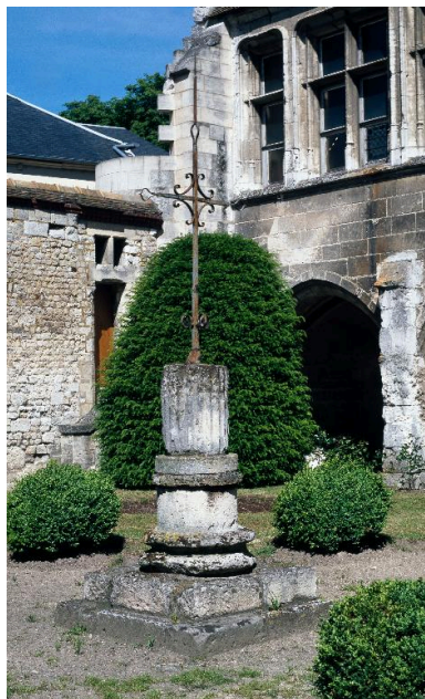
Vue du puits du cloître depuis le sud ouest. IVR22_19976000448XA