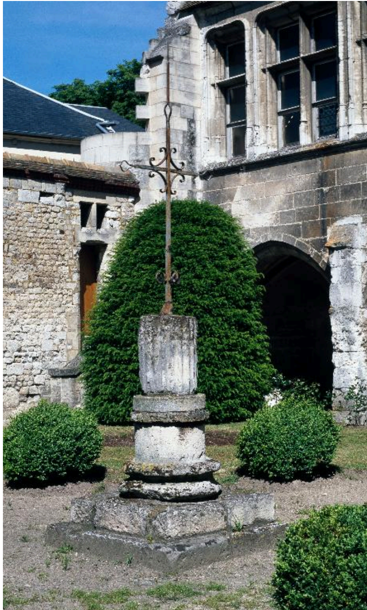
Vue du puits du cloître depuis le sud ouest.