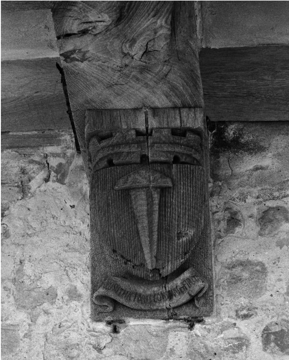
Vue des armoiries sculptées sur la 7e poutre du cloître.