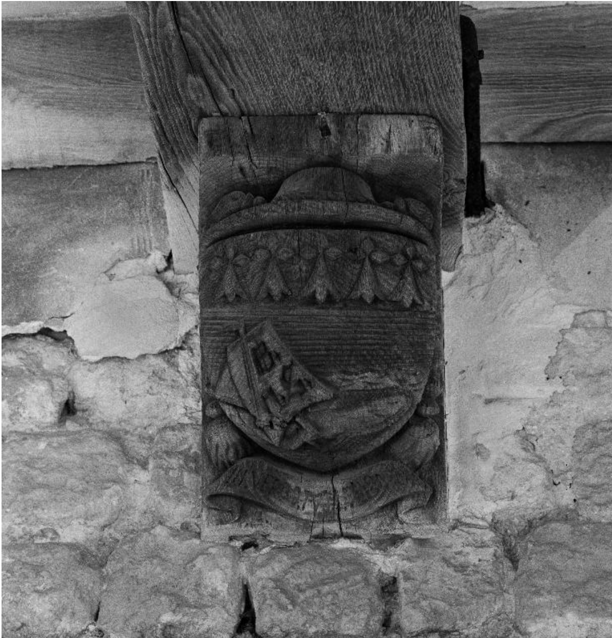
Vue des armoiries sculptées sur la 5e poutre du cloître.