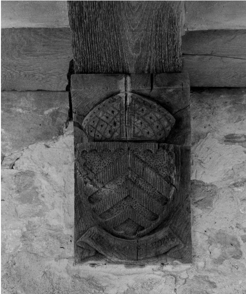
Vue des armoiries sculptées sur la 8e poutre du cloître : armes de Pierre de Savoisy.