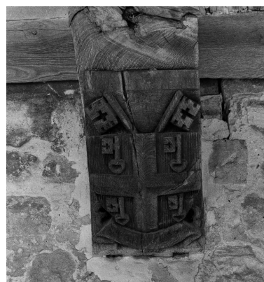
Vue des armoiries sculptées sur la 6e poutre du cloître : armes du chapitre. IVR22_19966003744X