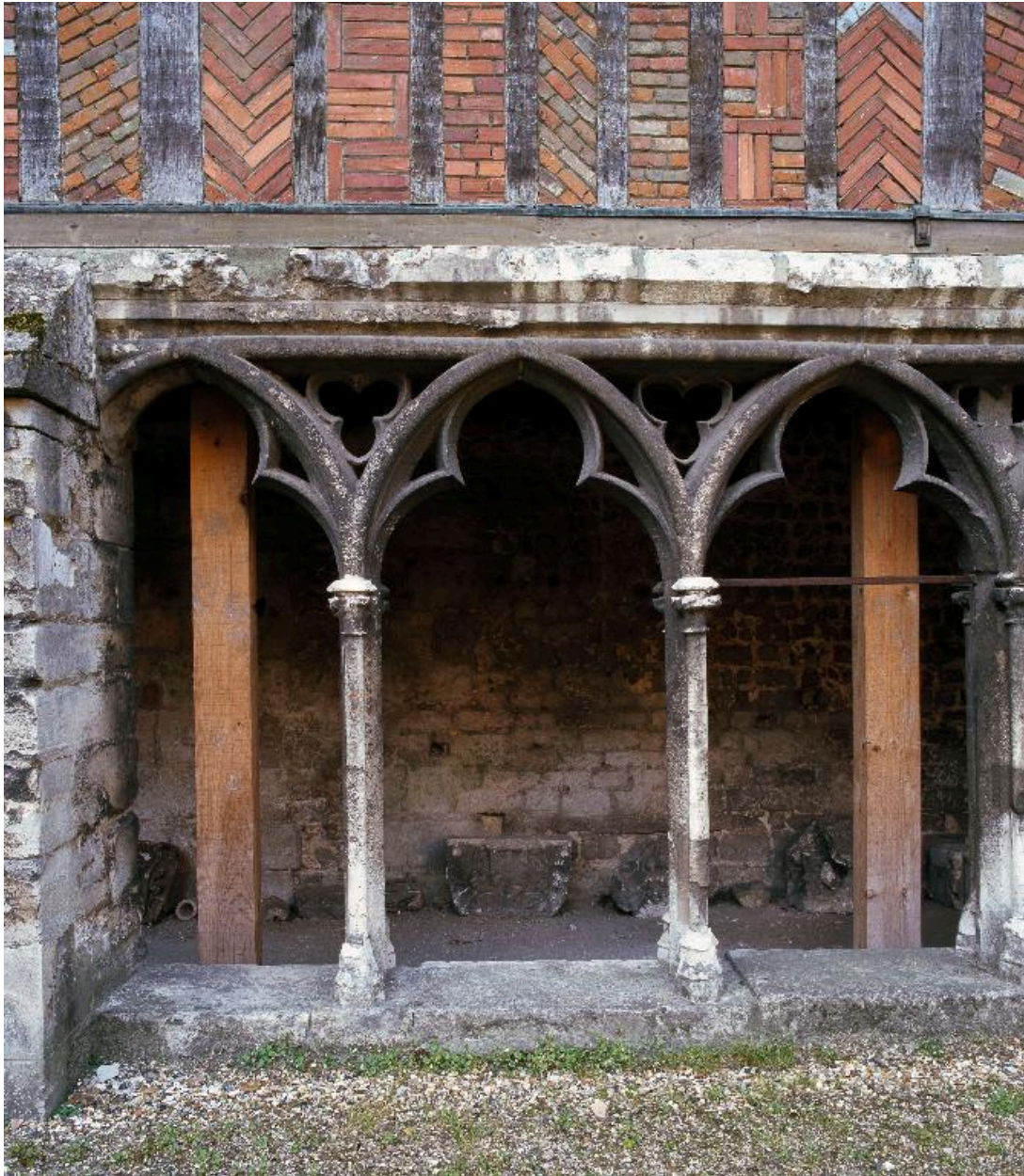
Détail de la galerie sud du cloître.