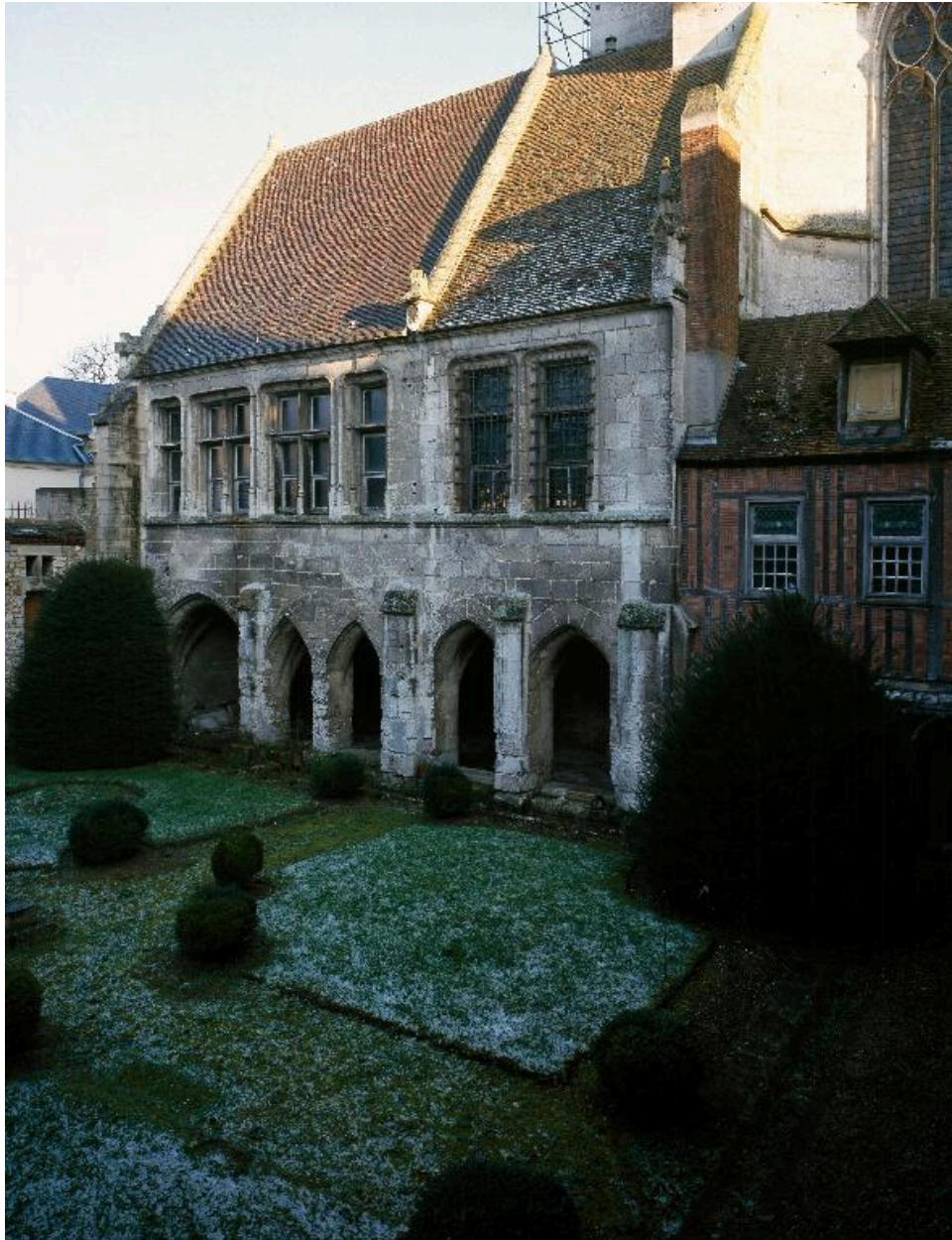
Vue du côté oriental du cloître, avec la salle capitulaire.