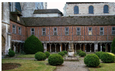
Vue de la galerie méridionale du cloître. IVR22_19976000447XA