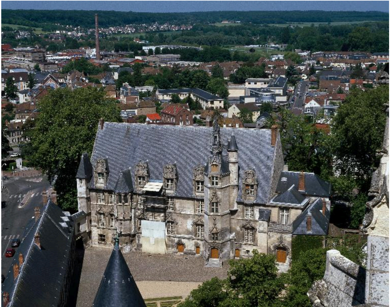
Le palais épiscopal vu depuis la cathédrale.