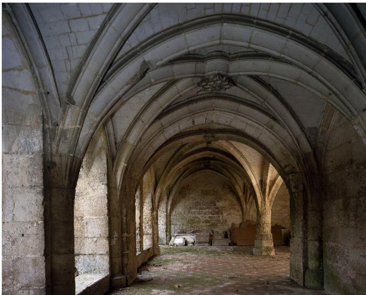
Vue de la galerie ouest du cloître : voûtes sous la salle capitulaire.