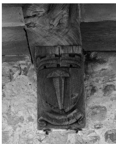
Vue des armoiries sculptées sur la 7e poutre du cloître.