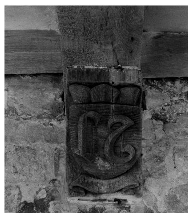
Vue des armoiries sculptées sur la 9e poutre du cloître : initiales LT. IVR22_19966003741X