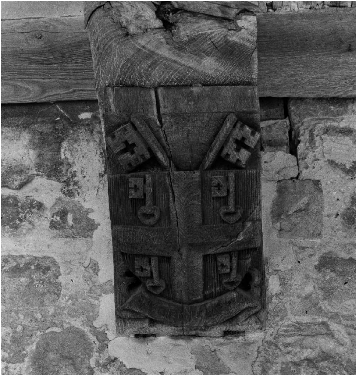
Vue des armoiries sculptées sur la 6e poutre du cloître : armes du chapitre.