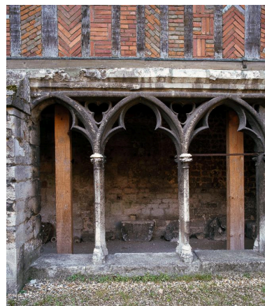
Détail de la galerie sud du cloître.