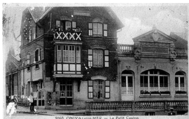
Le Petit Casino, carte postale, 1er quart 20e siècle (coll. part.).

Phot. Leullier Irwin IVR22_20008000448XB