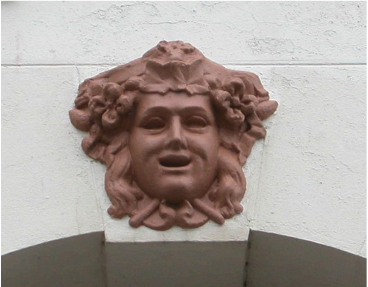
Détail d'un décor sculpté, clé d'arc de la baie de gauche.