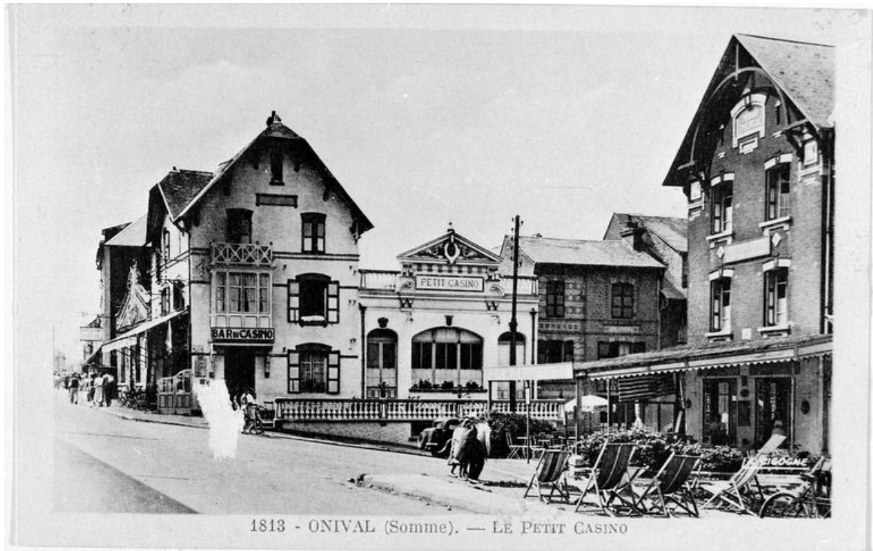
Le Petit Casino, carte postale, 1ere moitié 20e siècle.