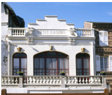
Élévation antérieure sur rue.

Phot. Marie-Laure Monnehay-Vulliet IVR22_20048000309XA