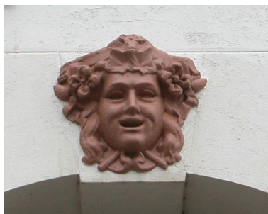
Détail d'un décor sculpté, clé d'arc de la baie de gauche.