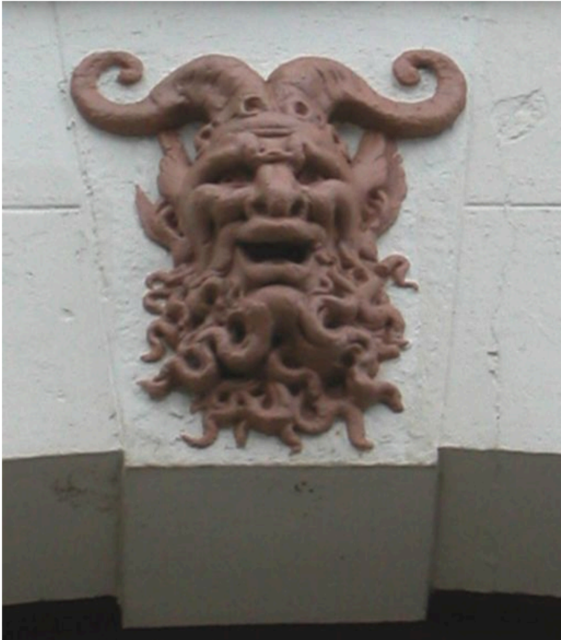
Détail d'un décor sculpté, clé d'arc de la baie centrale.