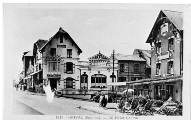
Le Petit Casino, carte postale, 1ere moitié 20e siècle (coll. part.).

IVR22_20008000448XB