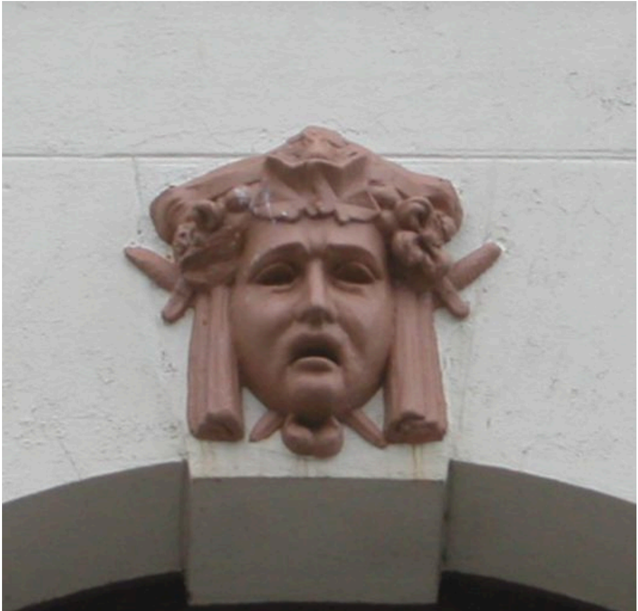
Détail d'un décor sculpté, clé d'arc de la baie de droite.