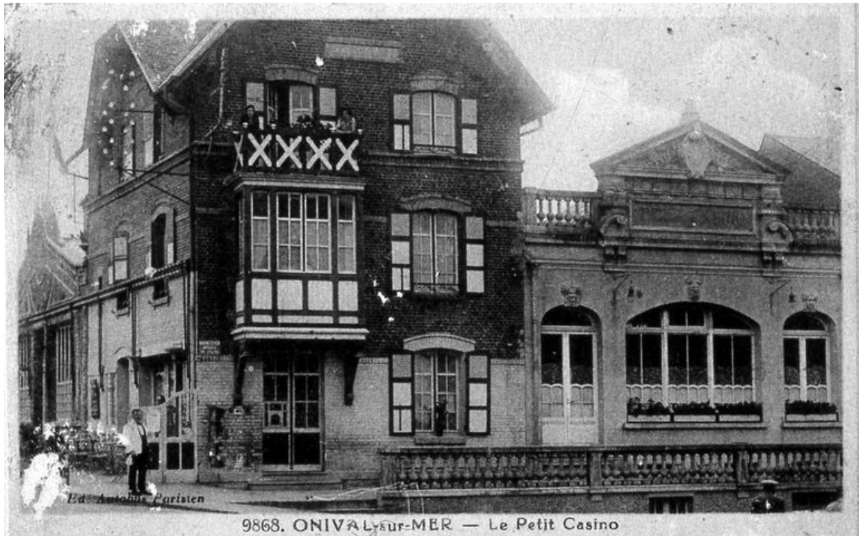
Le Petit Casino, carte postale, 1er quart 20e siècle.