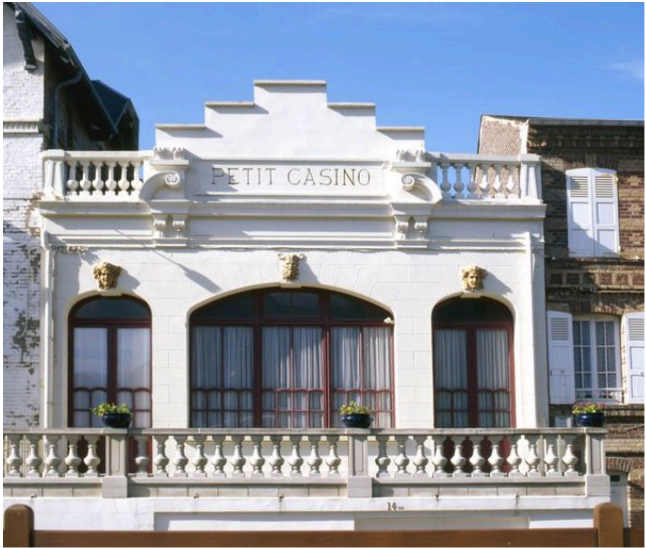
Elévation antérieure sur rue.