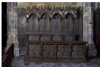
Vue de la rangée nord des stalles, appartenant au décor.