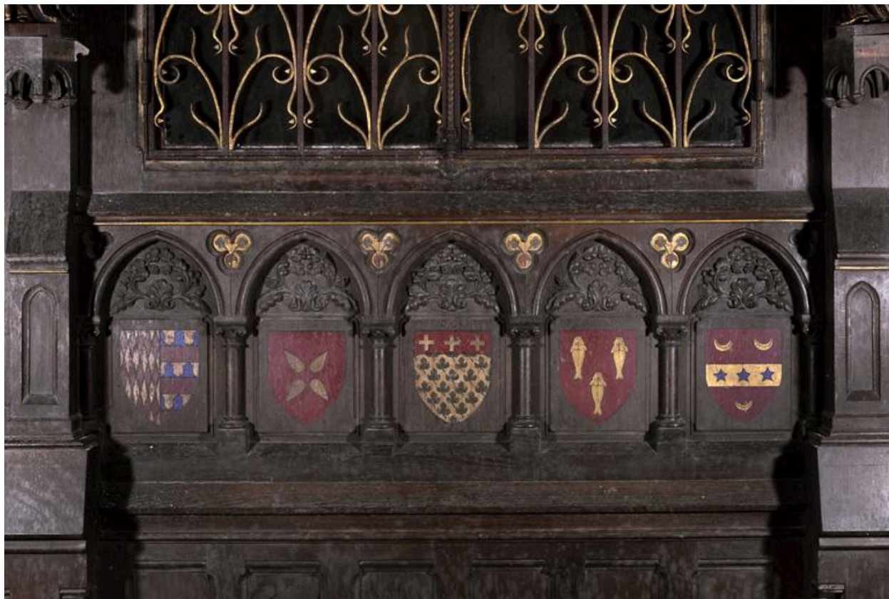
Détail de la partie centrale de l'élévation sud des lambris, abritant les reliquaires et saintes huiles.