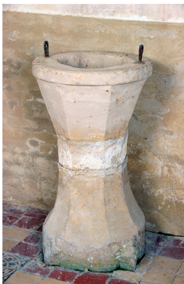
Vue générale, sans le couvercle. IVR22_19988001421ZA