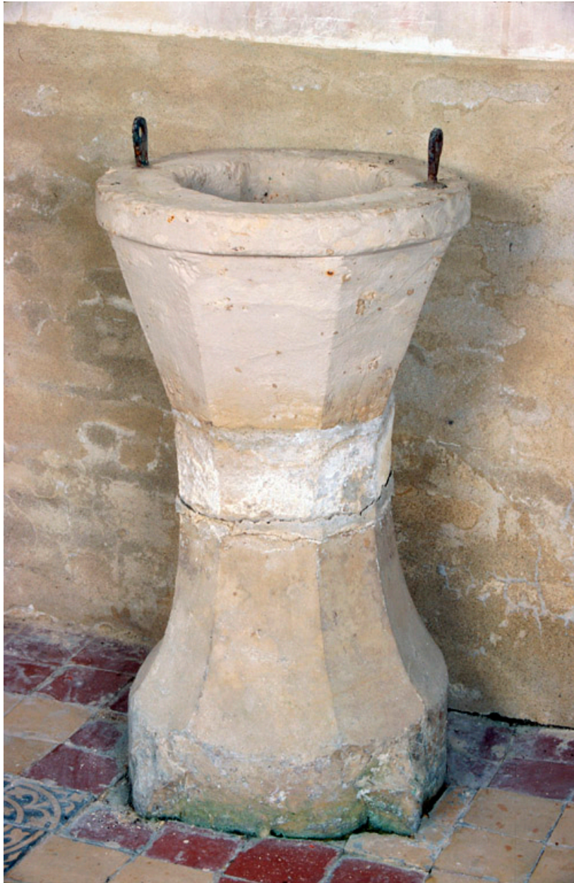
Vue générale, sans le couvercle.