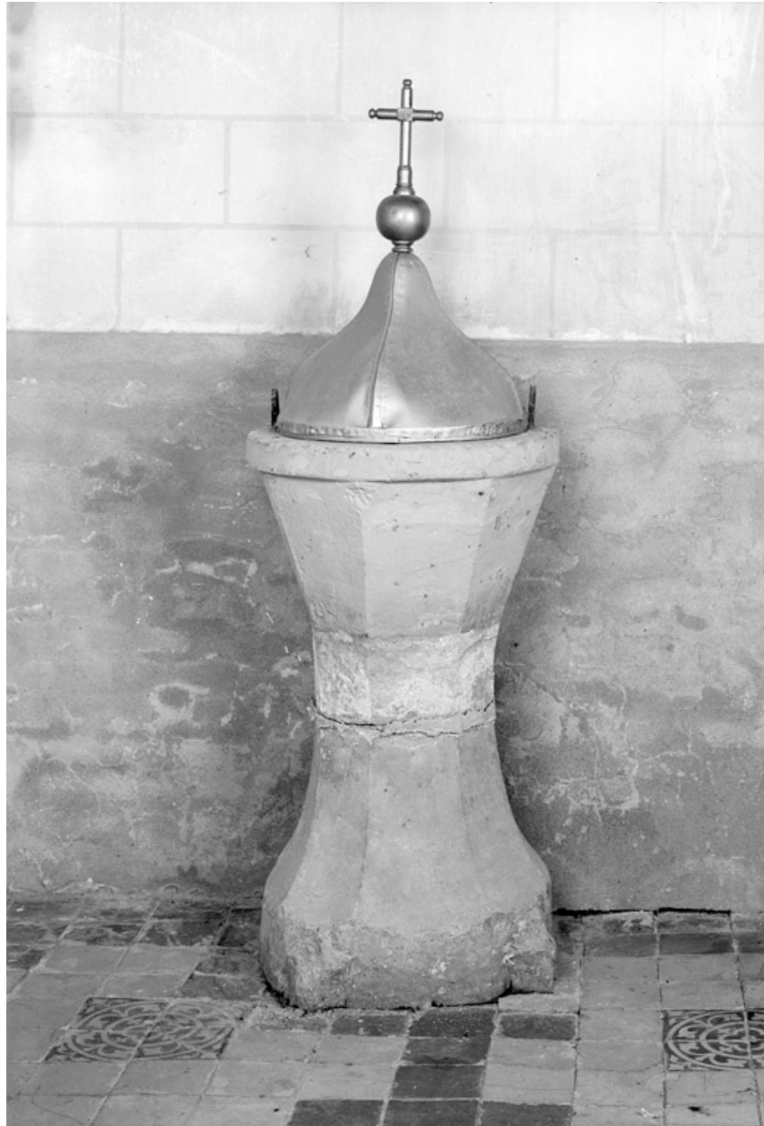
Vue générale avec le couvercle en bois et métal peint.