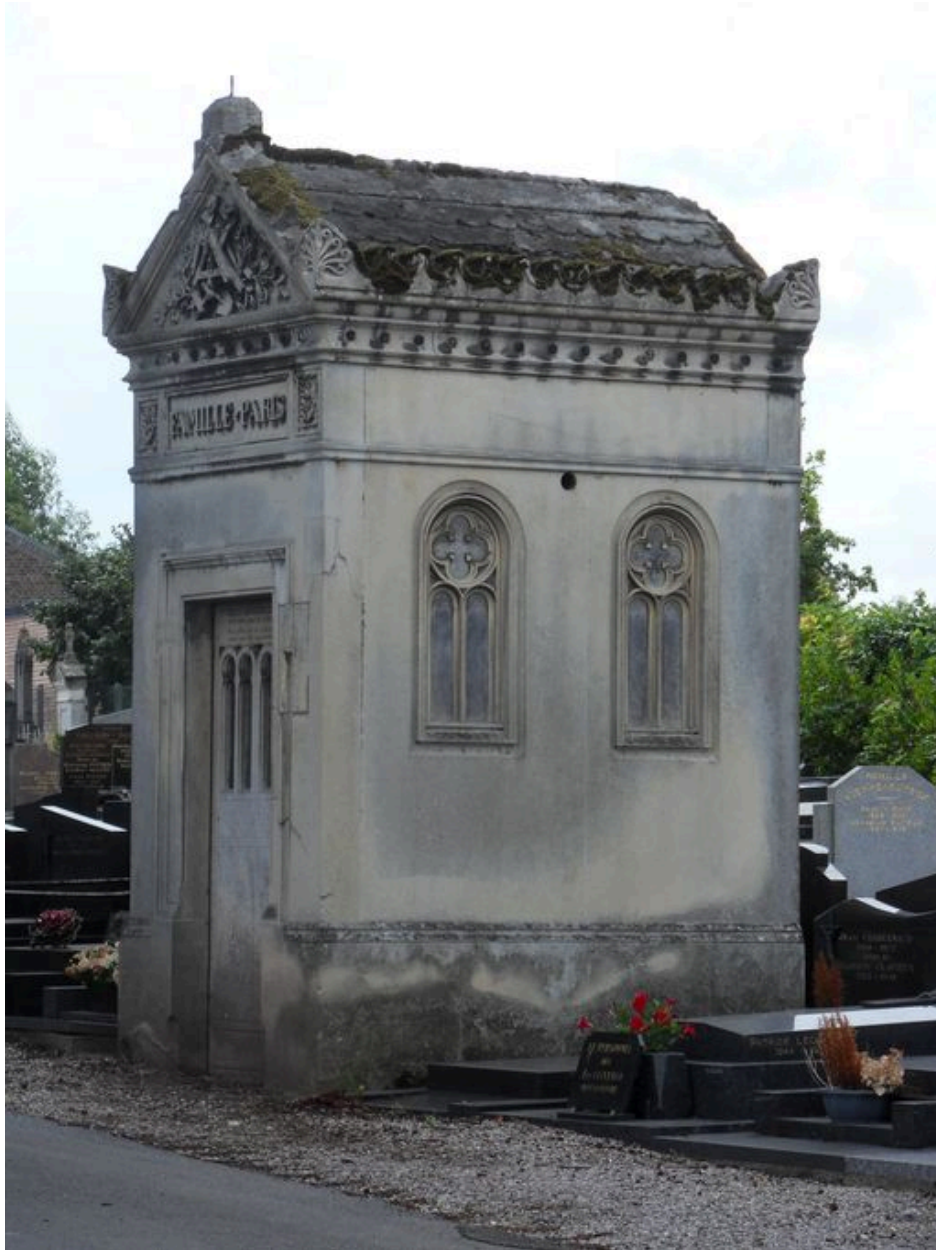
Vue générale de trois-quarts.