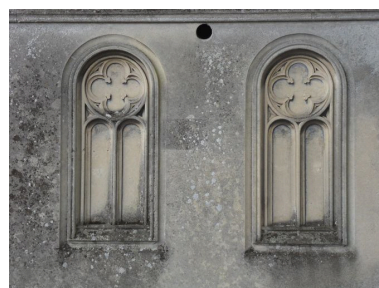
Vue de détail des baies aveugles du mur sud. IVR22_20118010025NUCA