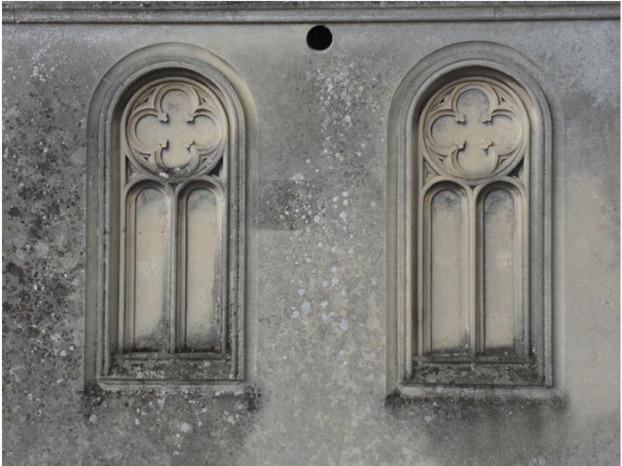
Vue de détail des baies aveugles du mur sud.