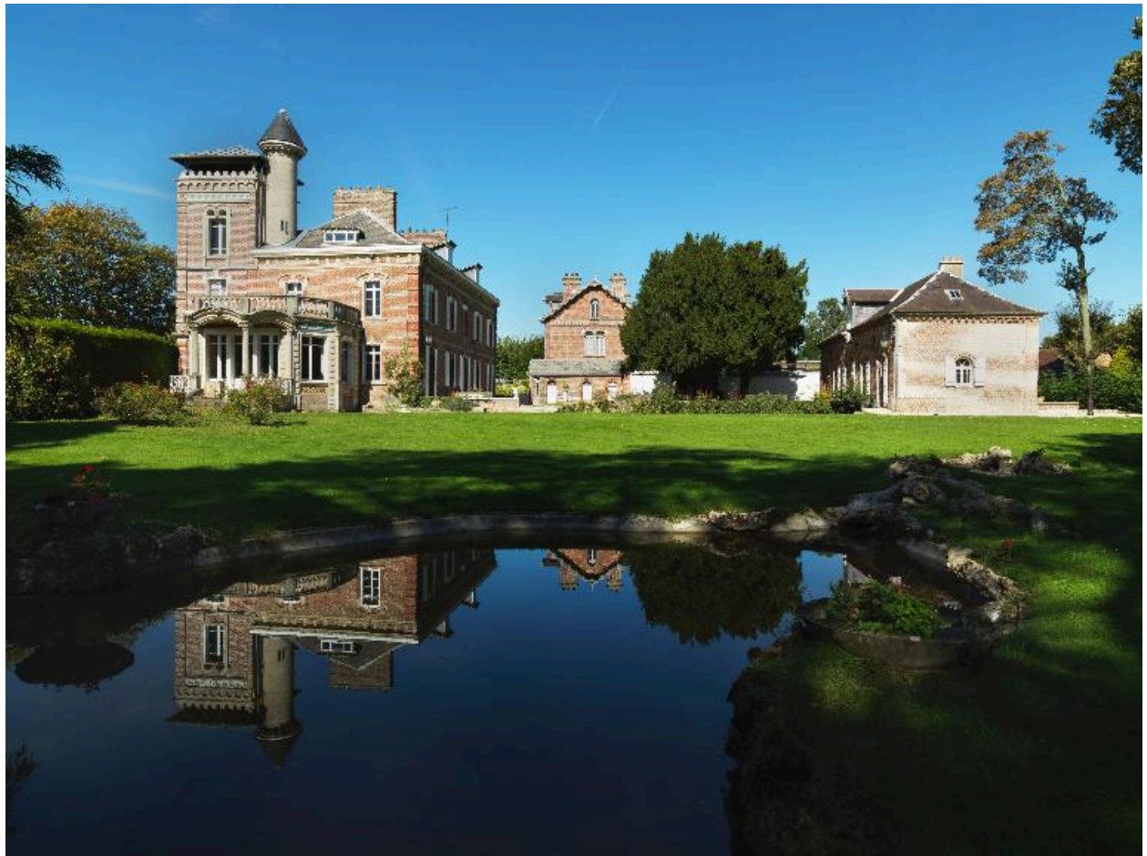
Sains-en-Amiénois (Somme). La Roseraie.