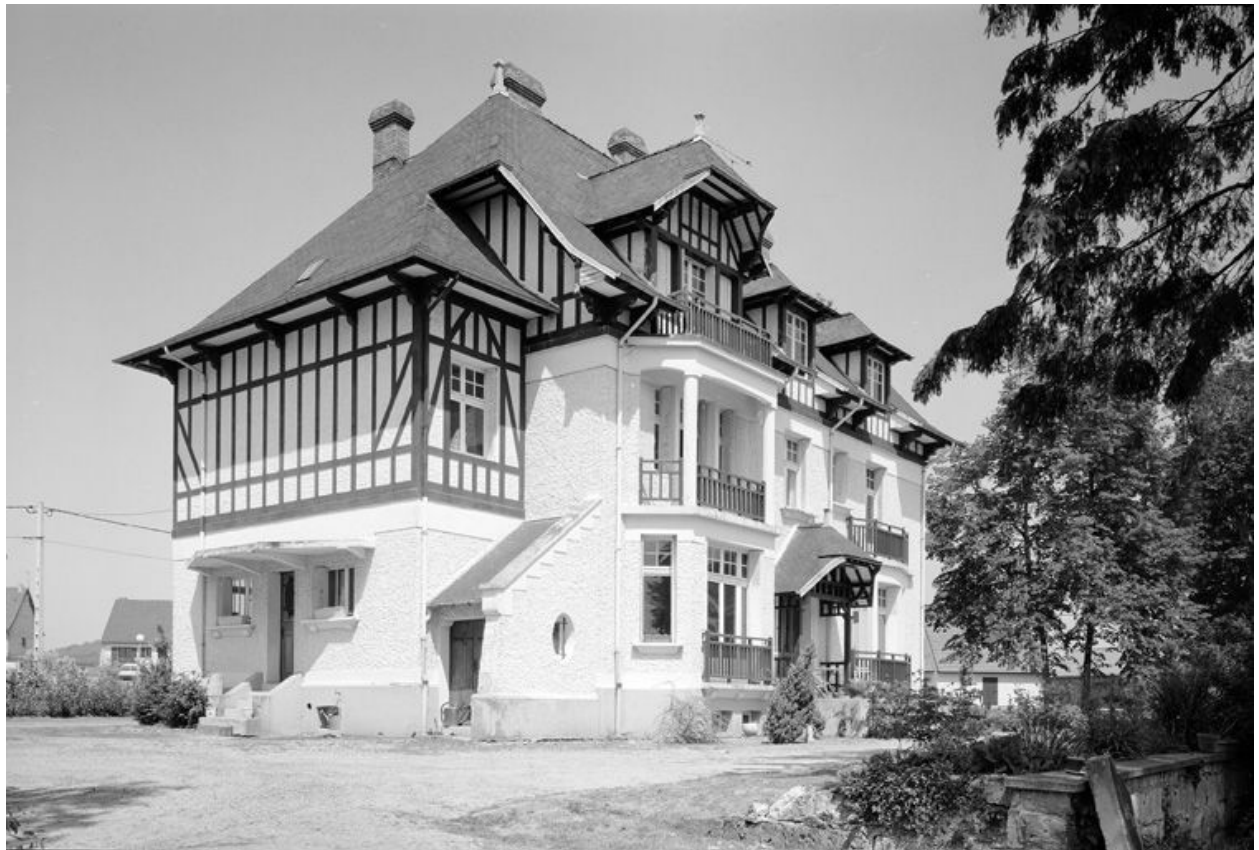
Nouveau château de Morlincourt (Oise).