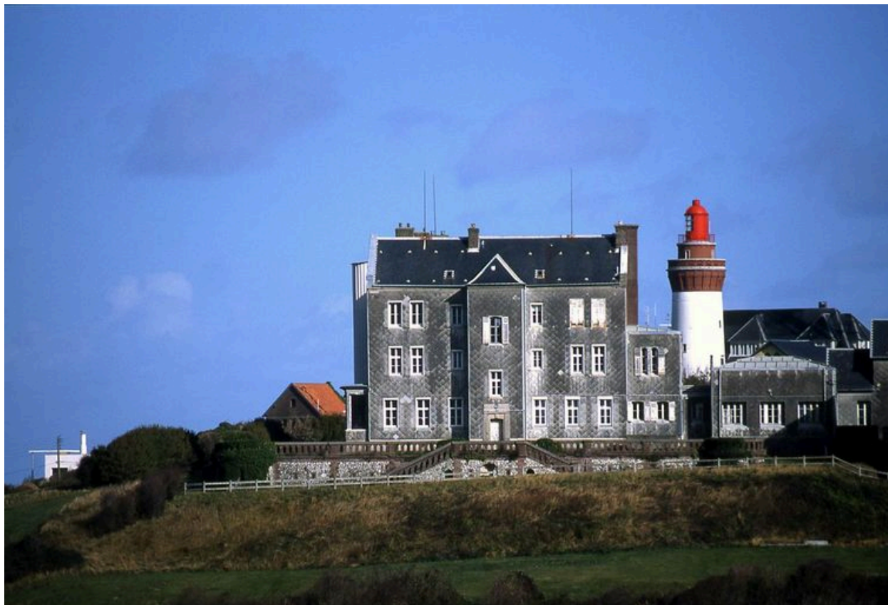
Les Moulinets, maison de villégiature devenue colonie de vacances, Ault (Somme).