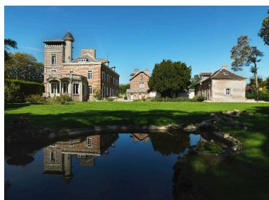
Sains-en-Amiénois (Somme). La Roseraie. IVR22_20148000626NUC2A