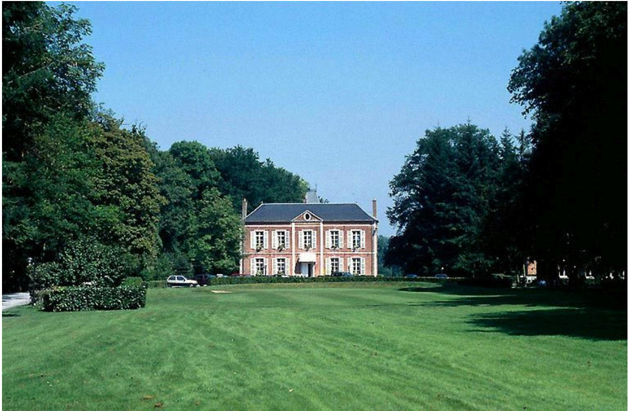
Ancienne demeure, dite Château du Bois-Tilleul, devenue hôtel de tourisme. Landouzy-la-Ville (Aisne).