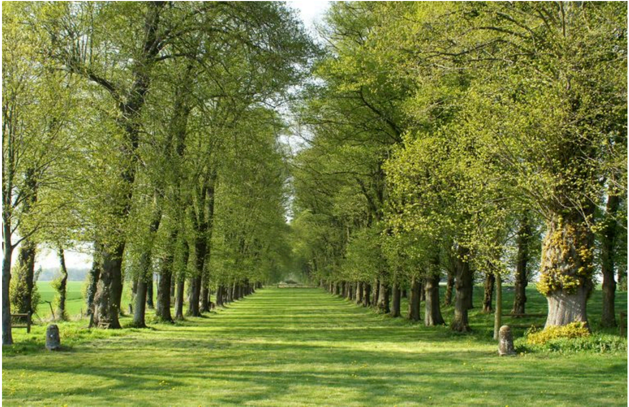
Grand parc et parc de chasse du château de Ribeaucourt (Somme). Perspective de l'avenue de tilleuls depuis l'esplanade.