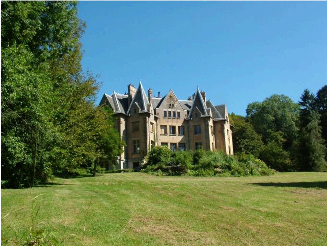
Château de Chevregny (Aisne).