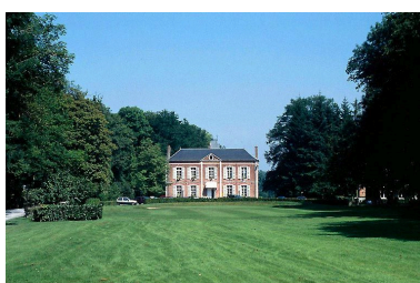
Ancienne demeure, dite Château du Bois-Tilleul, devenue hôtel de tourisme. Landouzy-la-Ville (Aisne).