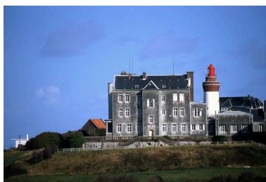
Les Moulins, maison de villégiature devenue colonie de vacances, Ault (Somme). IVR22_20028000073ZA