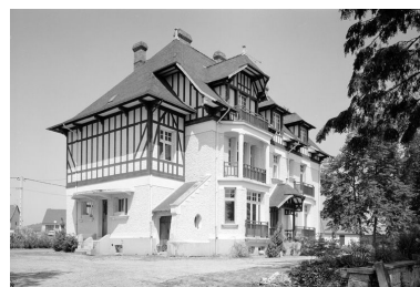
Nouveau château de Morlincourt (Oise).