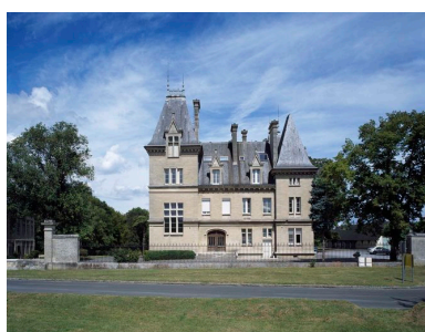
Ancienne demeure d'industriel. Saint-Maximin (Oise).