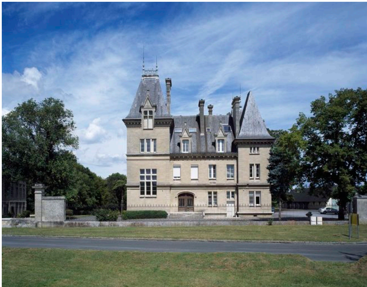
Ancienne demeure d'industriel. Saint-Maximin (Oise).