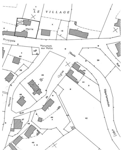
Plan de situation. Extrait du plan cadastral de 1986, section ZA.