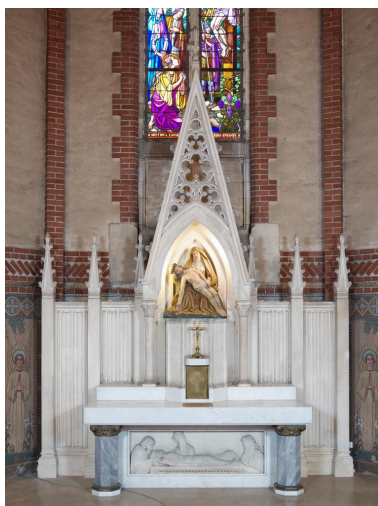
Chapelle Notre-Dame-de-Pitié : vue générale de l'autel secondaire qui abrite la Pietà. IVR32_20216200555NUCA