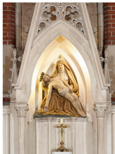
Chapelle Notre-Dame-de-Pitié : Pietà. IVR32_20216200556NUCA