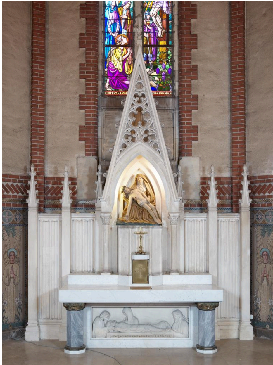
Chapelle Notre-Dame-de-Pitié : vue générale de l'autel secondaire qui abrite la Pietà.