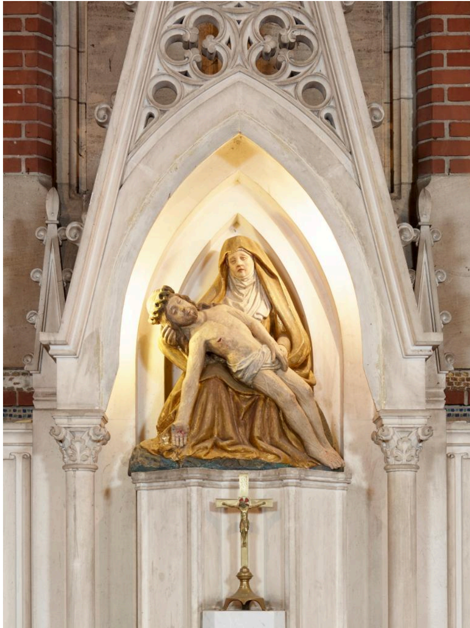
Chapelle Notre-Dame-de-Pitié : Pietà.