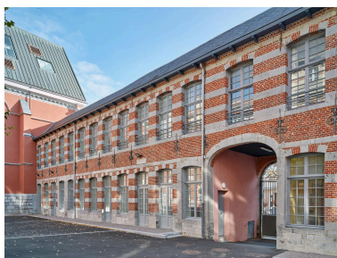
Vue de l'aile orientale, depuis la cour au sud-ouest. IVR32_20225900777NUCA