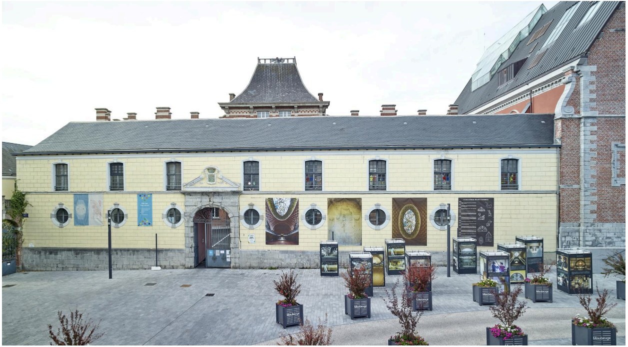
Vue de l'aile orientale depuis l'est.