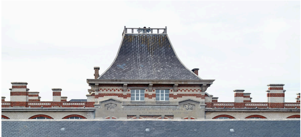
Toiture et partie supérieure du pavillon central, portant une inscription.