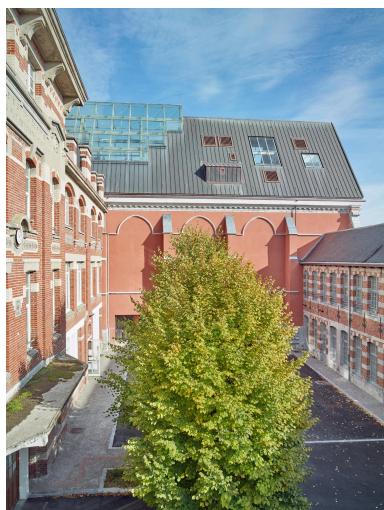
Vue depuis la cour au sud.