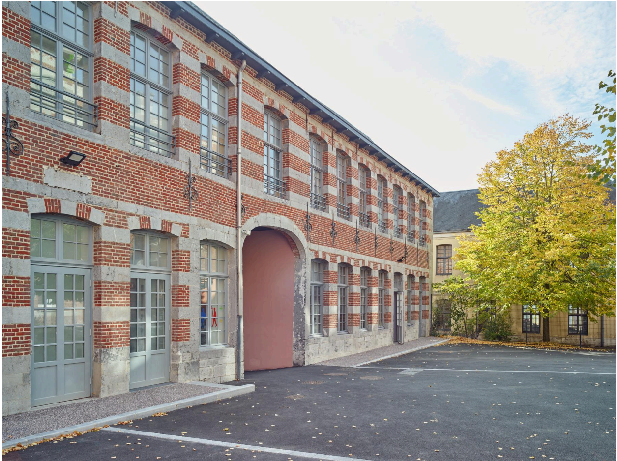
Vue de l'aile orientale, depuis la cour au nord-ouest.