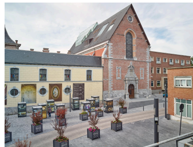
Vue depuis l'est de la chapelle du collège (actuelle salle Sthrau) dans le prolongement de l'aile orientale.