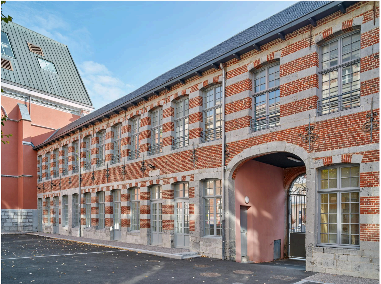
Vue de l'aile orientale, depuis la cour au sud-ouest.