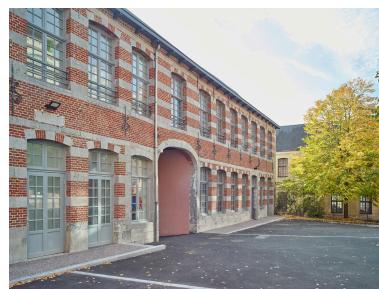
Vue de l'aile orientale, depuis la cour au nord-ouest. IVR32_20225900780NUCA