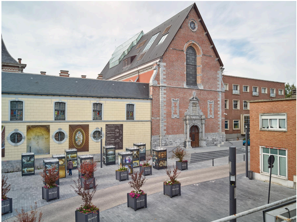
Vue depuis l'est de la chapelle du collège (actuelle salle Sthrau) dans le prolongement de l'aile orientale.