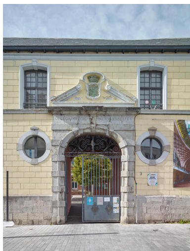
Vue du portail de l'aile orientale portant l'inscription "COLLEGIUM REGIUM MALBODIENSE 1765".