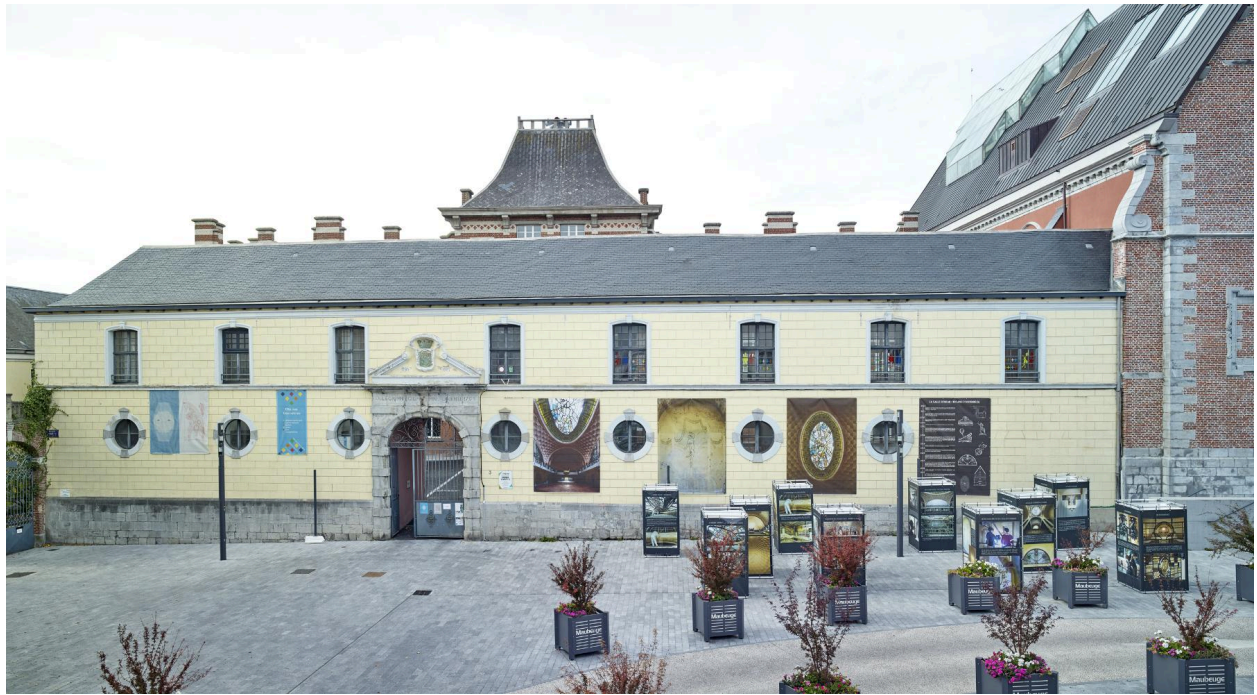
Vue de l'aile orientale depuis l'est.