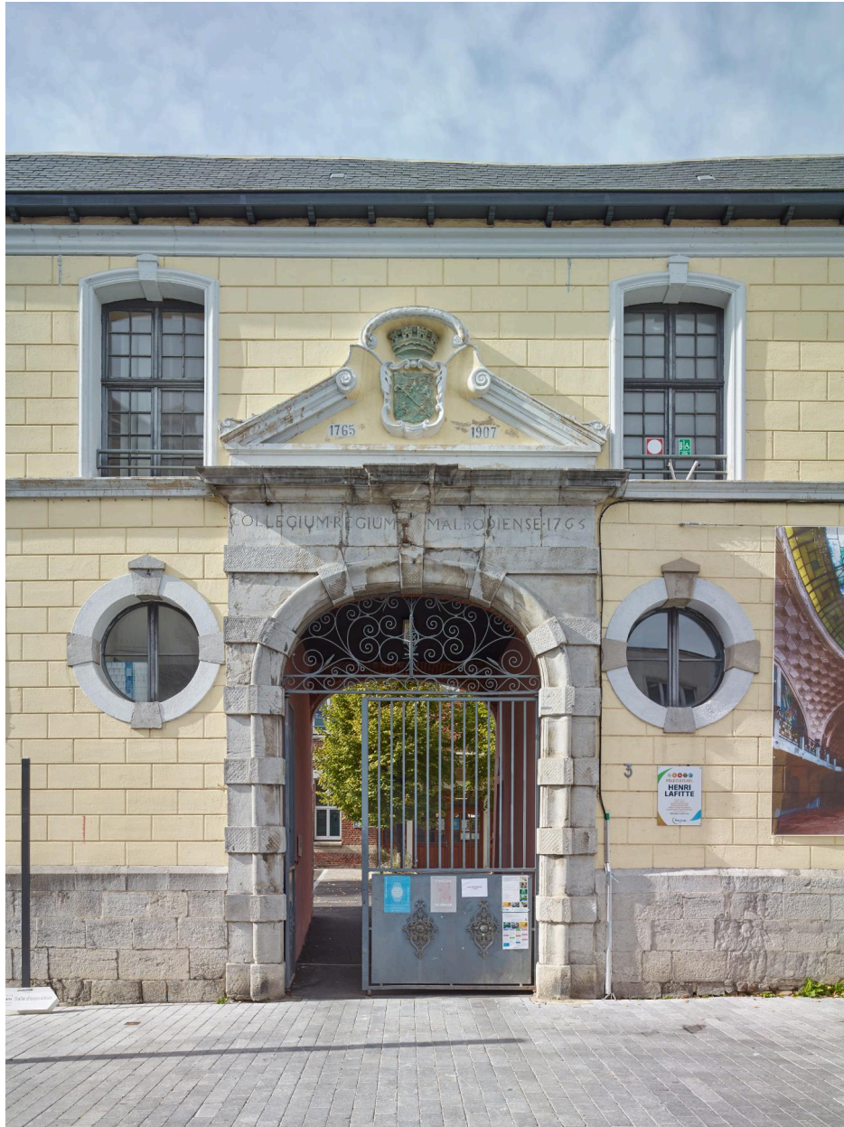
Vue du portail de l'aile orientale portant l'inscription "COLLEGIUM REGIUM MALBODIENSE 1765".