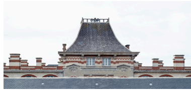
Toiture et partie supérieure du pavillon central, portant une inscription.