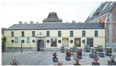
Vue de l'aile orientale depuis l'est. IVR32_20225900808NUCA