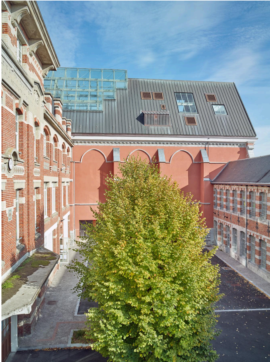
Vue depuis la cour au sud.