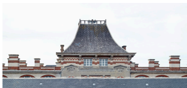
Toiture et partie supérieure du pavillon central, portant une inscription.