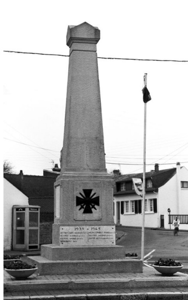
Vue de la face postérieure, en 1996. IVR22_19968000012Z