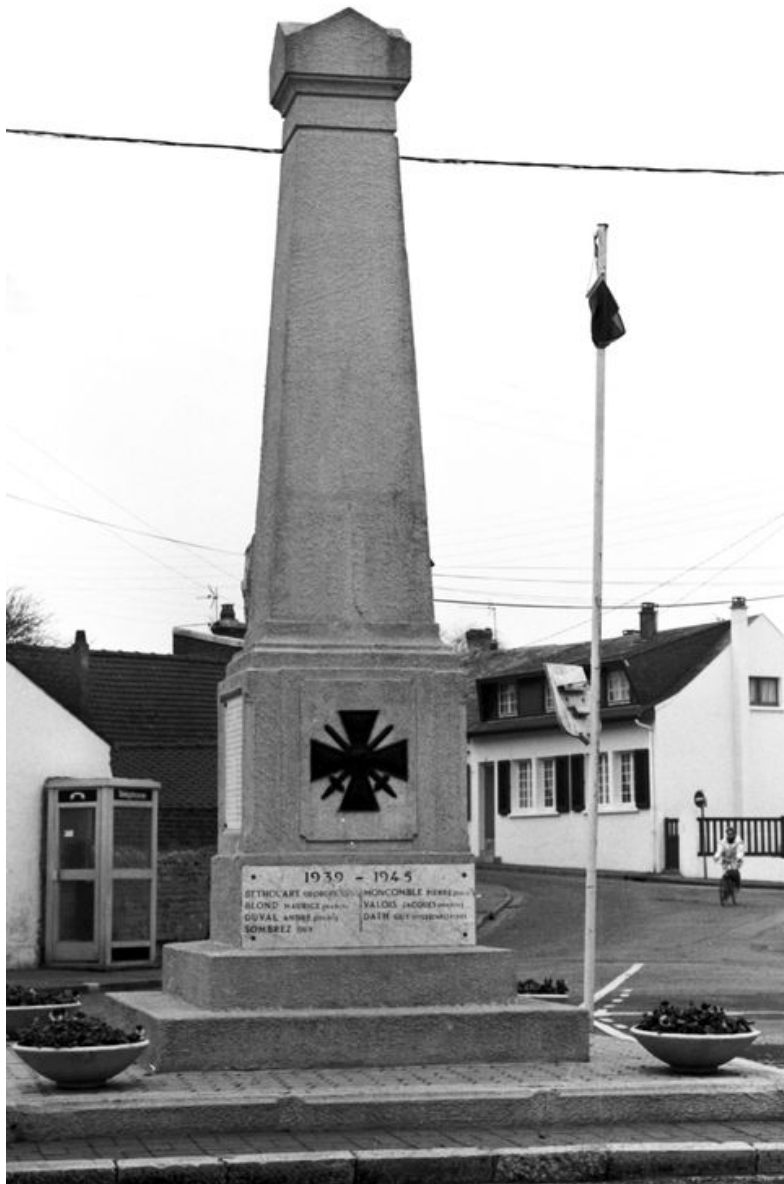
Vue de la face postérieure, en 1996.