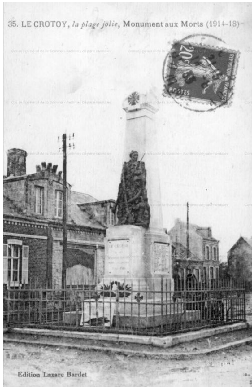
Le monument avec sa grille d'entourage, en 1933.