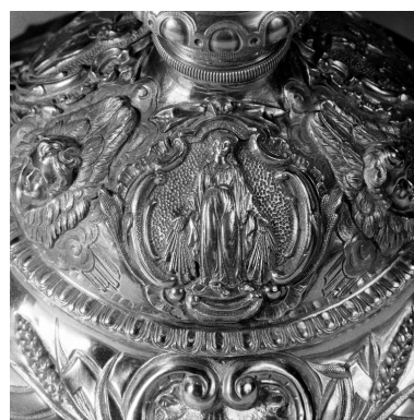
Détail du pied : l'Immaculée Conception.