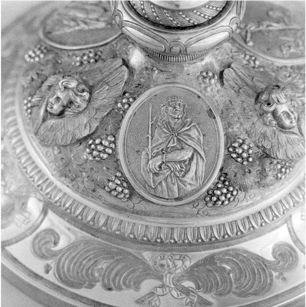
Détail du pied : le Christ aux liens.