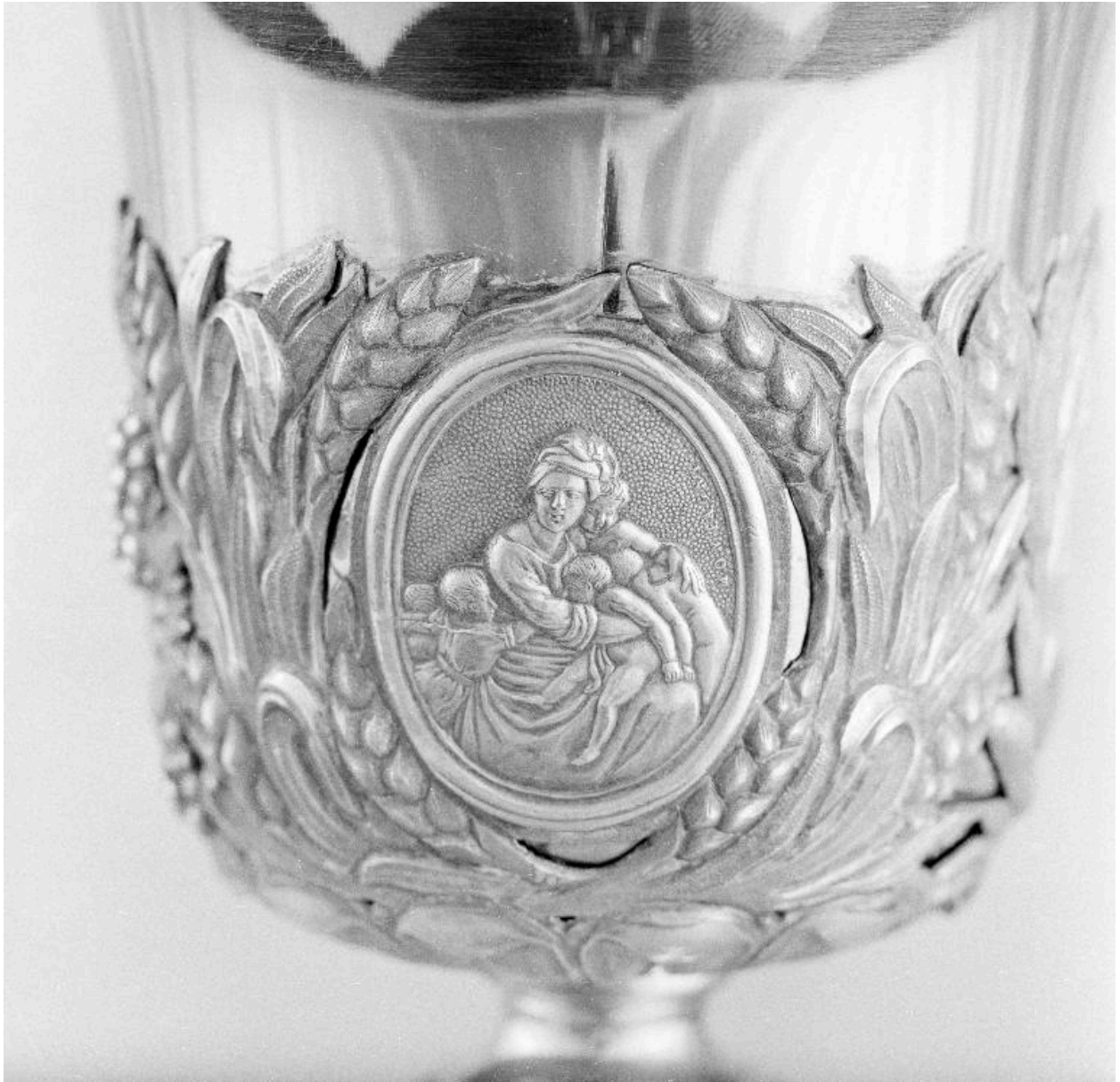
Détail de la fausse-coupe : la Charité.