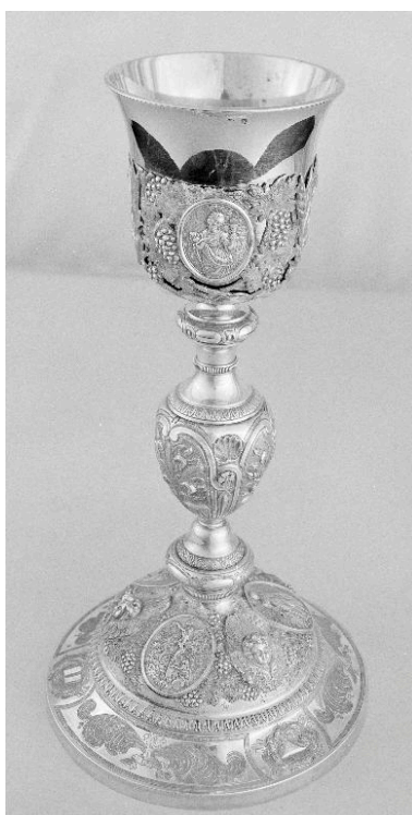
Vue du revers. IVR22_19956000206X