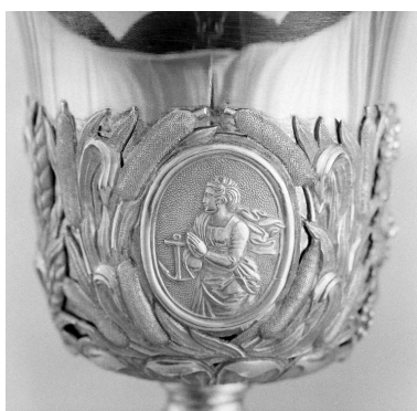
Détail de la fausse-coupe : l'Espérance.