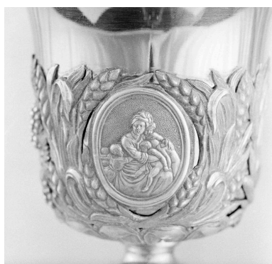
Détail de la fausse-coupe : la Charité. IVR22_19956000208X