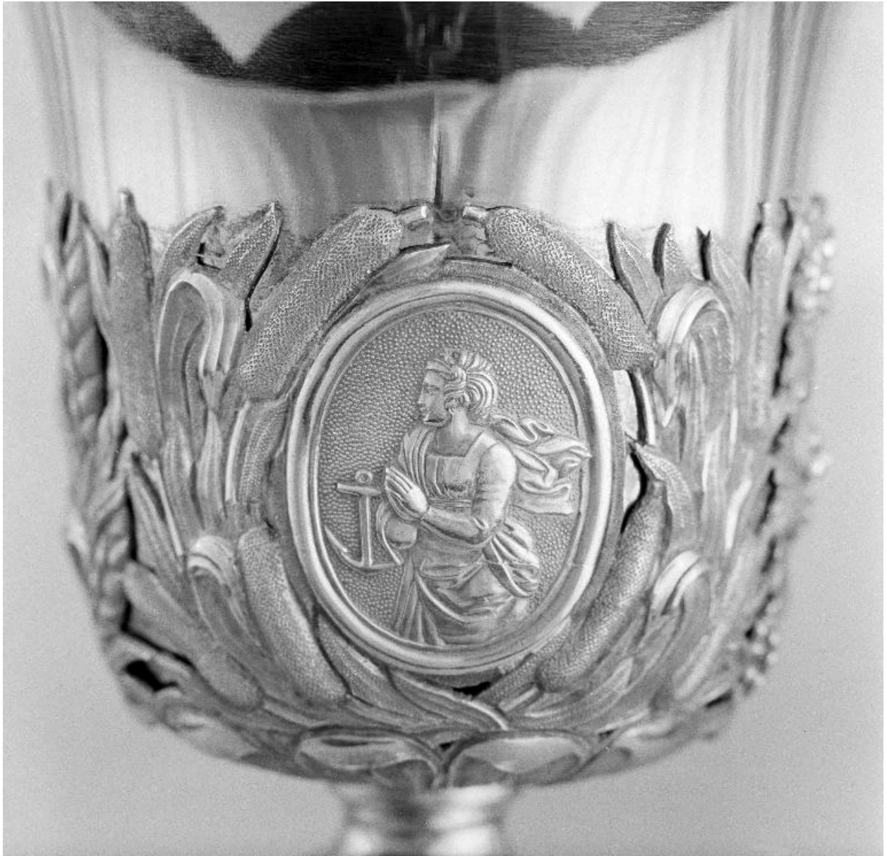
Détail de la fausse-coupe : l'Espérance.