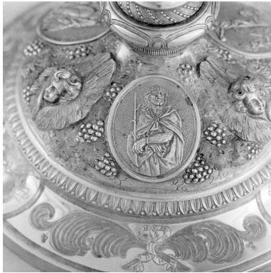
Détail du pied : le Christ aux liens.