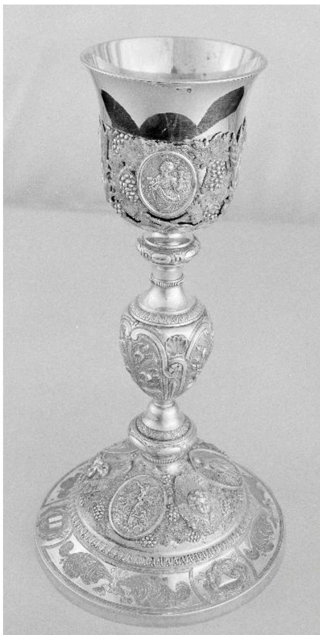
Vue du revers.