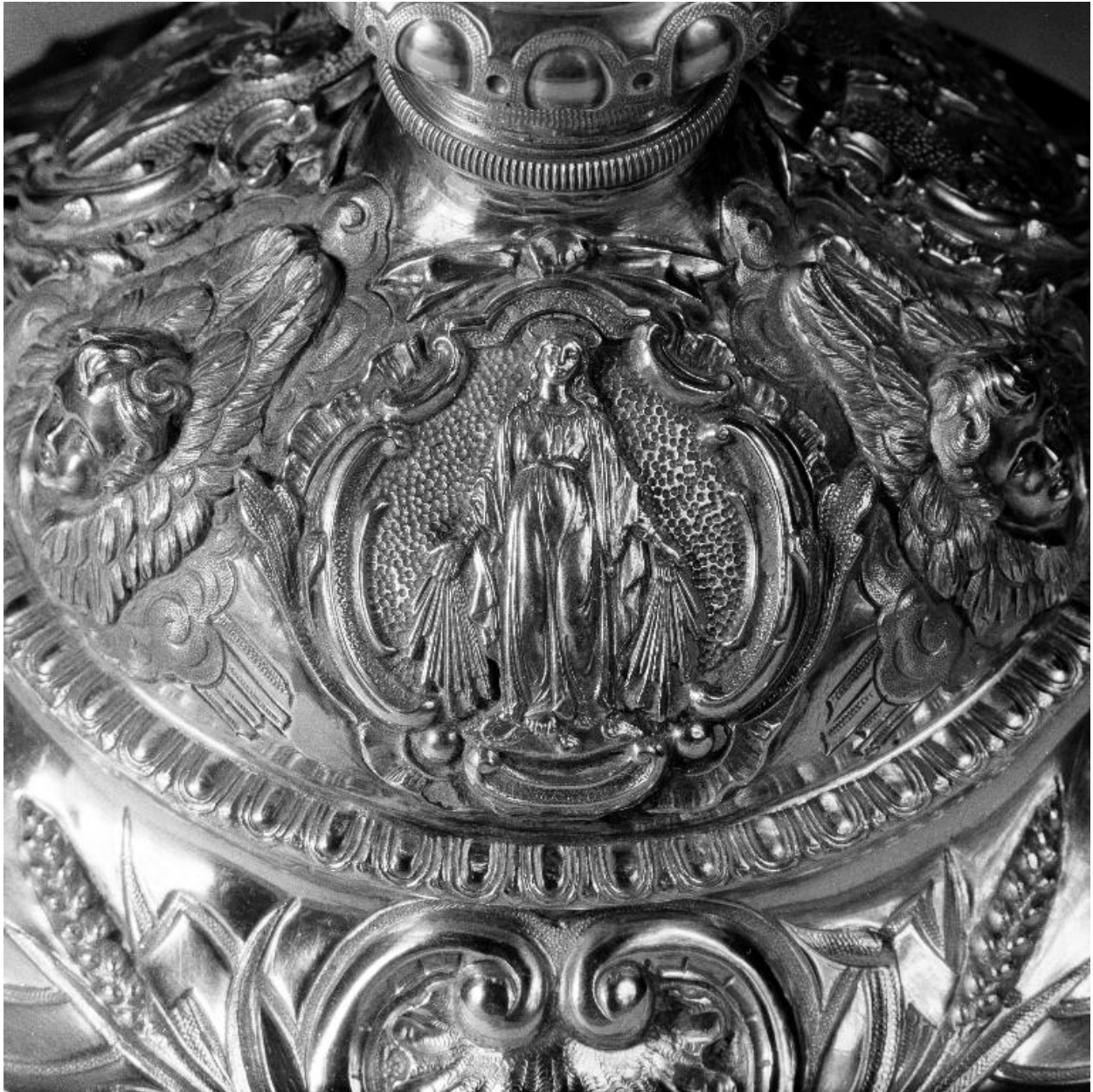
Détail du pied : l'Immaculée Conception.