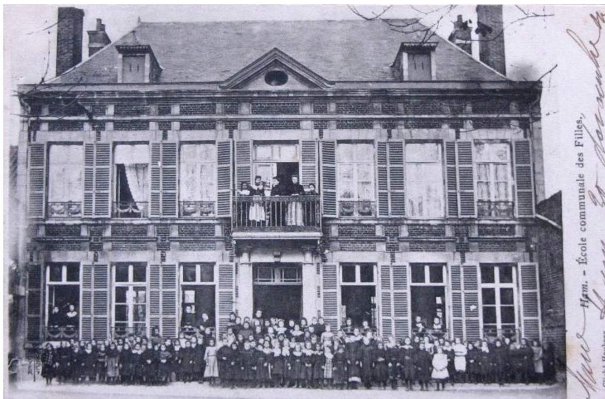
L'ancienne école de filles, cliché Haubrex, carte postale, début 20e siècle (Coll. Cercle Cartophile de Ham).