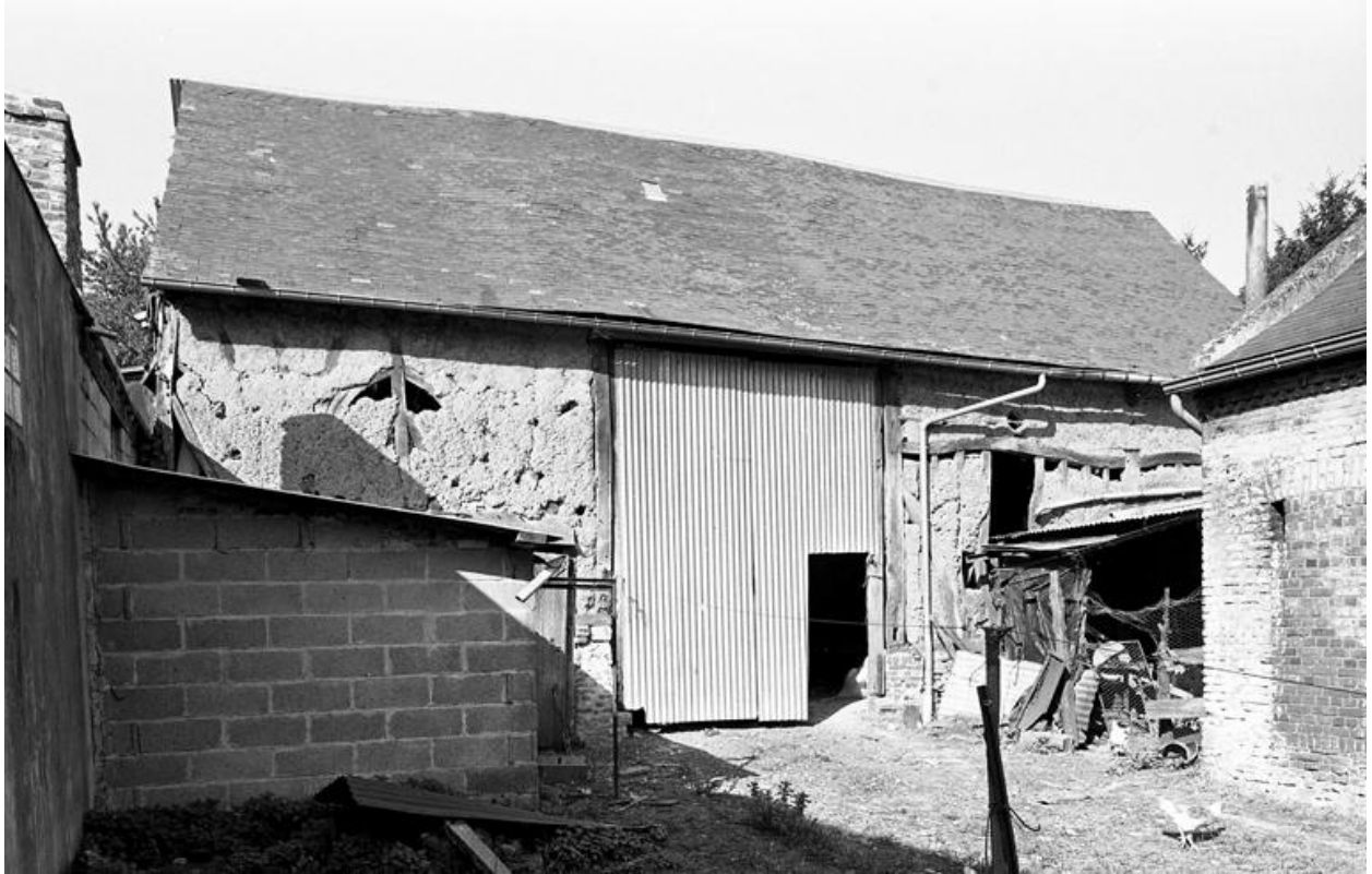
Vue d'ensemble de la grange.