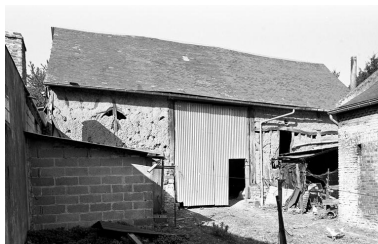
Vue d'ensemble de la grange. IVR22_19940201432Z