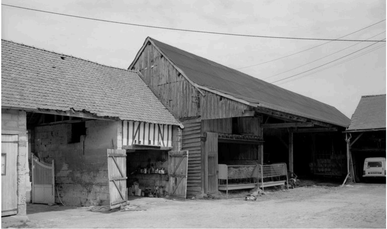
Hangar et ancien pigeonnier, depuis la cour.