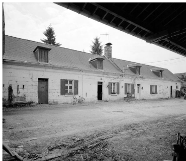
Logis. Elévation antérieure. IVR22_19856000844V