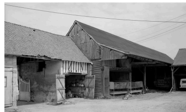
Hangar et ancien pigeonnier, depuis la cour.