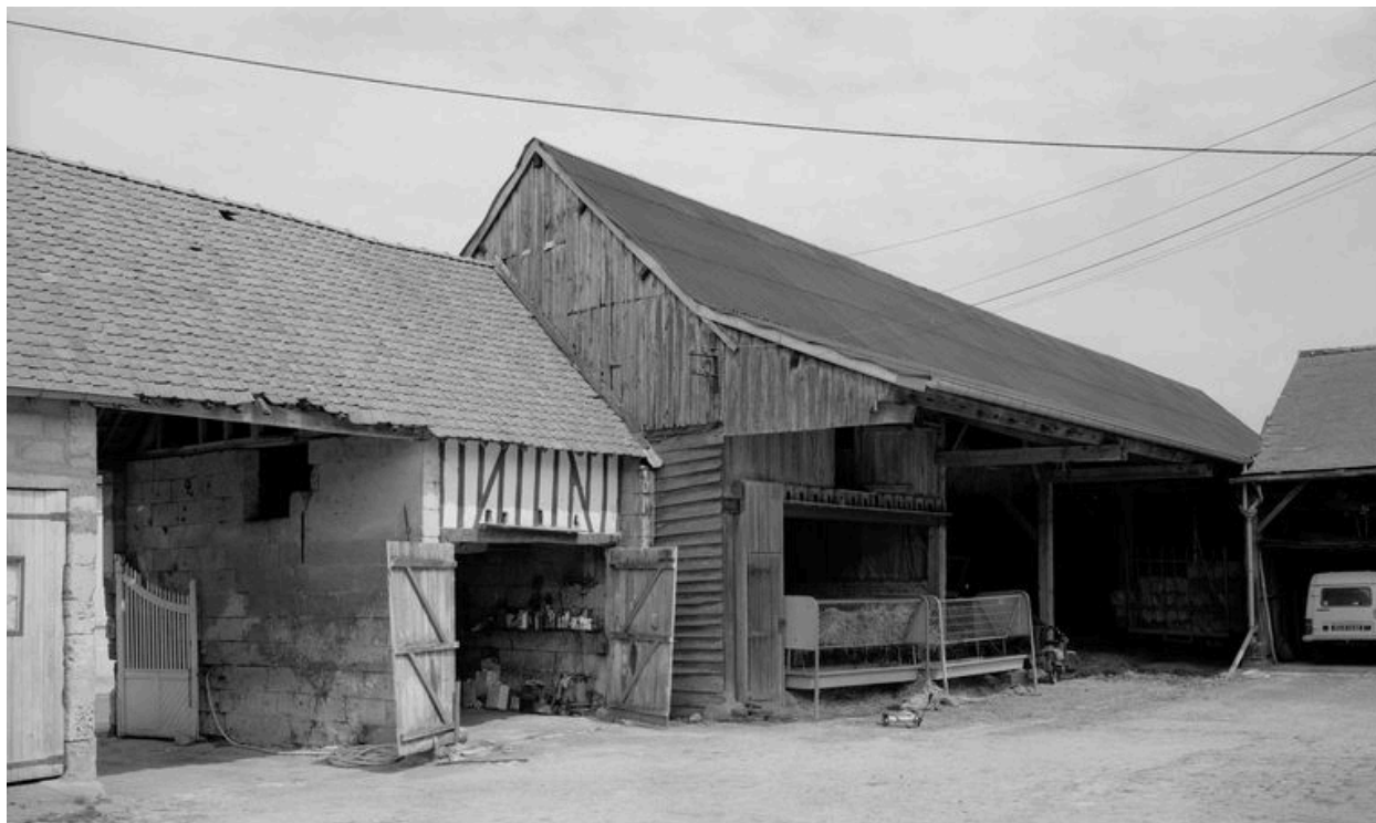
Hangar et ancien pigeonnier, depuis la cour.