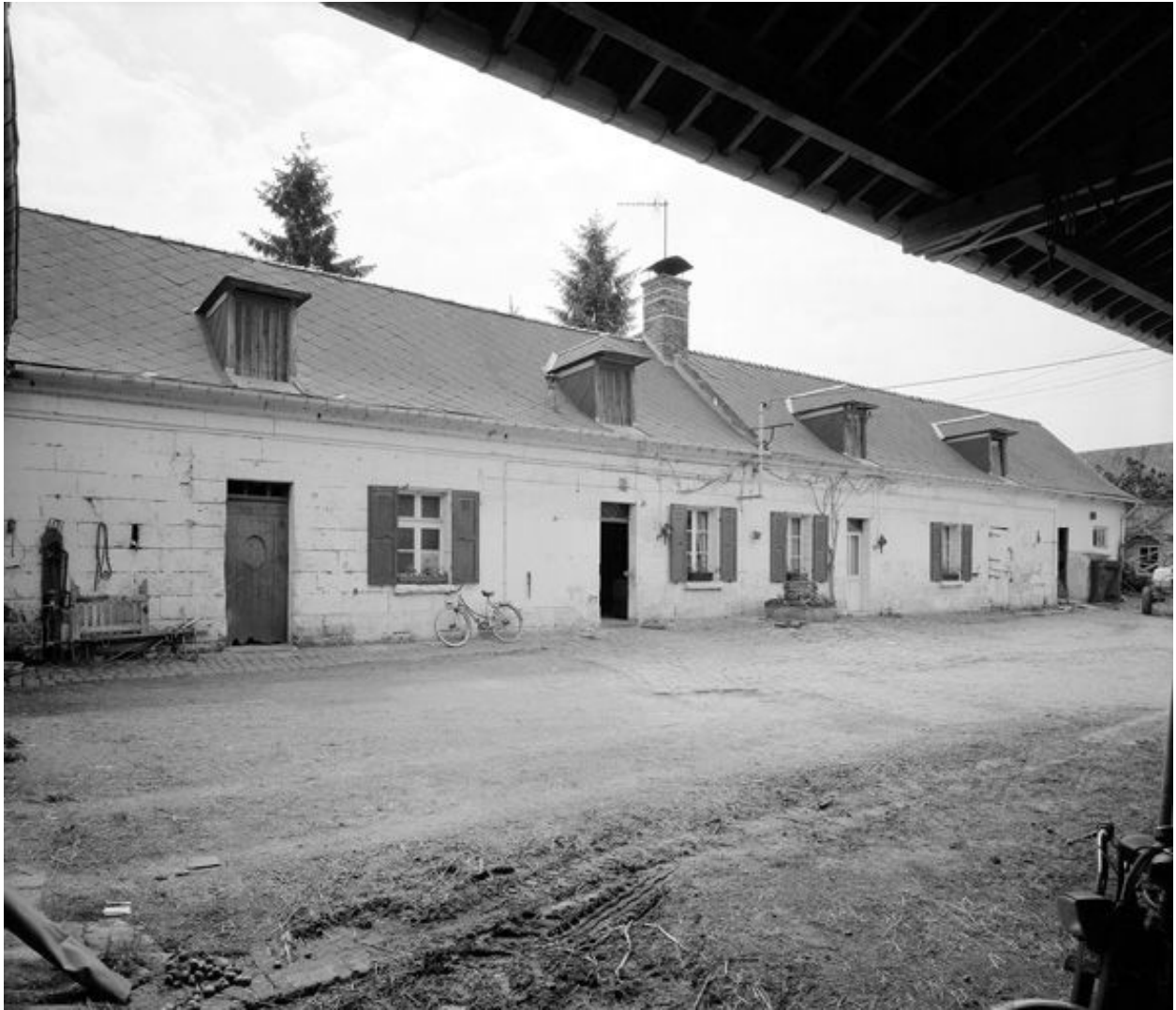
Logis. Elévation antérieure.