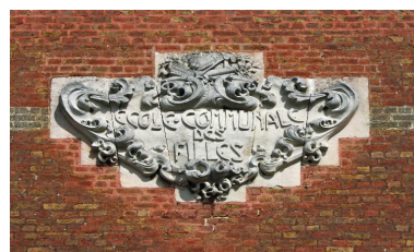
Détail du cartouche orné de l'école communale des filles.