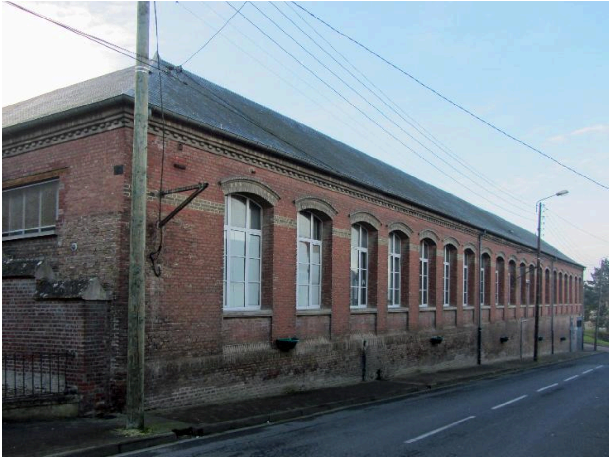
Façade sur rue des salles de classe.