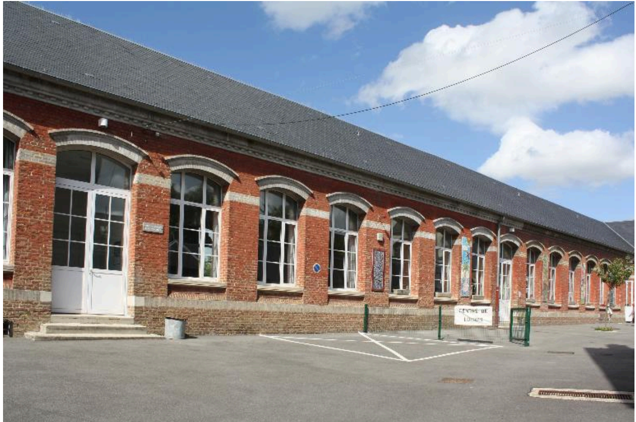
Façade sur cour.