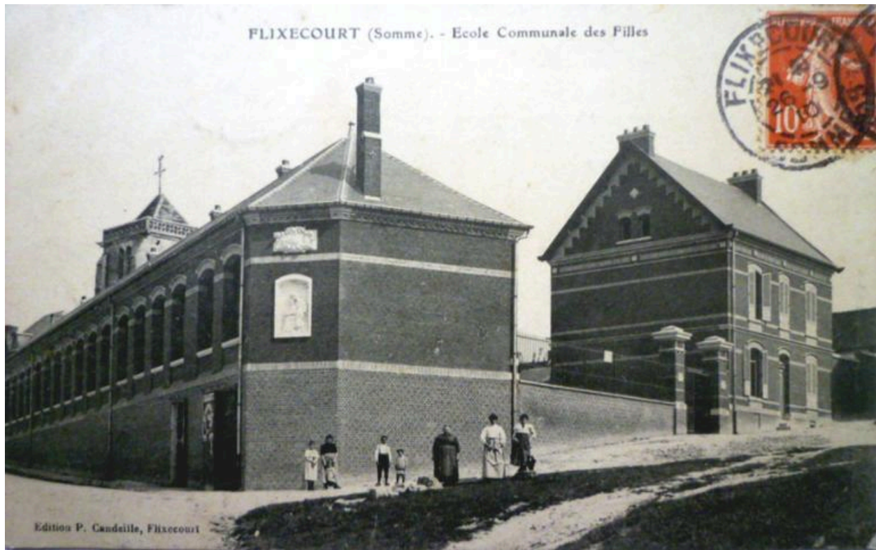
L'école, en 1910 (coll. part.).