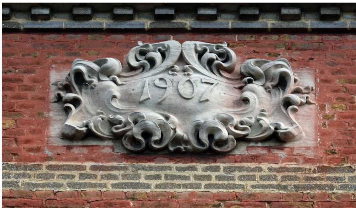
Cartouche portant la date de 1907.