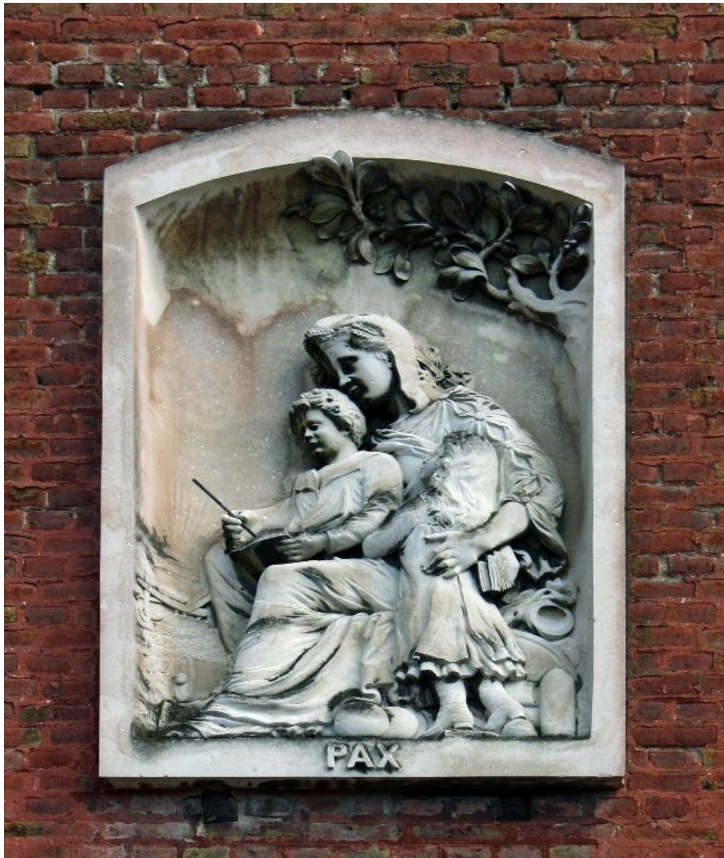
Détail du haut-relief de l'allégorie de la paix sculpté par Georges Legrand.