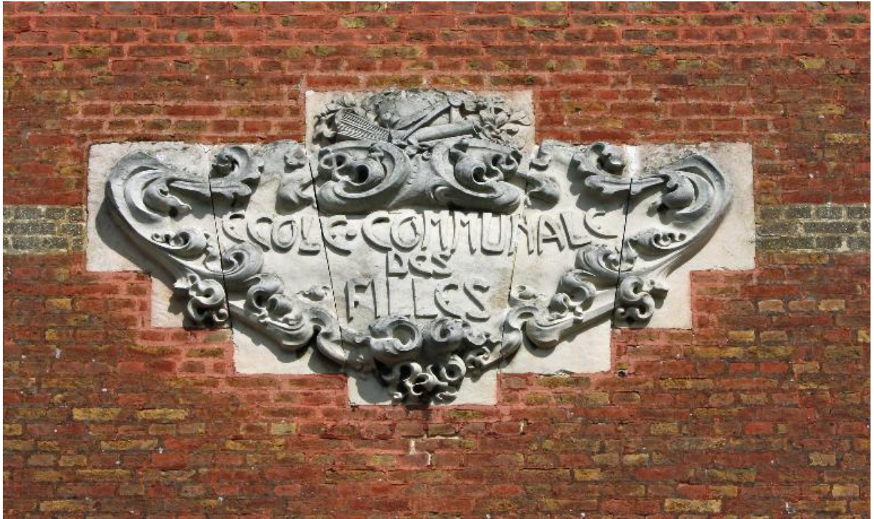
Détail du cartouche orné de l'école communale des filles.