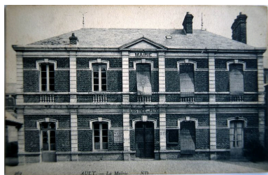
L'ancienne école de garçons, mairie et justice de paix, carte postale, 1er quart 20e siècle IVR22_20058000636XAB