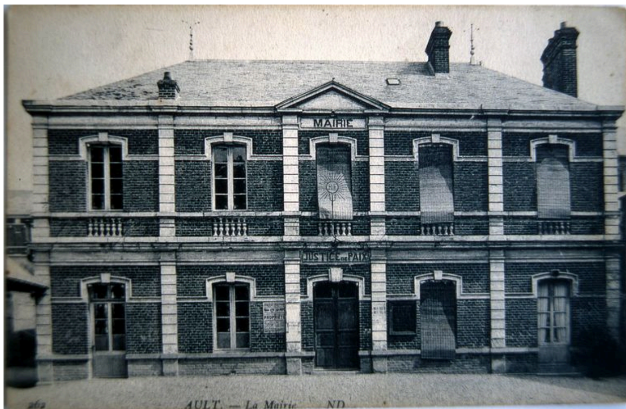
L'ancienne école de garçons, mairie et justice de paix, carte postale, 1er quart 20e siècle