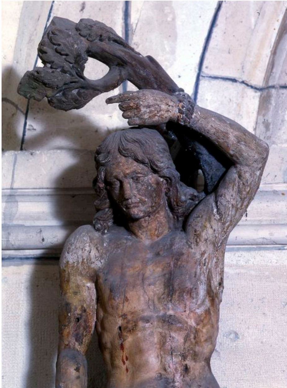
Vue de la statue à mi-corps