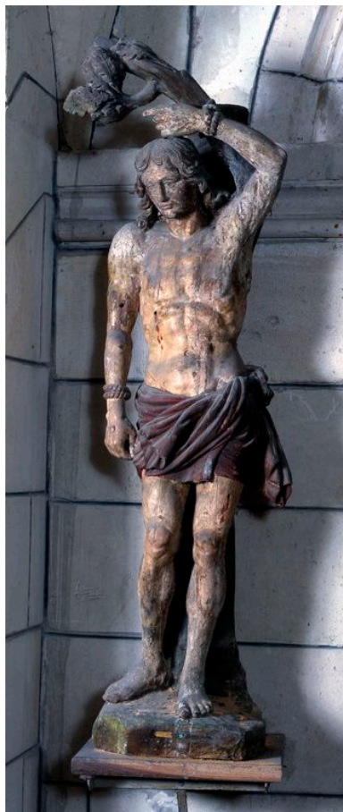
Vue générale IVR22_20040202504XA