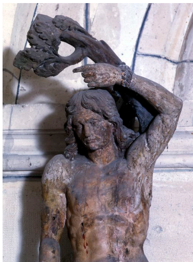
Vue de la statue à mi-corps