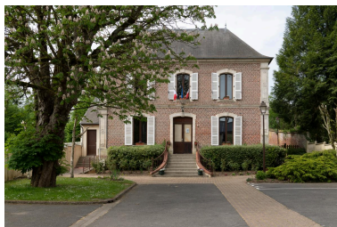
Mairie (ancien presbytère), Rue Principale, vue depuis le nord-est. IVR32_20226000407NUCA