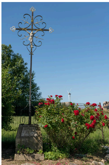
Croix de chemin au nord de la Neuve-Rue, vue depuis le nord-est. IVR32_20226000716NUCA