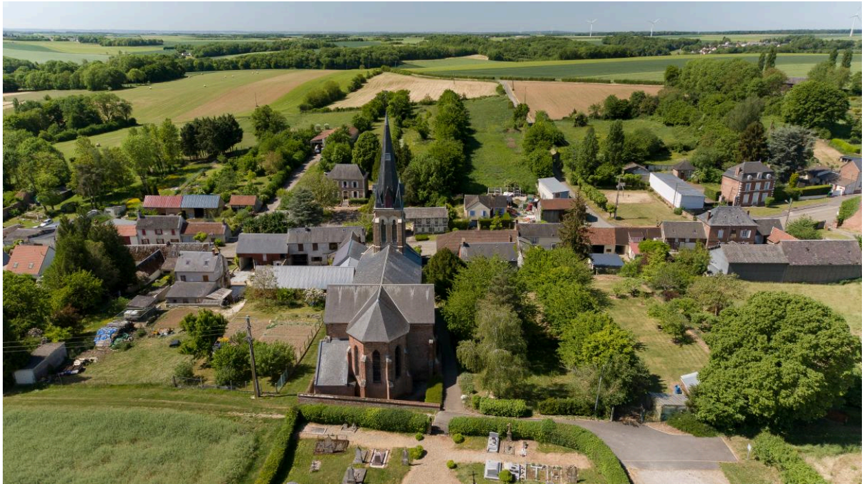
Vue aérienne de la Rue Principale depuis le nord-est.