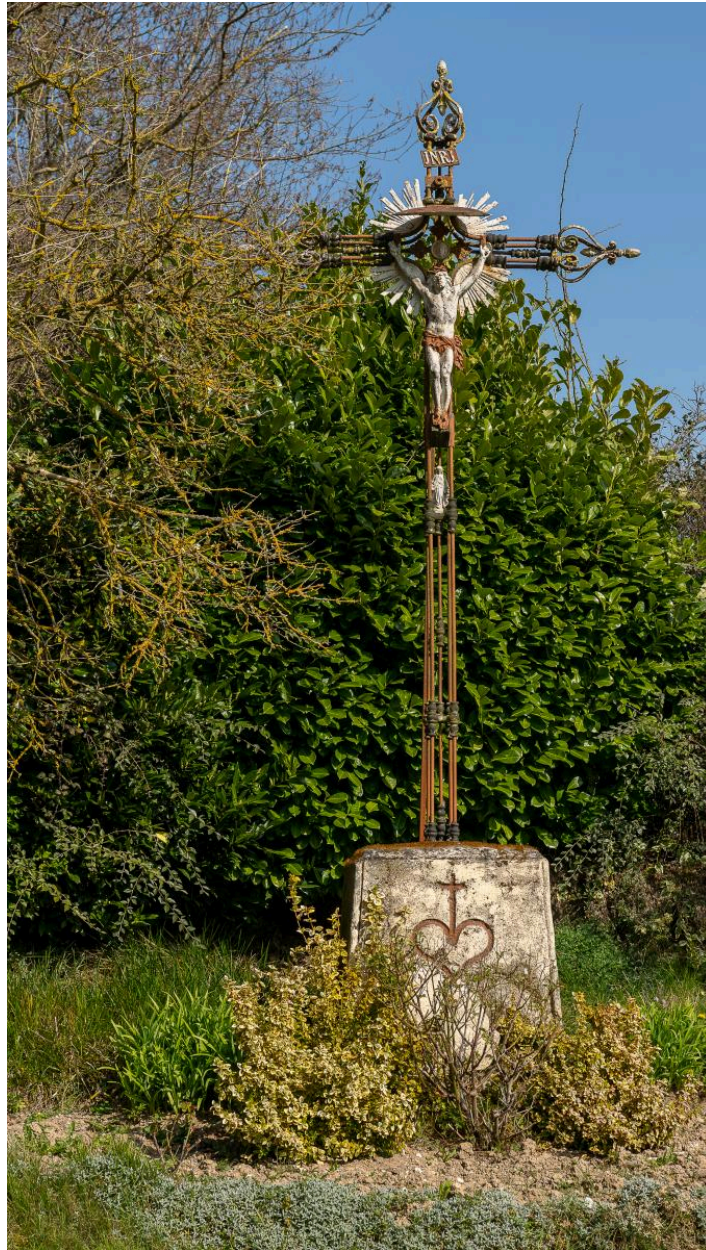
Croix de chemin à la sortie sud de la Rue Principale, vue depuis le sud.