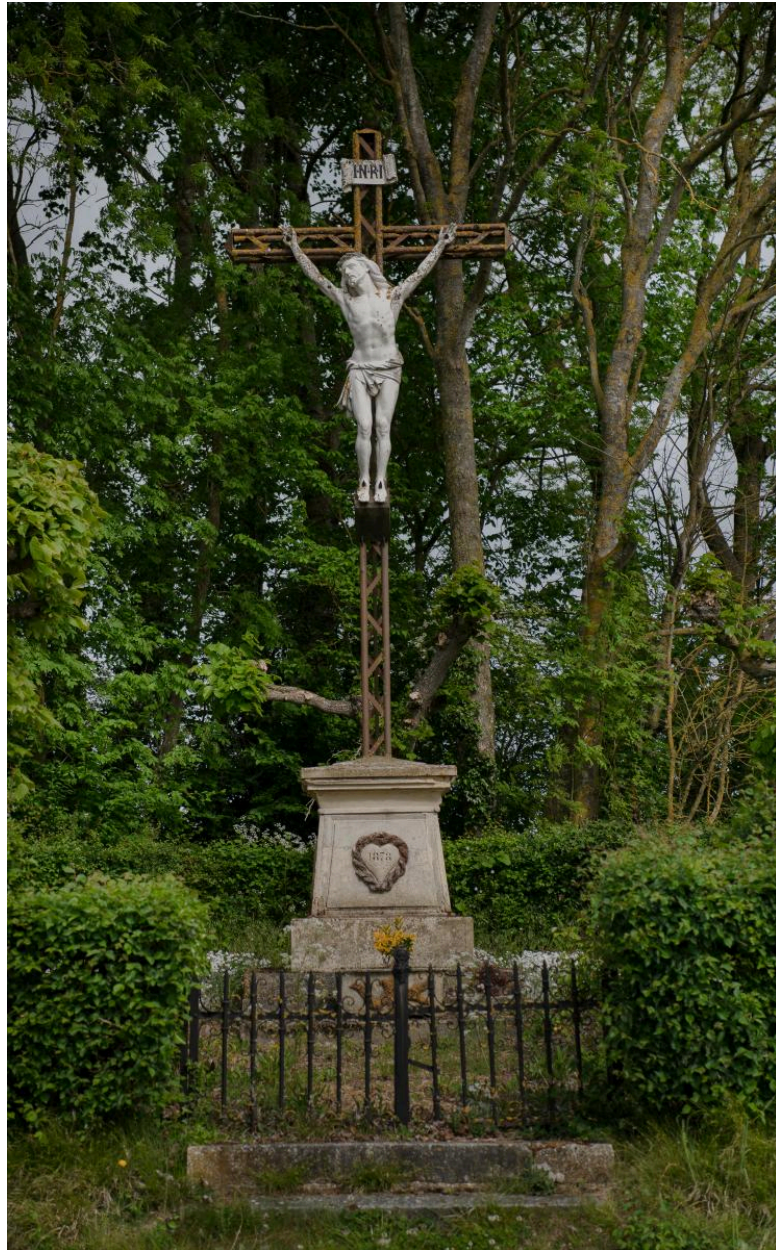
Croix de chemin sortie nord de la Rue Principale, vue depuis le sud.