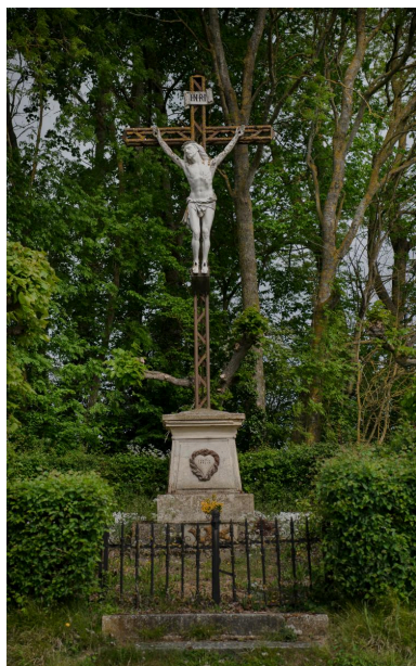
Croix de chemin sortie nord de la Rue Principale, vue depuis le sud.