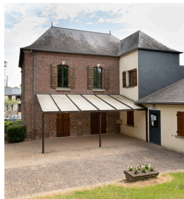
Mairie (ancien presbytère), vue depuis le sud-ouest. IVR32_20226000408NUCA