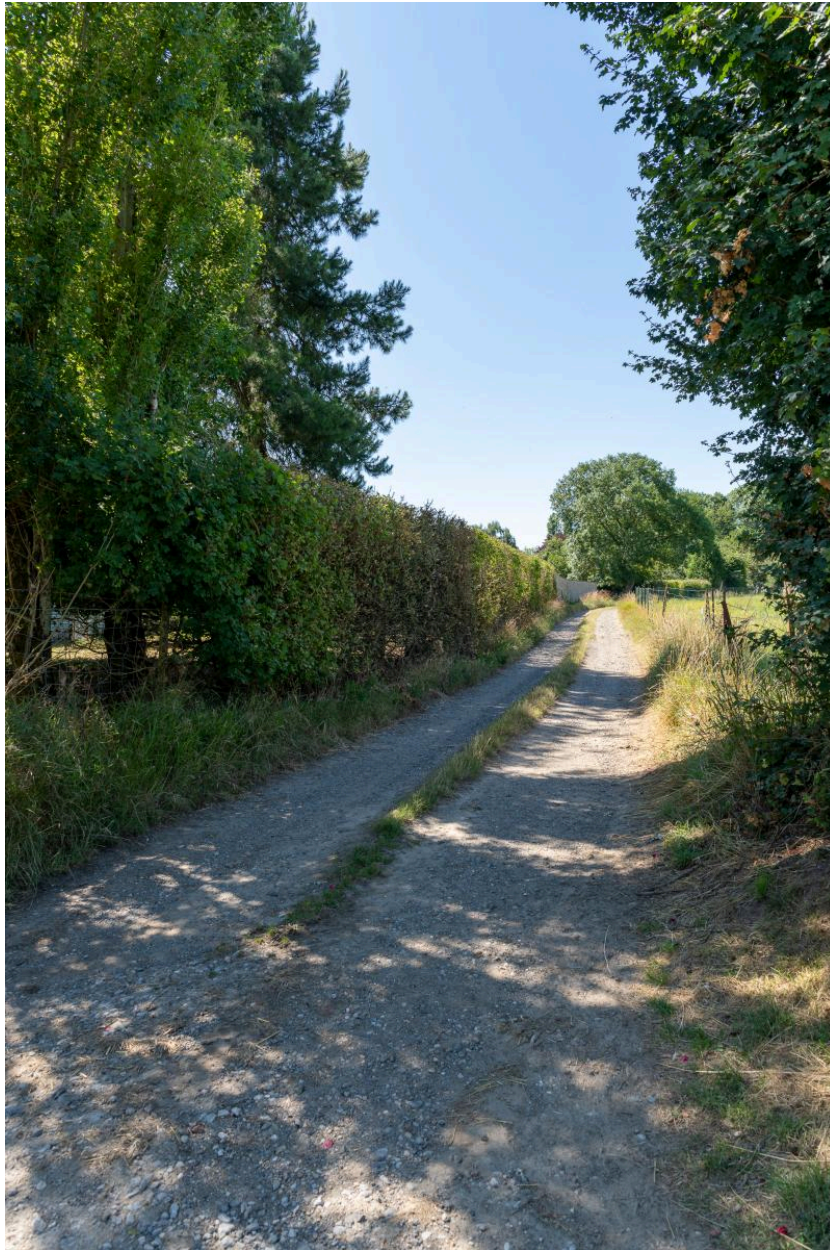
Chemin du tour de ville au nord de la Neuve Rue, vue depuis le nord.