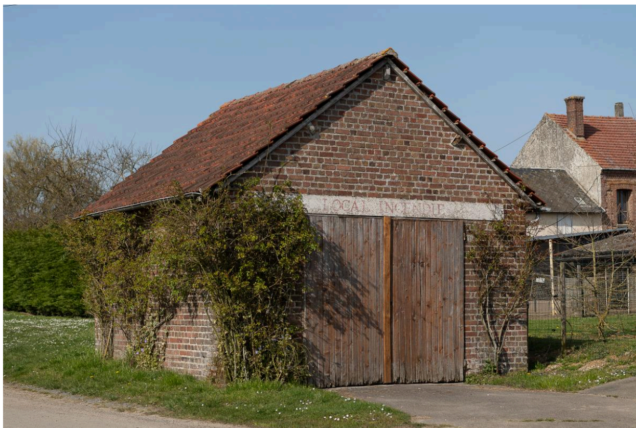
Remise des pompes à incendie, Neuve Rue, vue depuis le sud-est.