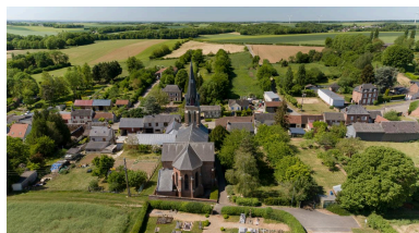
Vue aérienne de la Rue Principale depuis le nord-est.