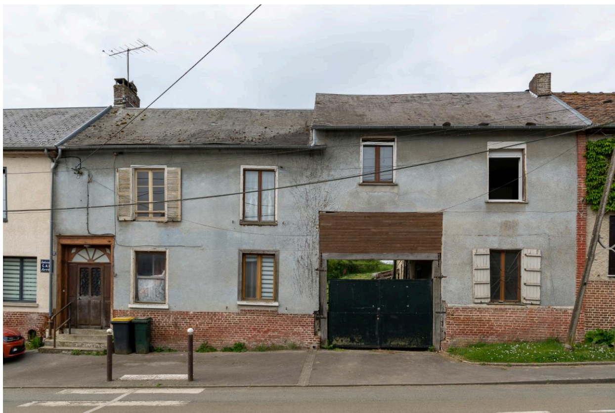
Ancien commerce, n°35 Grande Rue, vue depuis le nord-est.