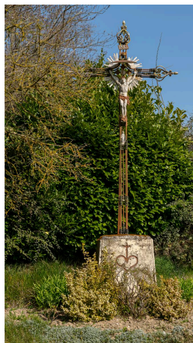
Croix de chemin à la sortie sud de la Rue Principale, vue depuis le sud. IVR32_20226000210NUCA