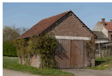
Remise des pompes à incendie, Neuve Rue, vue depuis le sud-est. IVR32_20226000209NUCA