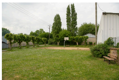
Place publique Rue Principale, vue depuis le nord-est.