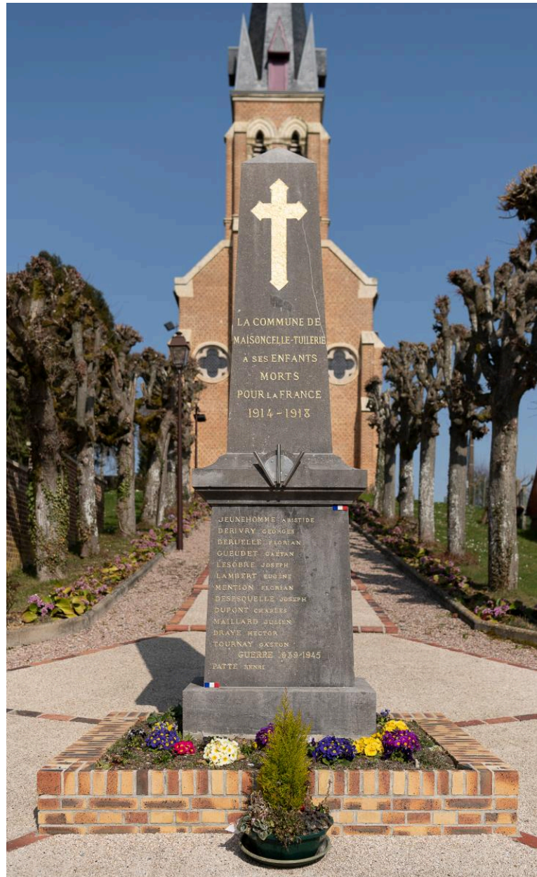
Monument aux morts des deux guerres mondiales, vers 1920, vue depuis le sud-ouest.