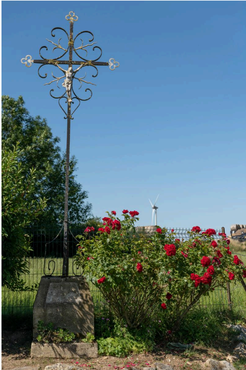
Croix de chemin au nord de la Neuve-Rue, vue depuis le nord-est.