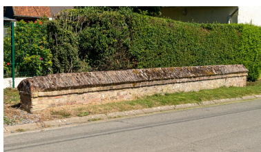
Mur d'une ancienne mare de La Neuve Rue, vue depuis l'est. IVR32_20226000719NUCA