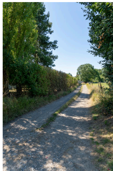
Chemin du tour de ville au nord de la Neuve Rue, vue depuis le nord. IVR32_20226000717NUCA