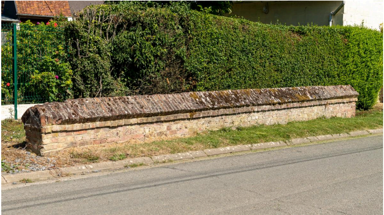
Mur d'une ancienne mare de La Neuve Rue, vue depuis l'est.