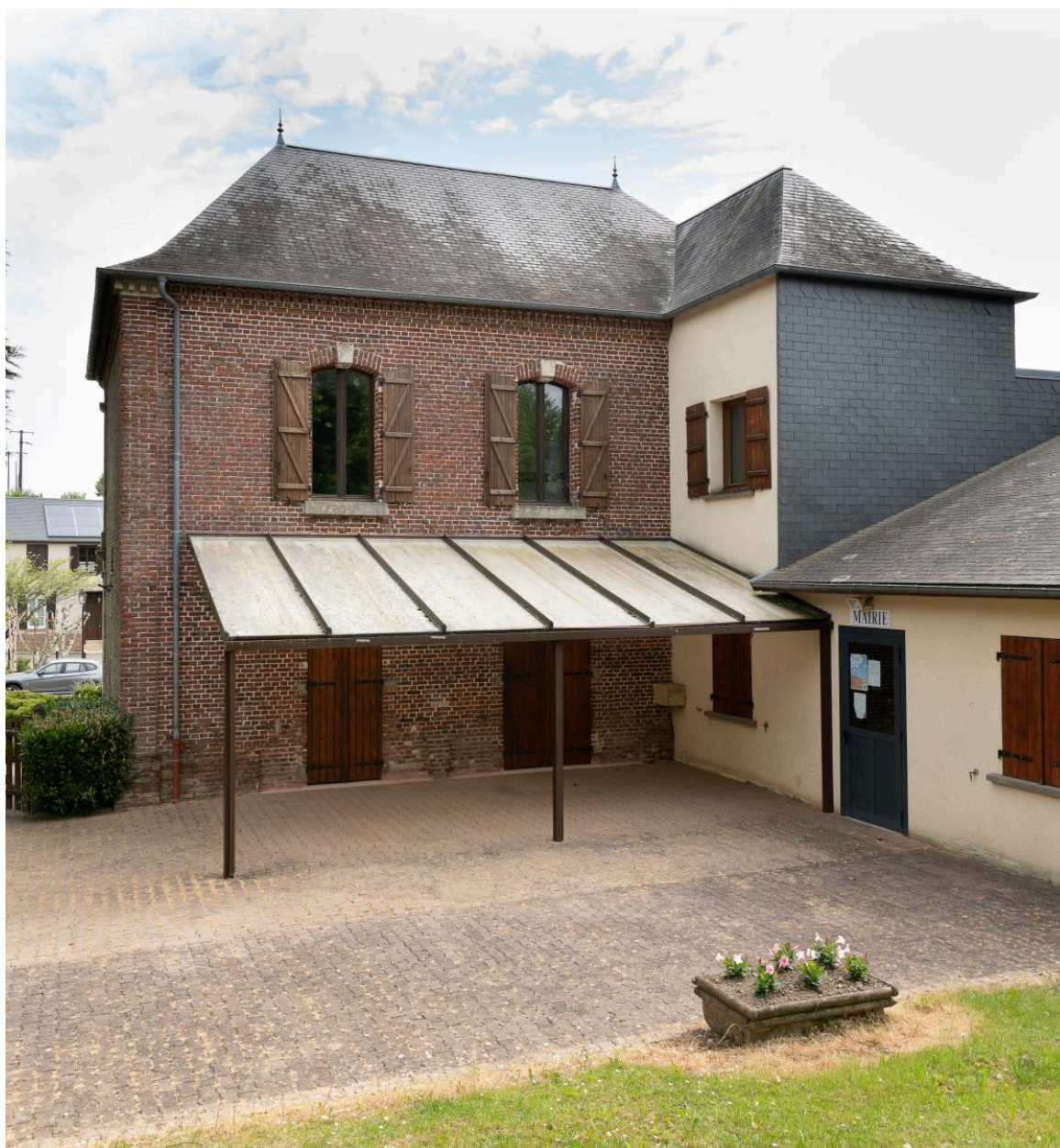
Mairie (ancien presbytère), vue depuis le sud-ouest.