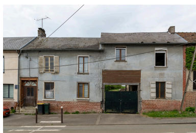
Ancien commerce, n°35 Grande Rue, vue depuis le nord-est.