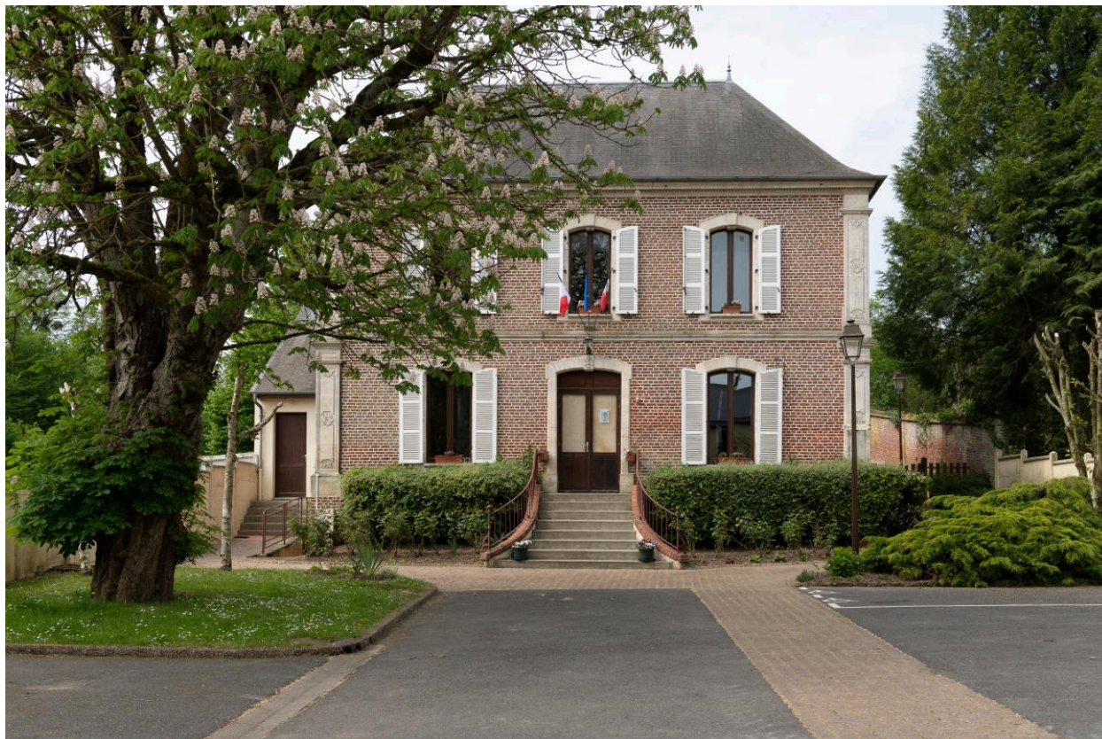
Mairie (ancien presbytère), Rue Principale, vue depuis le nord-est.