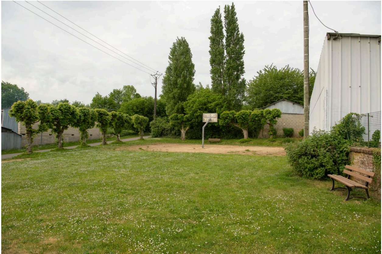
Place publique Rue Principale, vue depuis le nord-est.