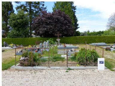
Vue générale. IVR32_20228005084NUCA