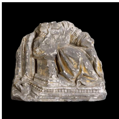
Vue de Jessé endormi (?).