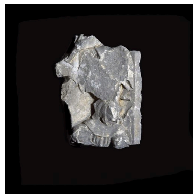
Vue d'un élément du relief.