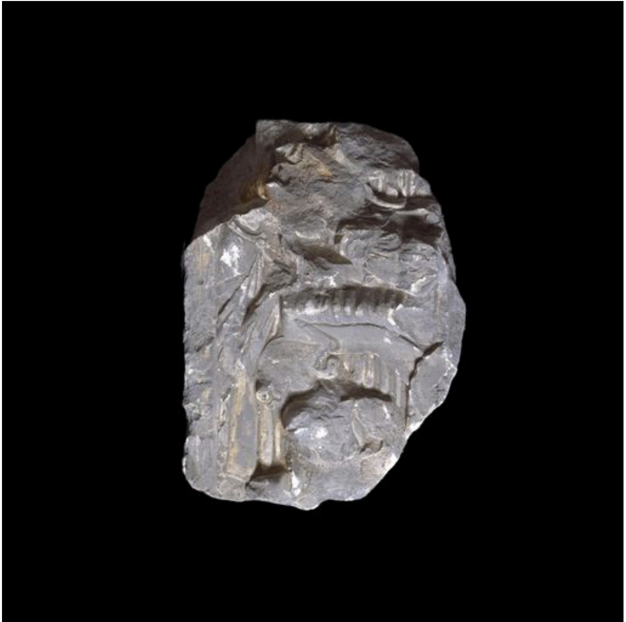
Elément du relief (?).