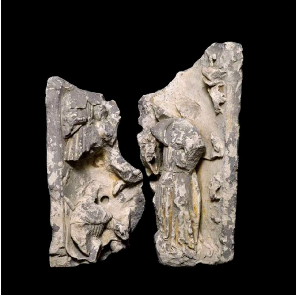
Représentation de rois de Juda (?).