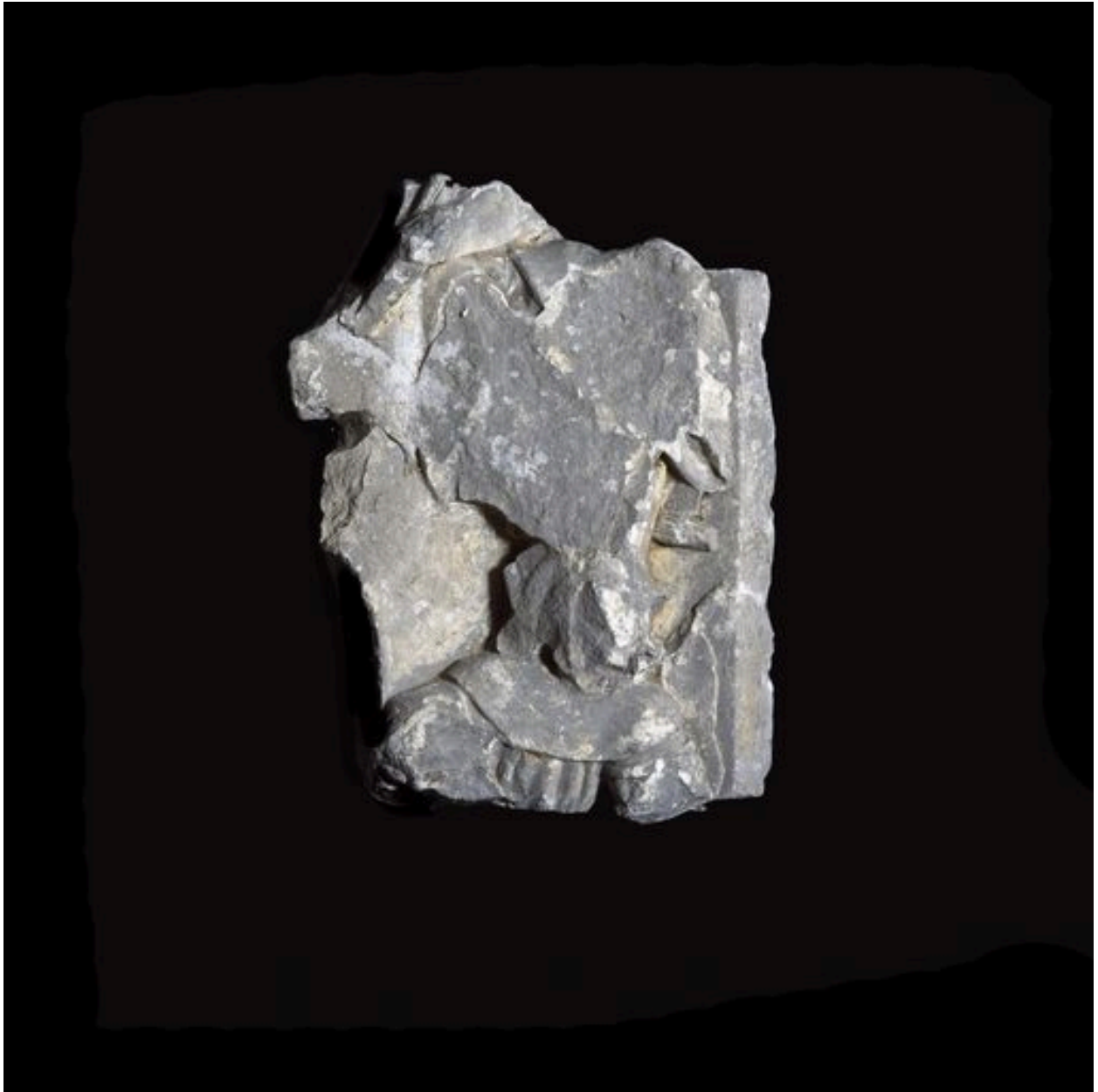
Vue d'un élément du relief.