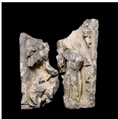
Représentation de rois de Juda (?). IVR22_20100200035XA