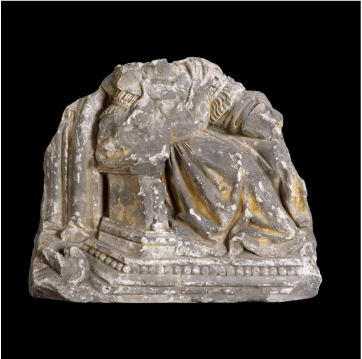
Vue de Jessé endormi (?).