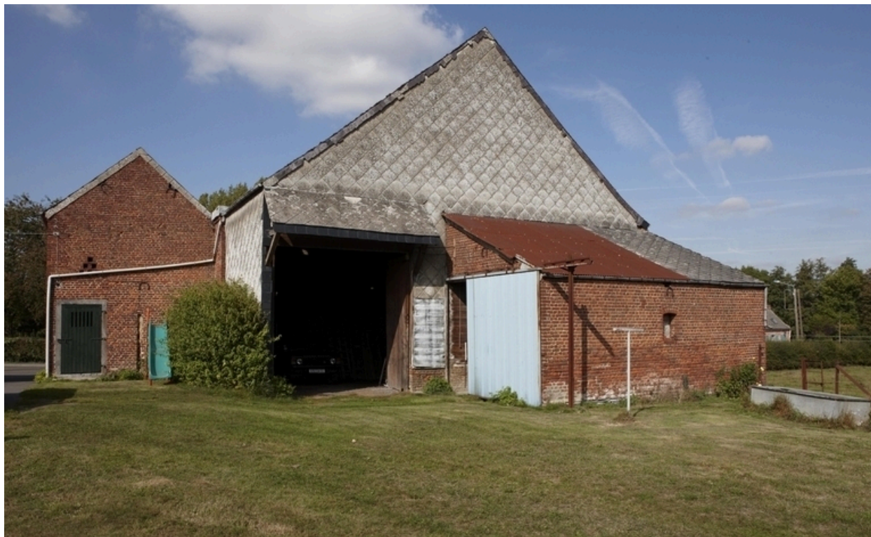
Vue de la grange et des remises qui lui sont accolées.