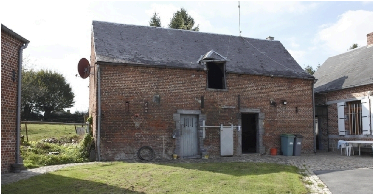
Vue générale de l'étable-fenil située à l'ouest.