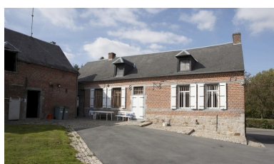
Vue du logis et vue partielle de l'étable attenante.