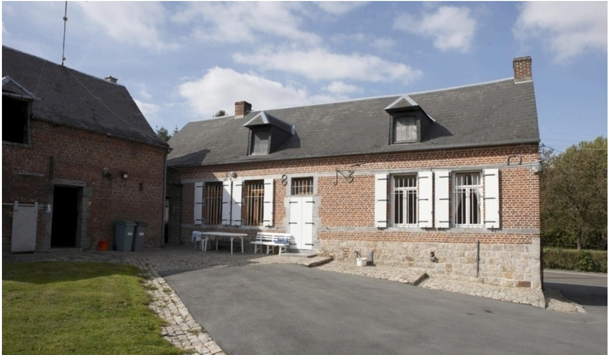
Vue du logis et vue partielle de l'étable attenante.