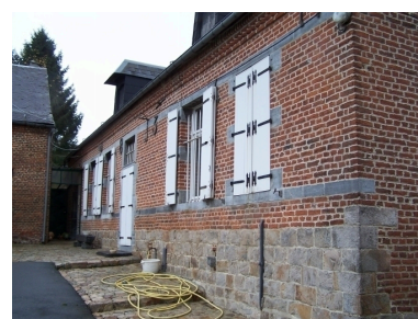
Vue du logis. IVR31_20085900568NUCA