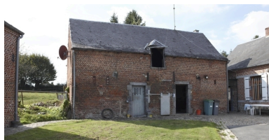
Vue générale de l'étable-fenil située à l'ouest.