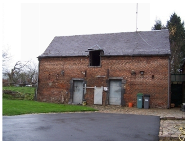
Vue de l'étable.