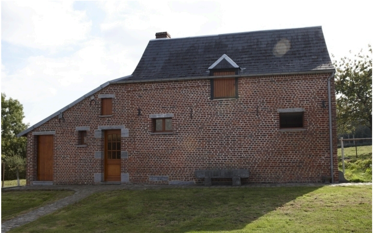
Vue d'une ancienne étable (?) située face au logis.