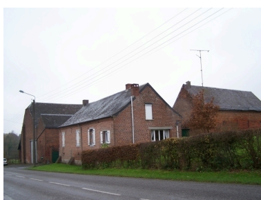
Vue générale de la ferme. IVR31_20085900567NUCA