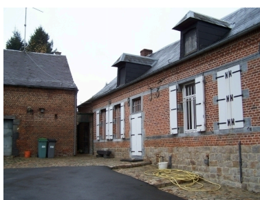
Vue du logis et d'une partie de l'étable. IVR31_20085900569NUCA