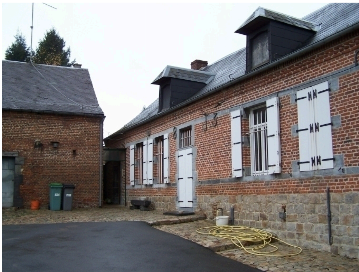
Vue du logis et d'une partie de l'étable.