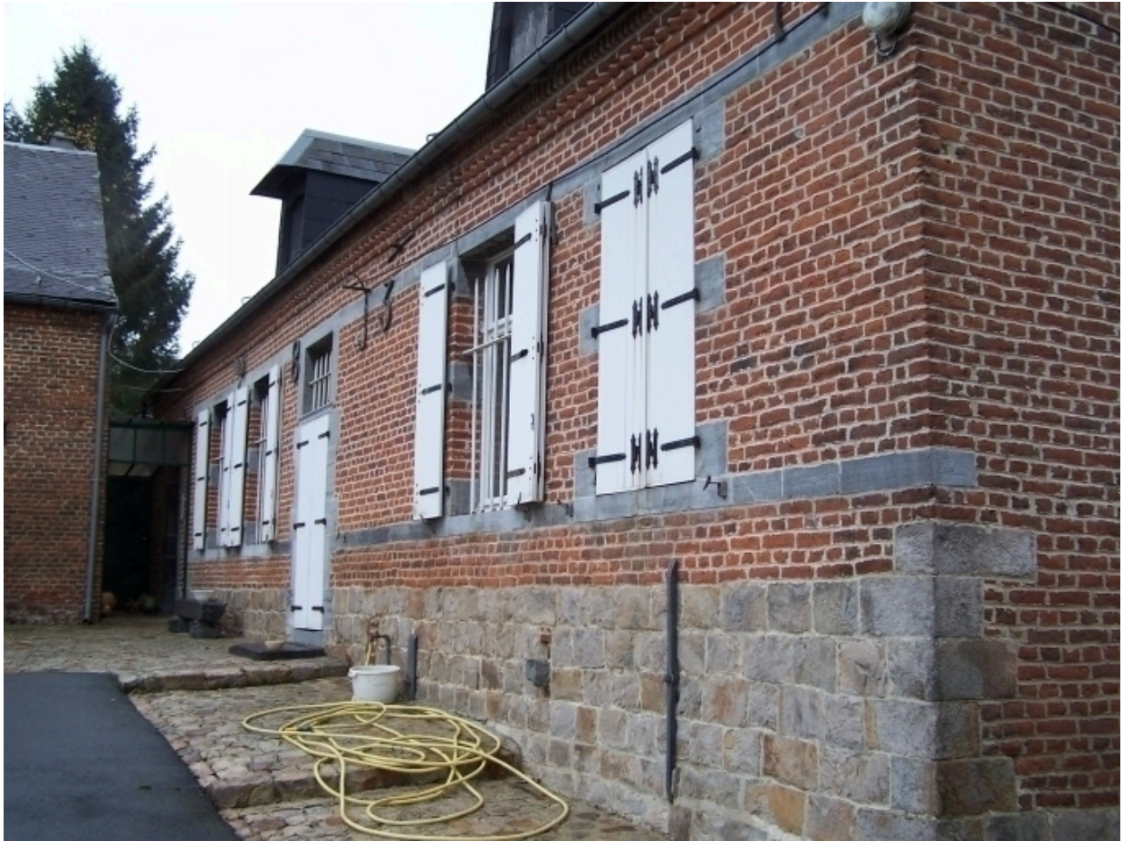
Vue du logis.