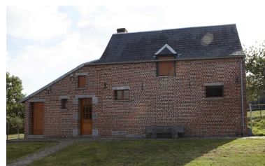
Vue d'une ancienne étable (?) située face au logis.