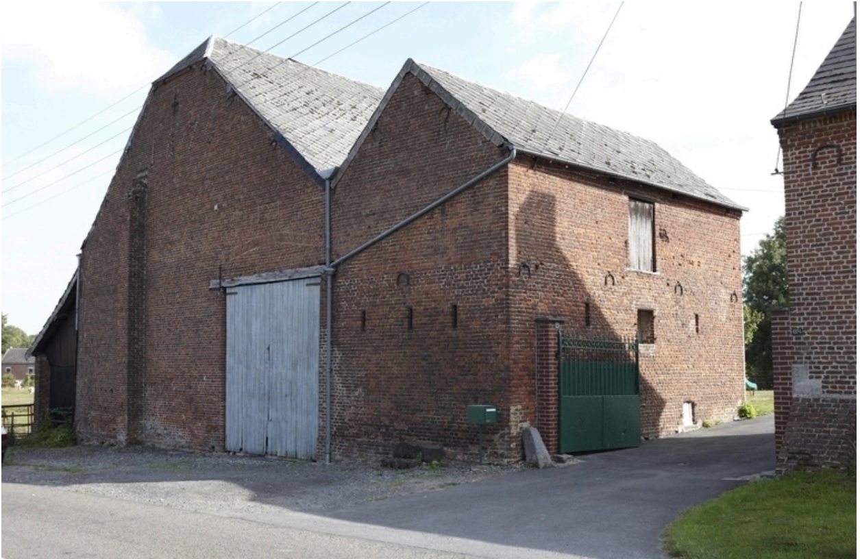
Vue de la grange et d'une remise depuis la voie.