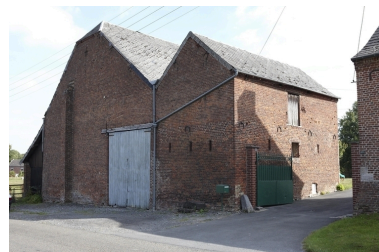
Vue de la grange et d'une remise depuis la voie.