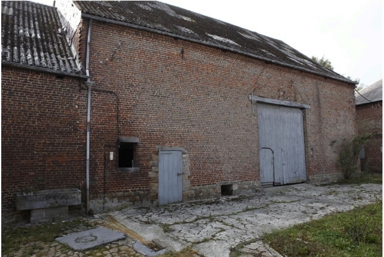
Vue de la grange.