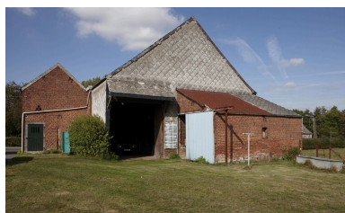
Vue de la grange et des remises qui lui sont accolées.