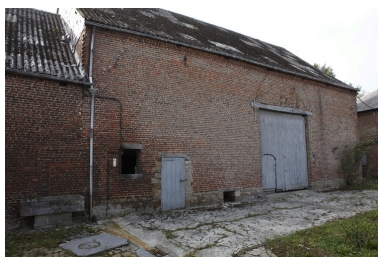
Vue de la grange. IVR31_20095903175NUCA