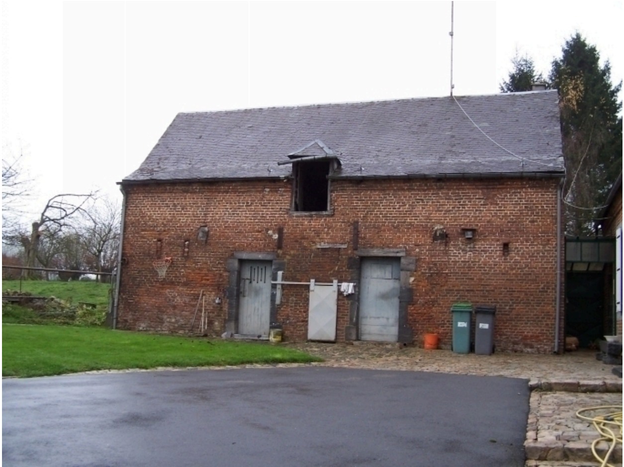
Vue de l'étable.