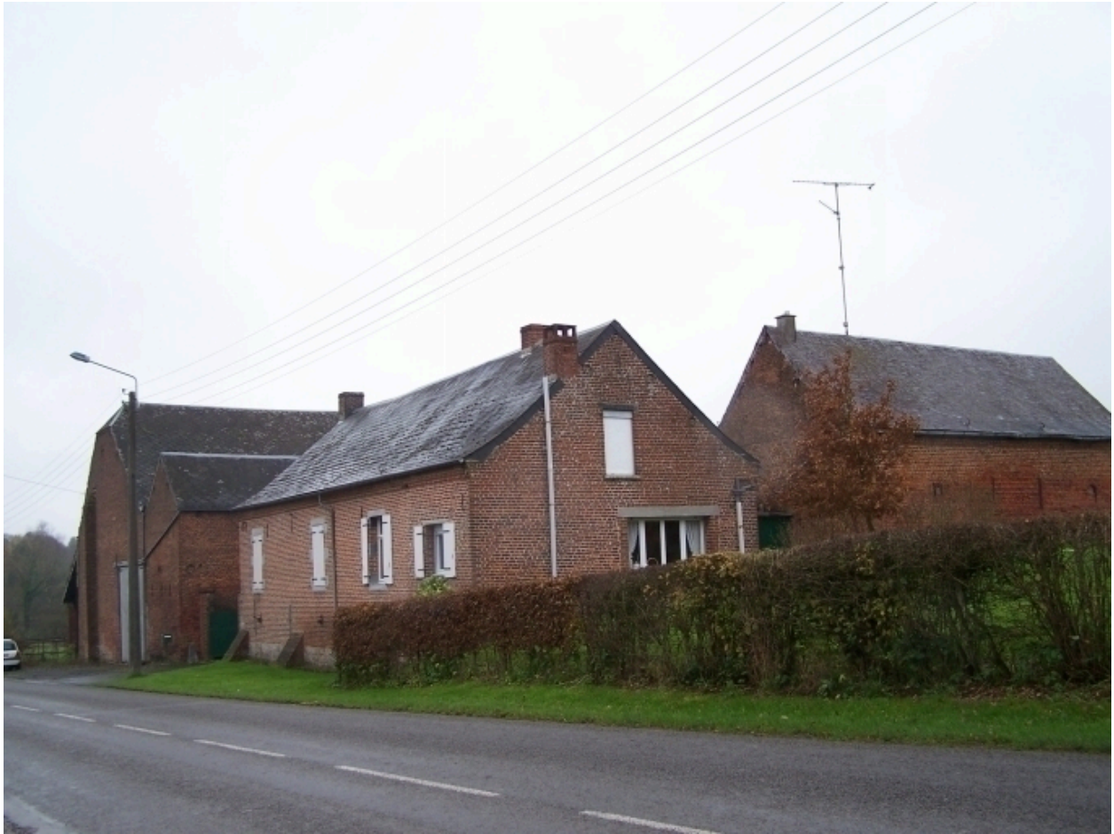
Vue générale de la ferme.