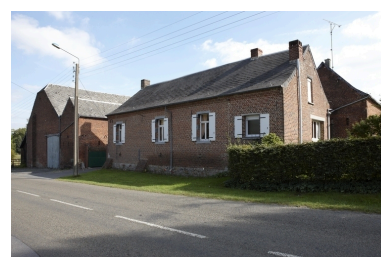
Vue générale de la ferme depuis la voie. IVR31_20095903177NUCA