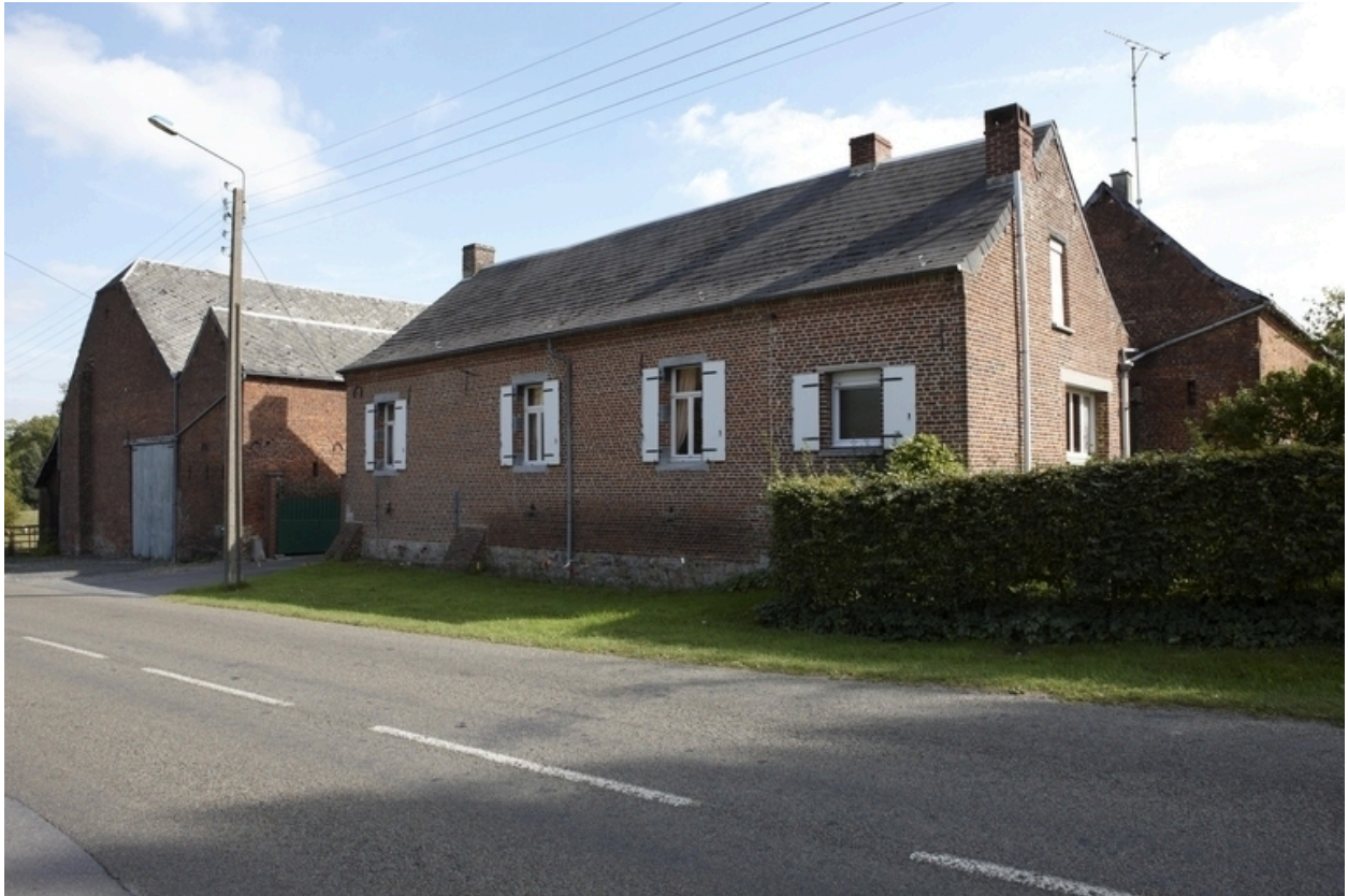
Vue générale de la ferme depuis la voie.