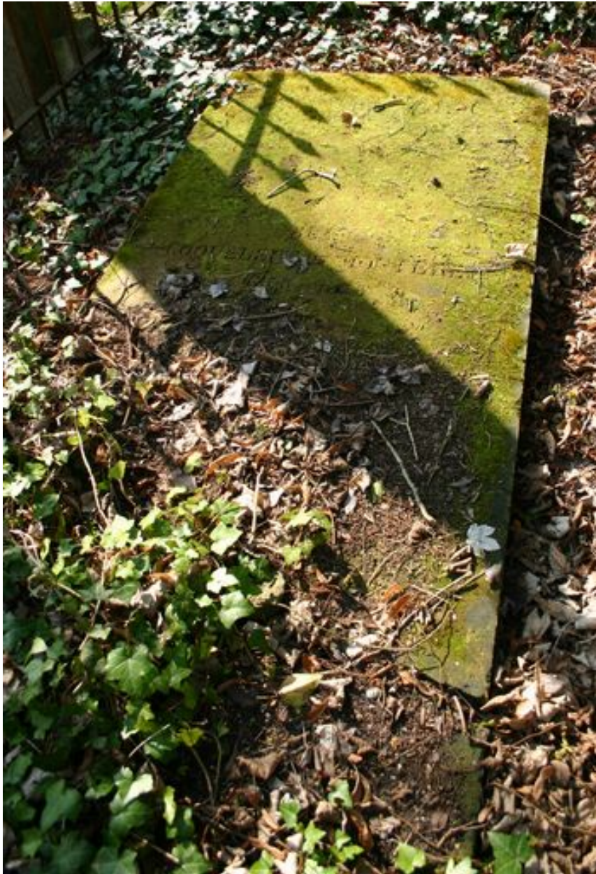
Dalle funéraire rectangulaire, vers 1828.