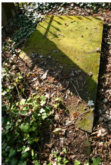
Dalle funéraire rectangulaire, vers 1828.