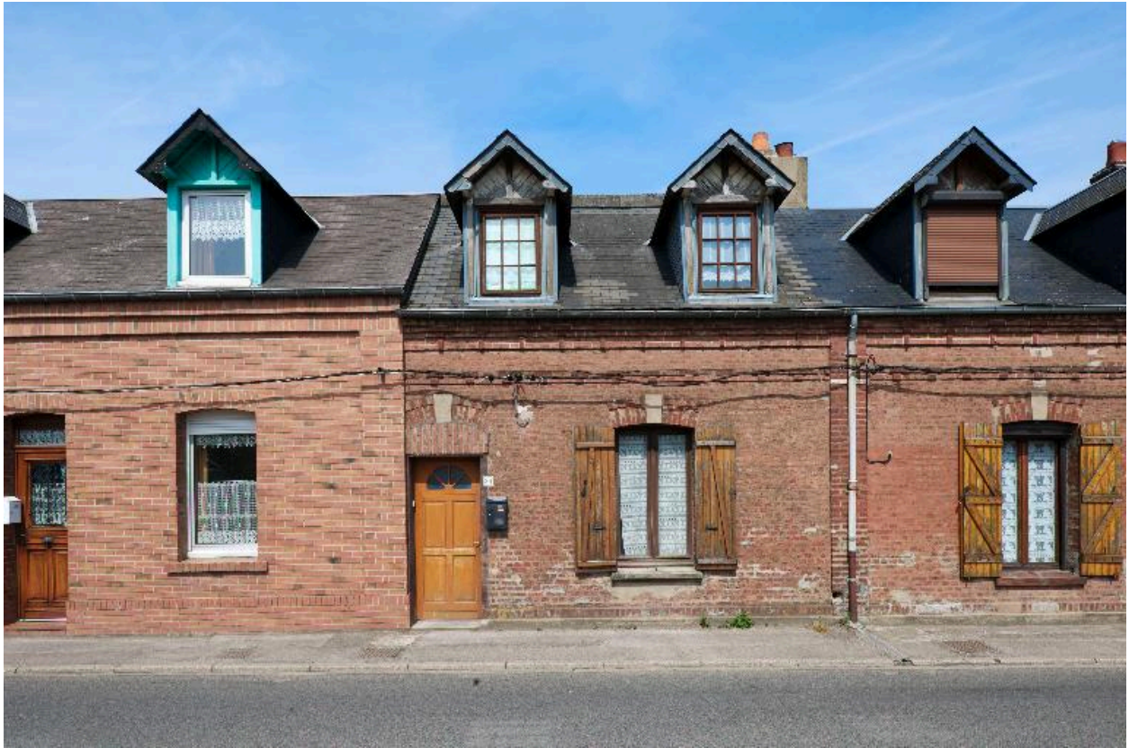
Vue d'un logement d'ouvrier.