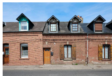
Vue d'un logement d'ouvrier.