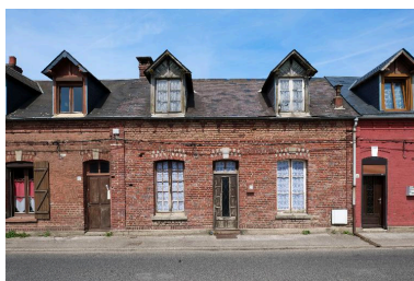
Vue d'un logement de contremaître ou d'ouvrier qualifié.