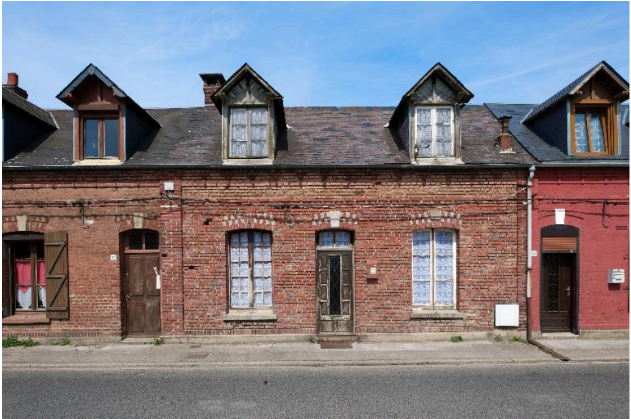
Vue d'un logement de contremaître ou d'ouvrier qualifié.