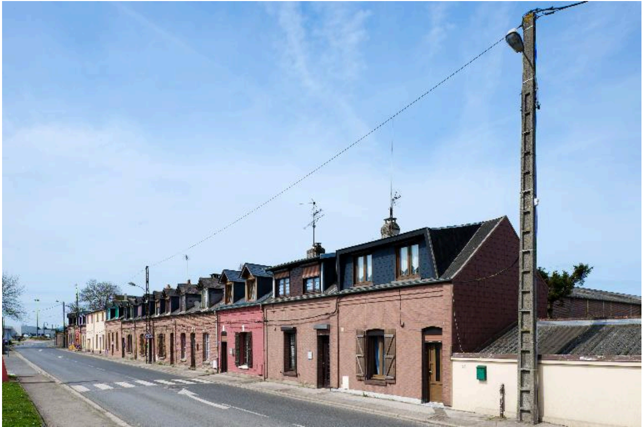
Vue générale depuis la rue Victor-Hugo.