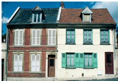
Elévation antérieure.