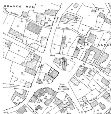
Plan de situation. Extrait du plan cadastral de 1986, section C. IVR22_20080290107NUCA