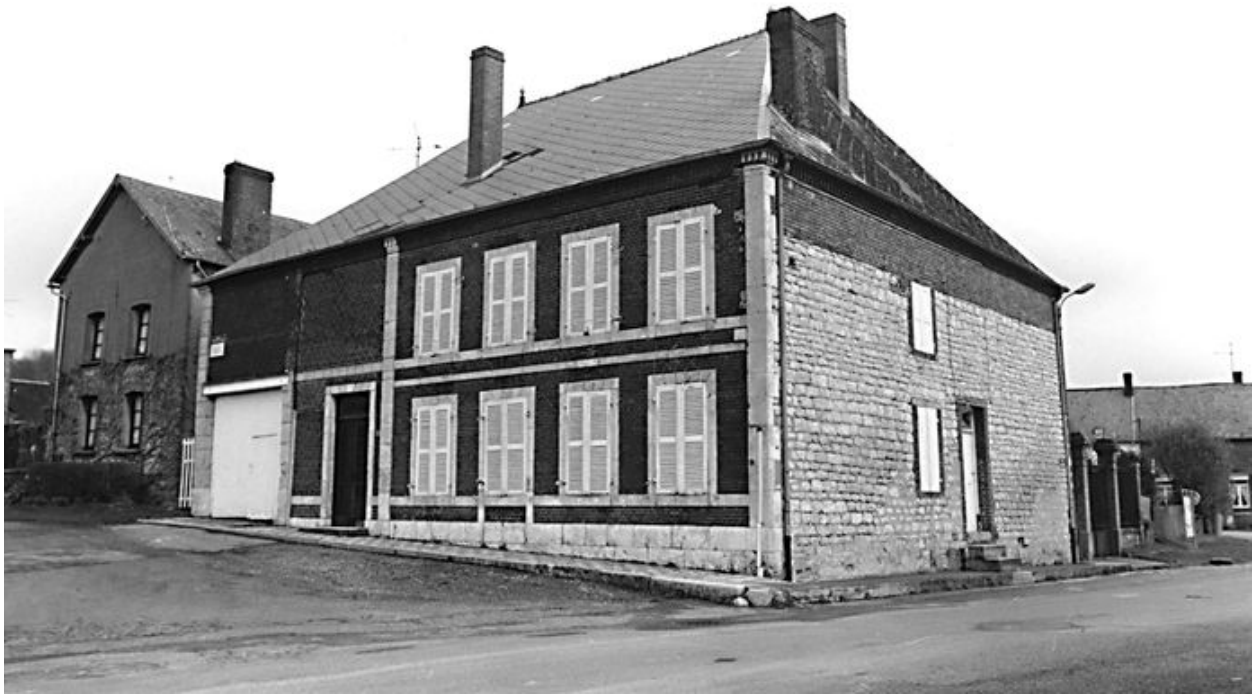
Vue générale depuis le sud-est, avant restauration.