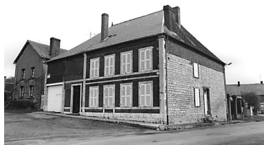
Vue générale depuis le sud-est, avant restauration. IVR22_19980200776Z