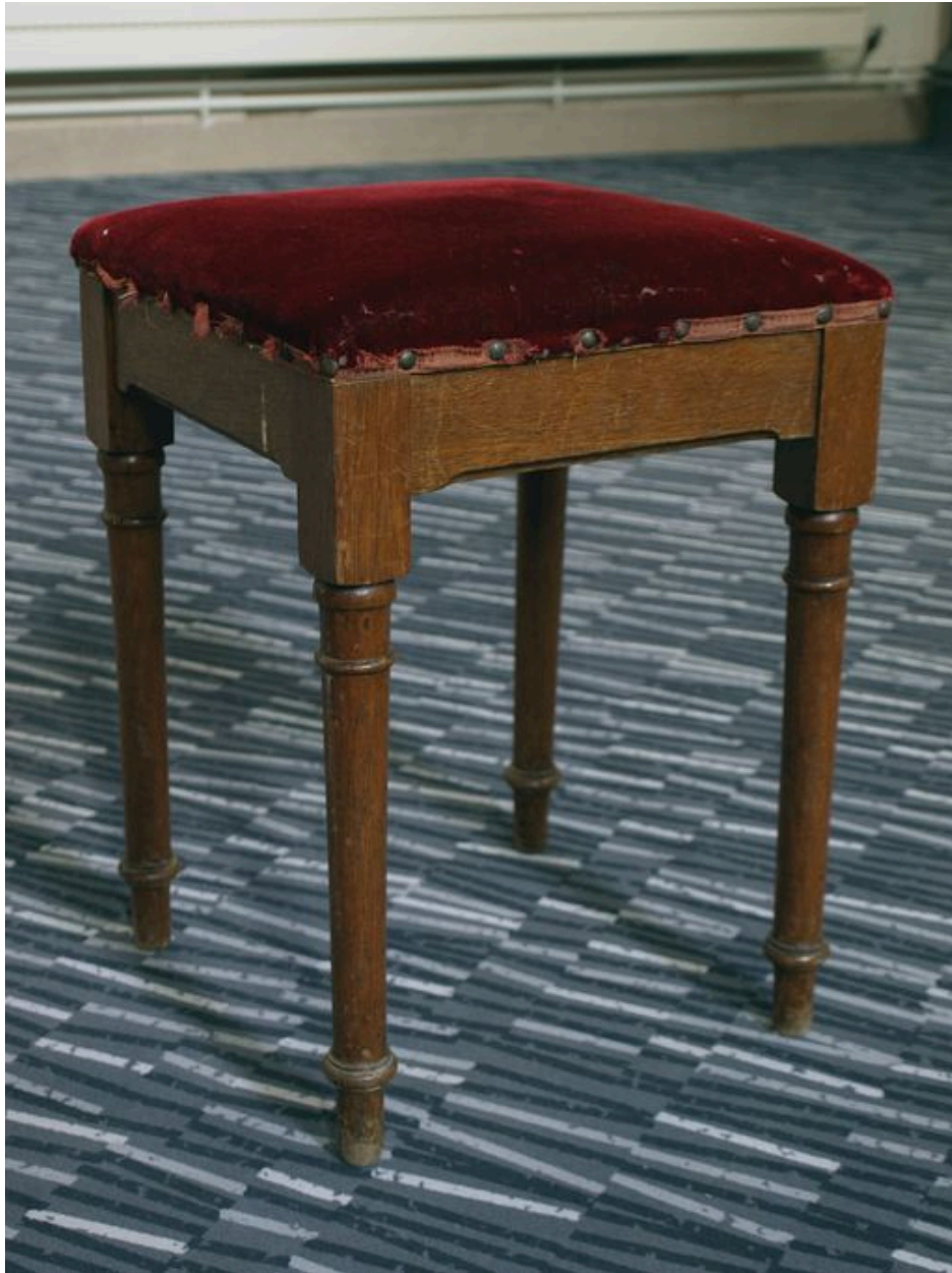
Tabouret : vue générale