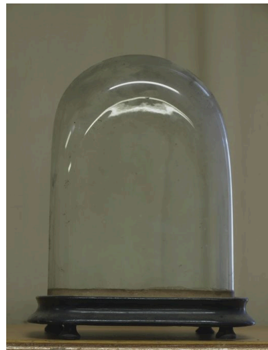
Objet de dévotion sous globe, non identifié, dont seul subsiste le globe