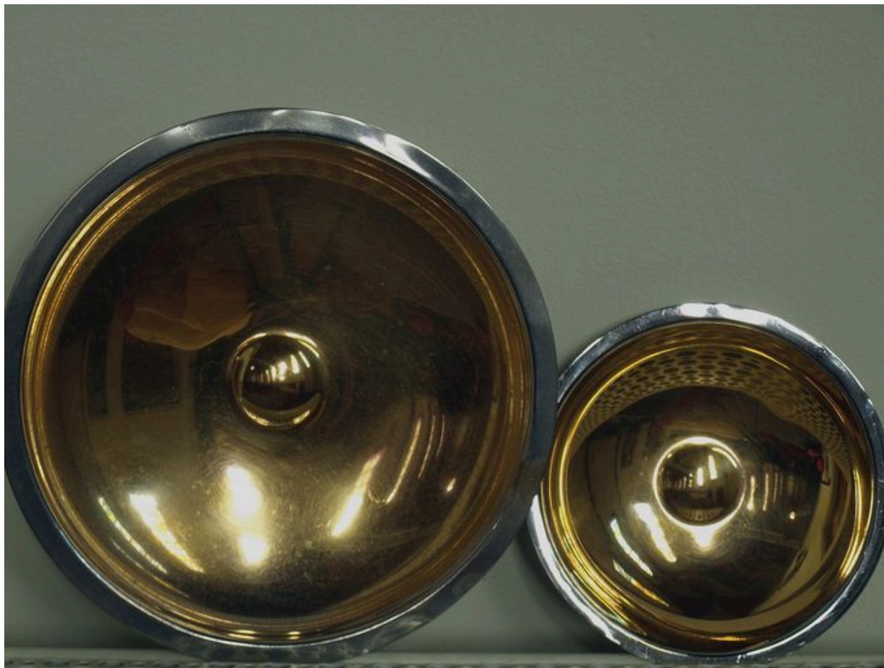
Deux plateaux ou plats à quêter