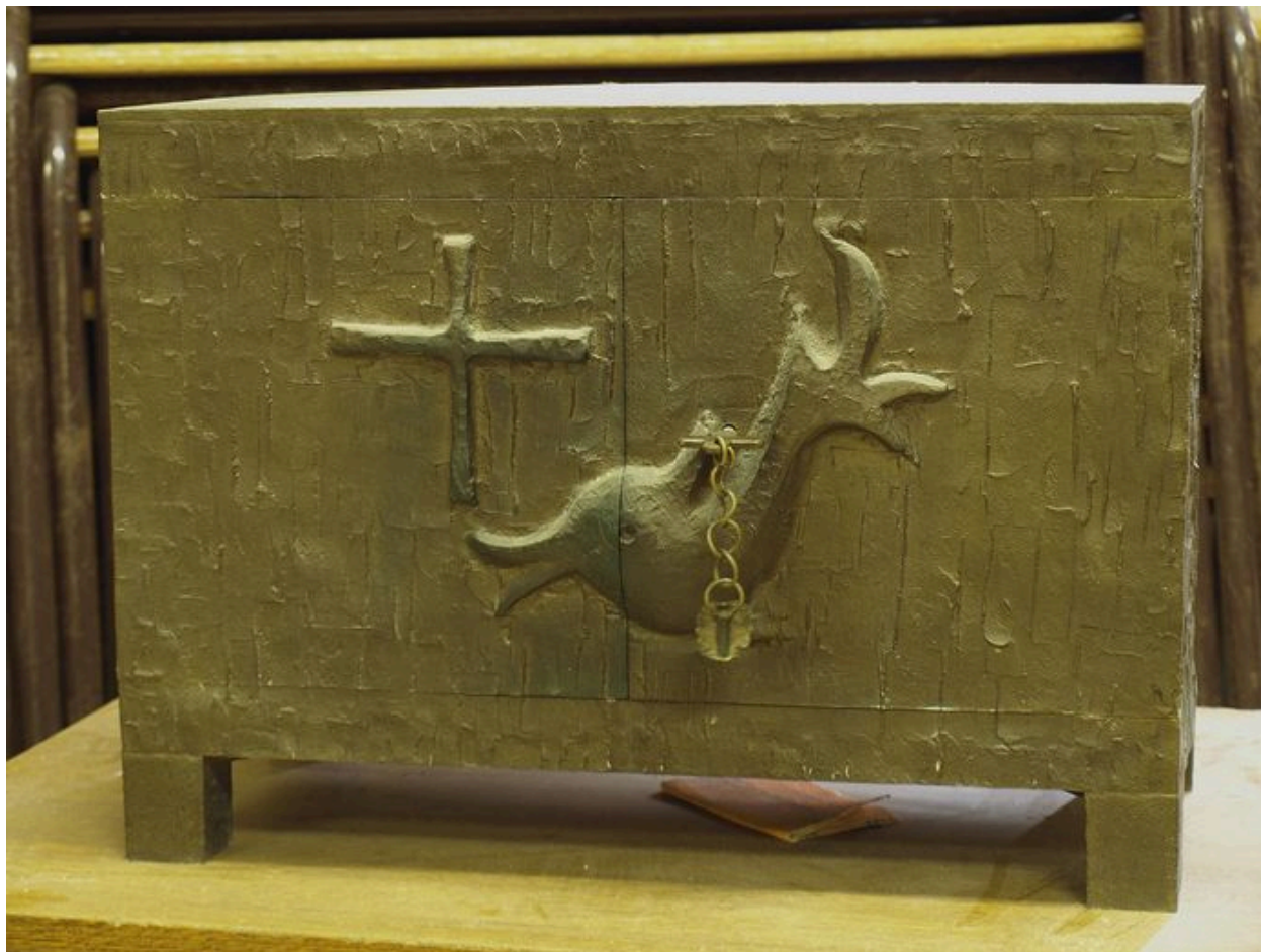
Tabernacle en métal doré : vue générale