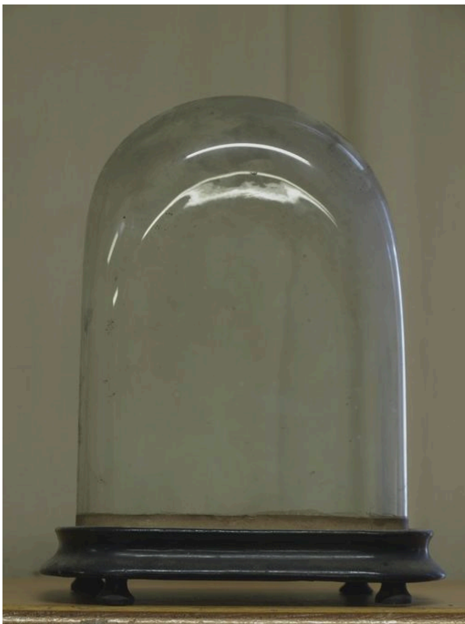
Objet de dévotion sous globe, non identifié, dont seul subsiste le globe