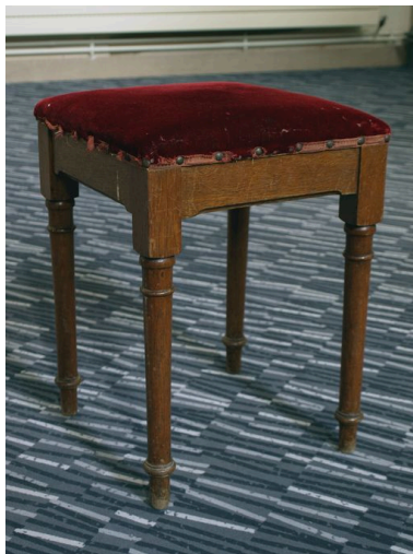
Tabouret : vue générale IVR31_20106204655NUCA