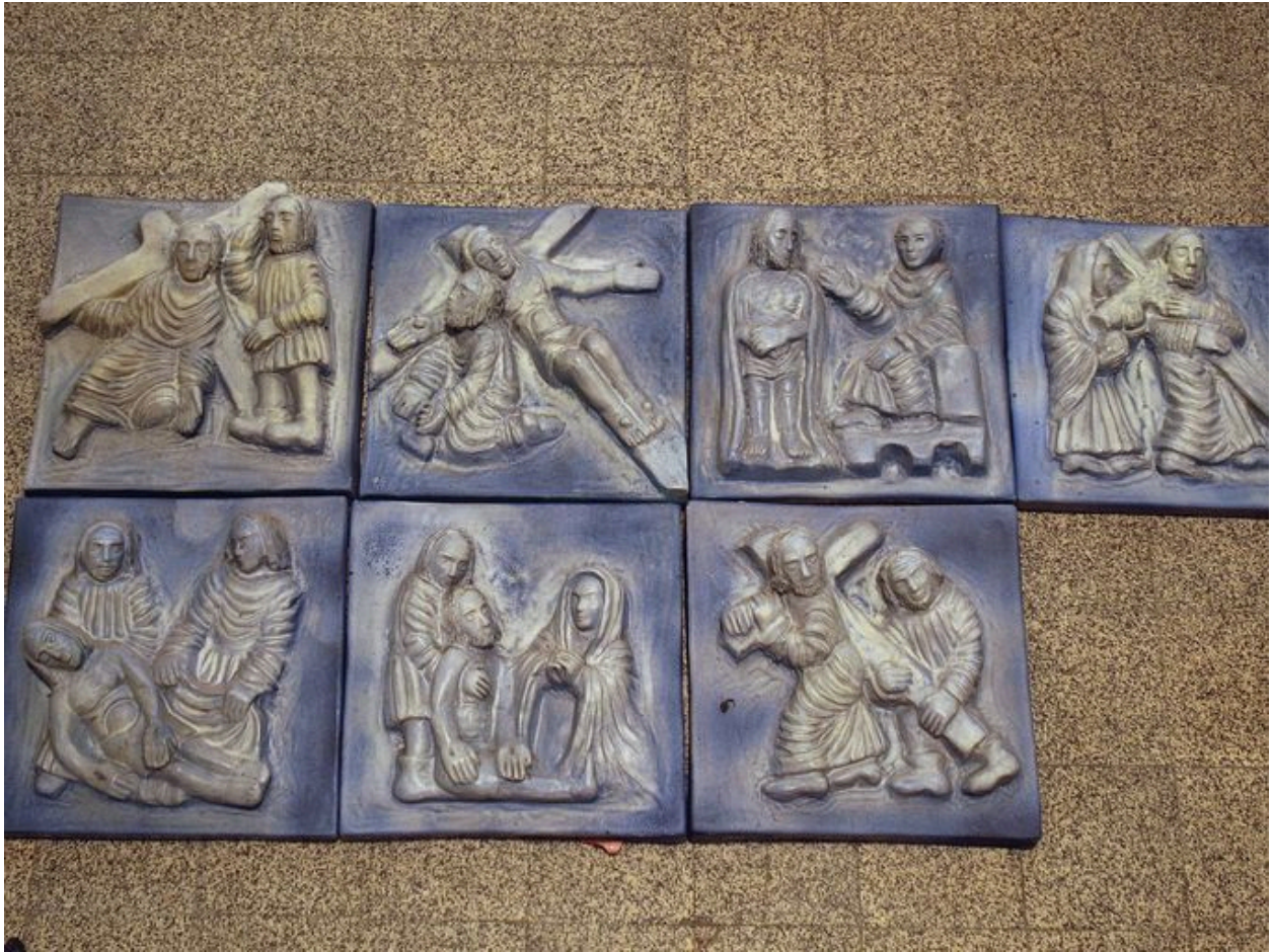
Chemin de croix, en plâtre