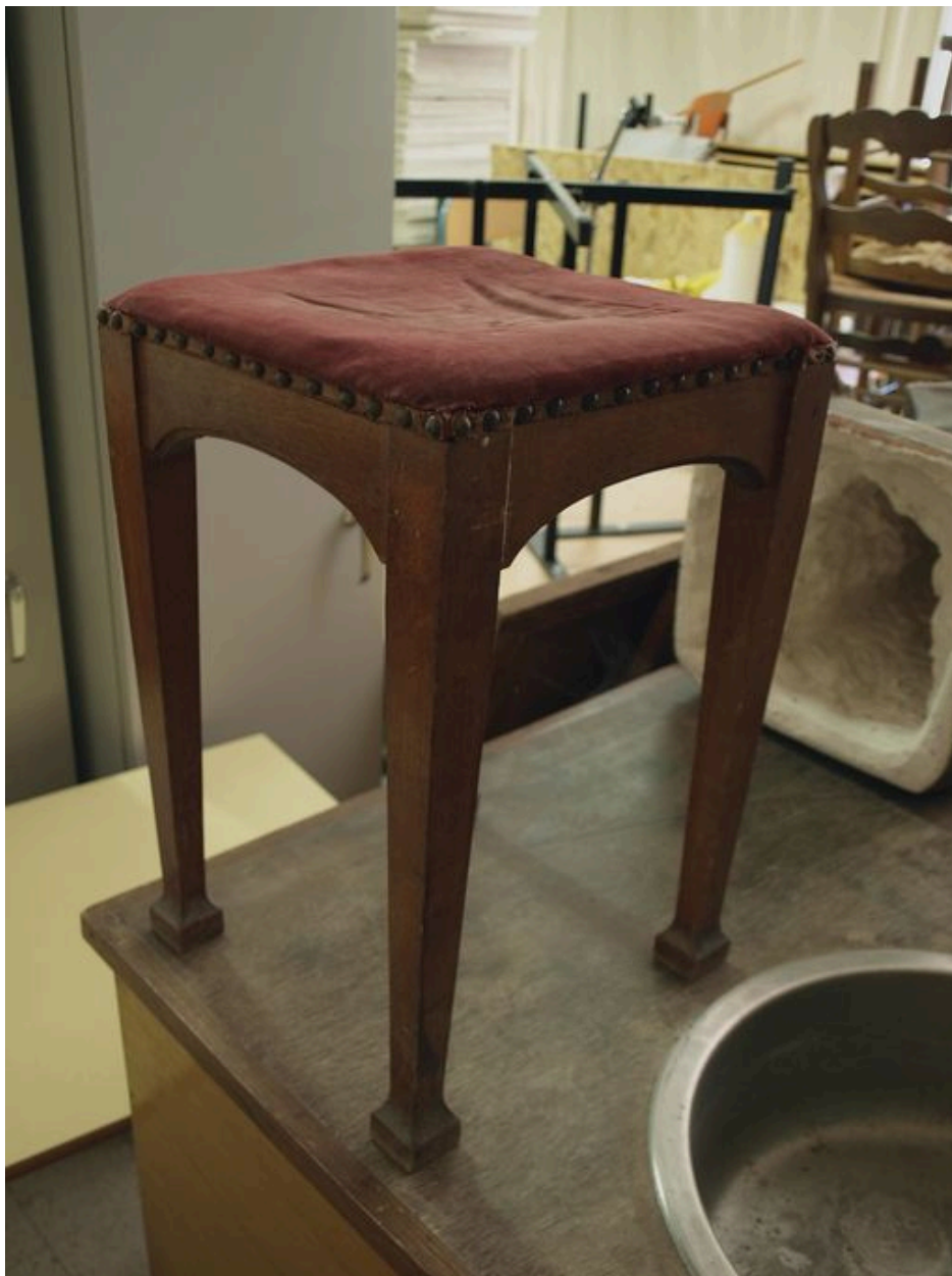
Tabouret : vue générale