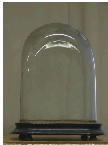
Objet de dévotion sous globe, non identifié, dont seul subsiste le globe IVR31_20106204658NUCA