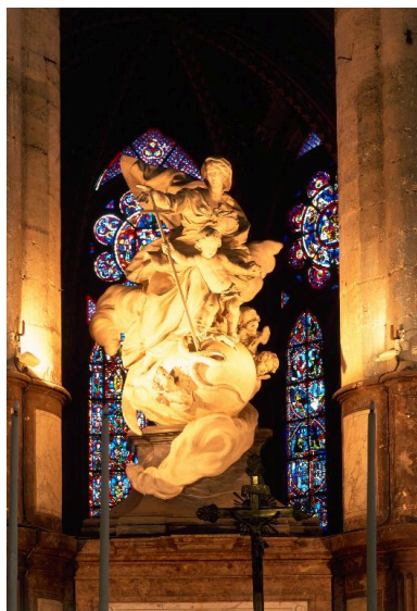
Vue de face. IVR22_19966003803XA