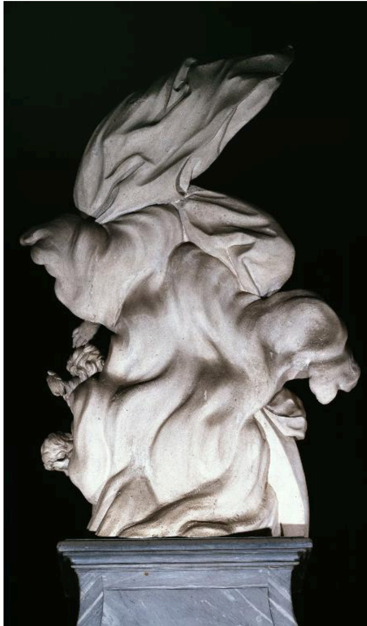
Vue du revers.