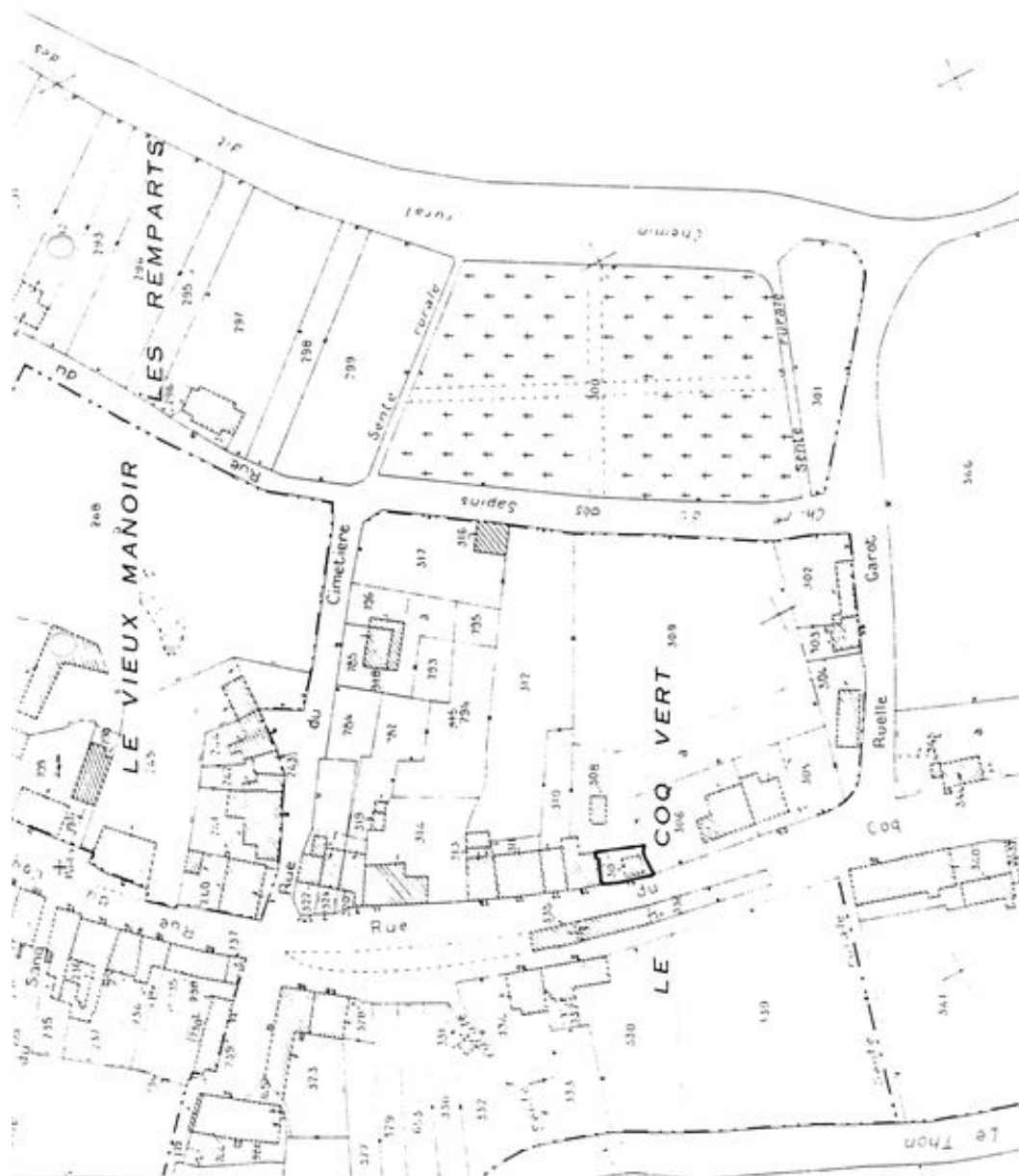
Plan de situation. Extrait du plan cadastral de 1986, section B.