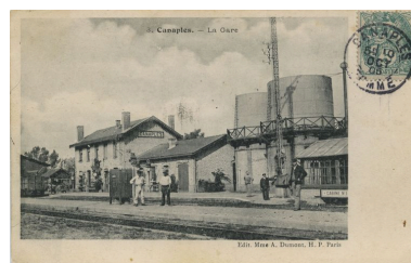
La gare avec les voies, les quais et les réservoirs d'eau, avant 1905. IVR22_20098000334NUCA