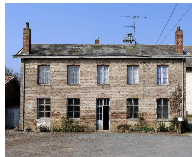
Vue du bâtiment principal. IVR22_20128000136NUC2A