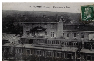
Vue des trains en gare, vers 1920.