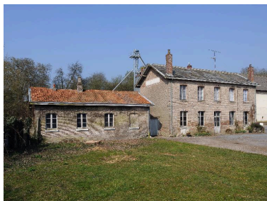
Vue générale. IVR22_20128000137NUC2A