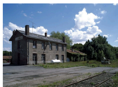
Vue générale de l'ancienne gare et des voies ferrées désaffectées. IVR22_20098000213XA