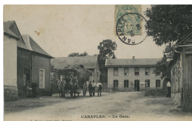
Vue générale depuis la rue, avant 1906 (coll. part.). IVR22_20098000332NUCA