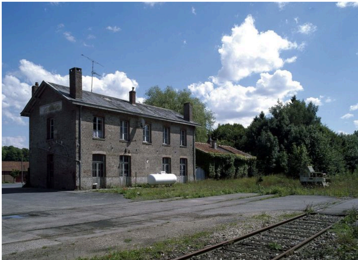
Vue générale de l'ancienne gare et des voies ferrées désaffectées.