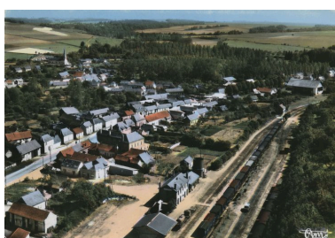
Vue aérienne de la gare et des voies ferrées, vers 1960.