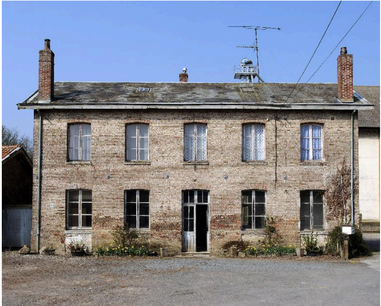
Vue du bâtiment principal.