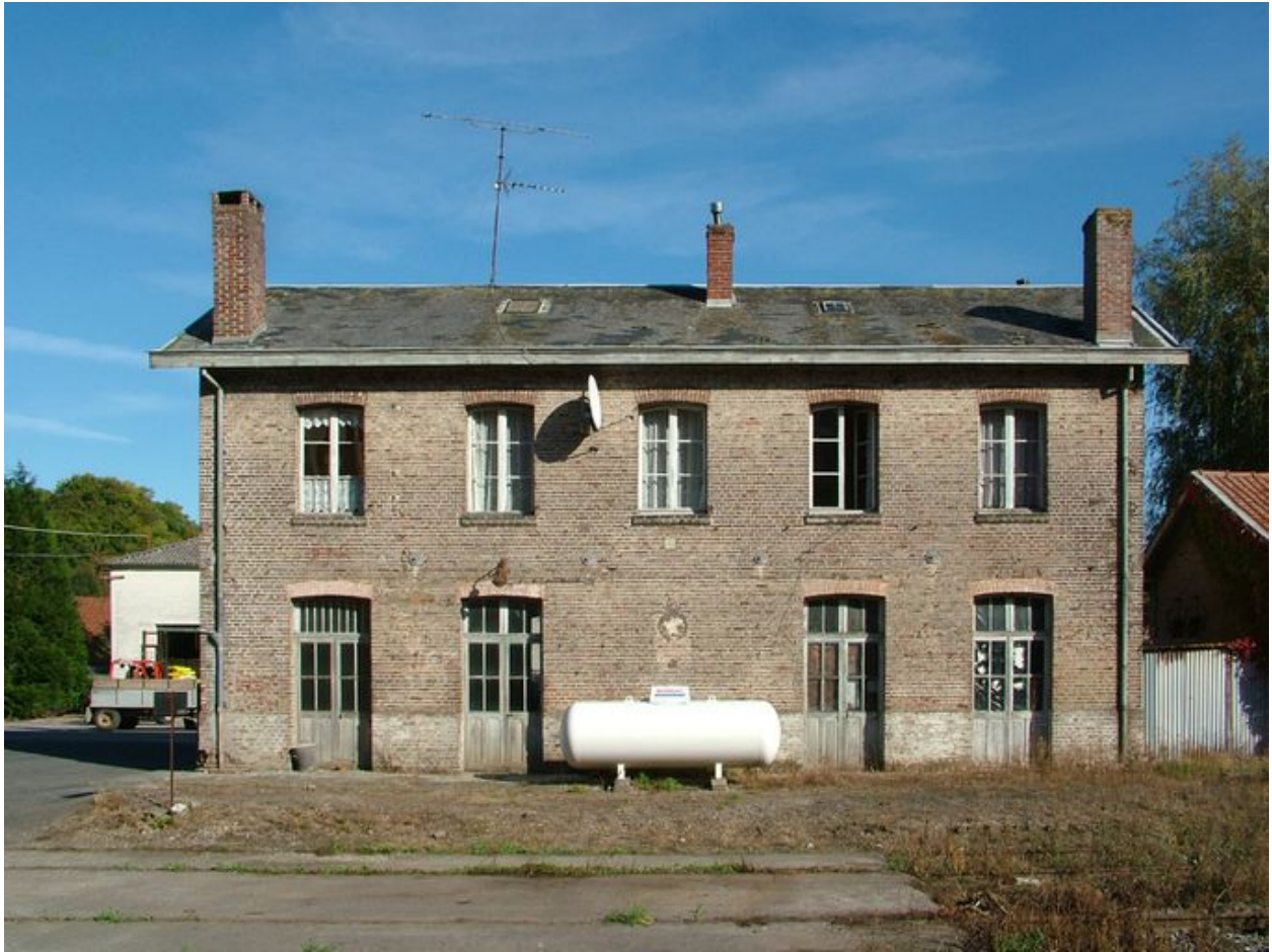
Vue du bâtiment principal de l'ancienne gare depuis les voies ferrées.