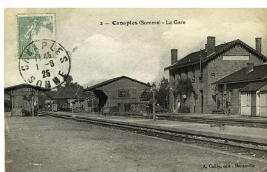
Vue depuis les voies, avant 1925 (coll. part.). IVR22_20098000387NUCA