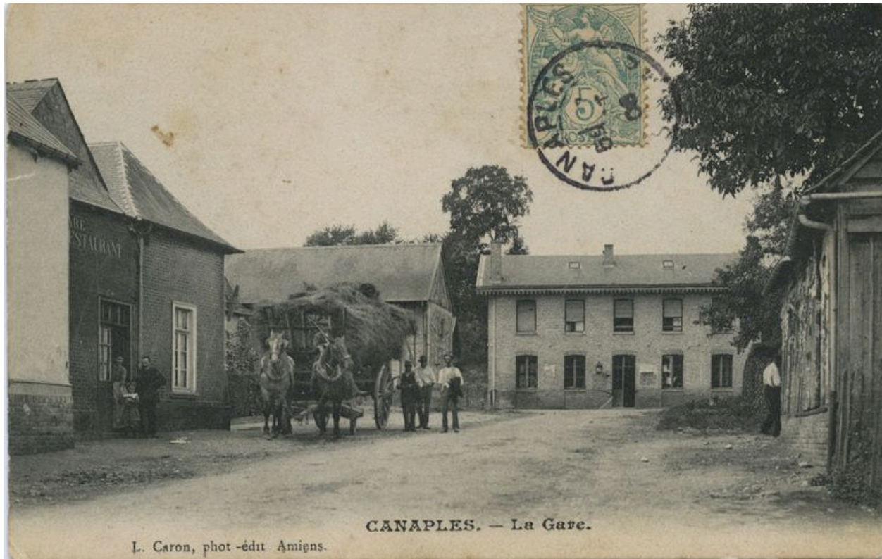
Vue générale depuis la rue, avant 1906.