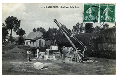
Chargement de blocs de pierre, avant 1908 (coll. part.). IVR22_20098000386NUCA