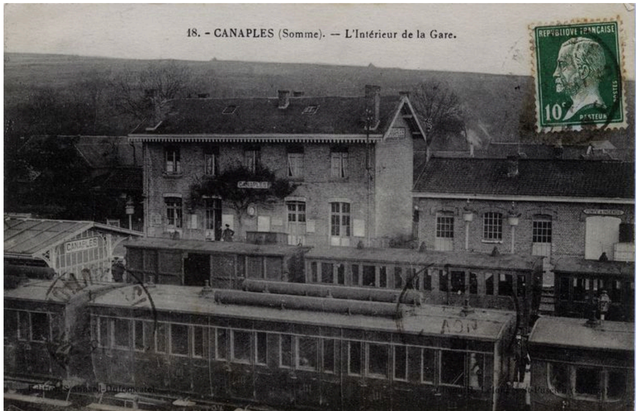
Vue des trains en gare, vers 1920 (coll. part.).