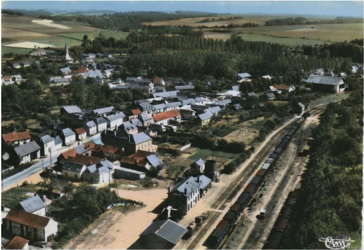
Vue aérienne de la gare et des voies ferrées, vers 1960.