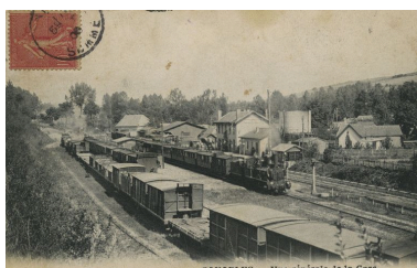
Vue générale depuis les voies, avant 1908 (coll. part.). IVR22_20098000333NUCA