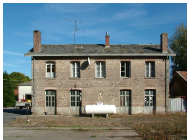
Vue du bâtiment principal de l'ancienne gare depuis les voies ferrées.