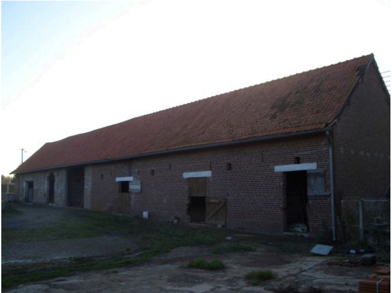
Vue des étables et écuries depuis la cour.