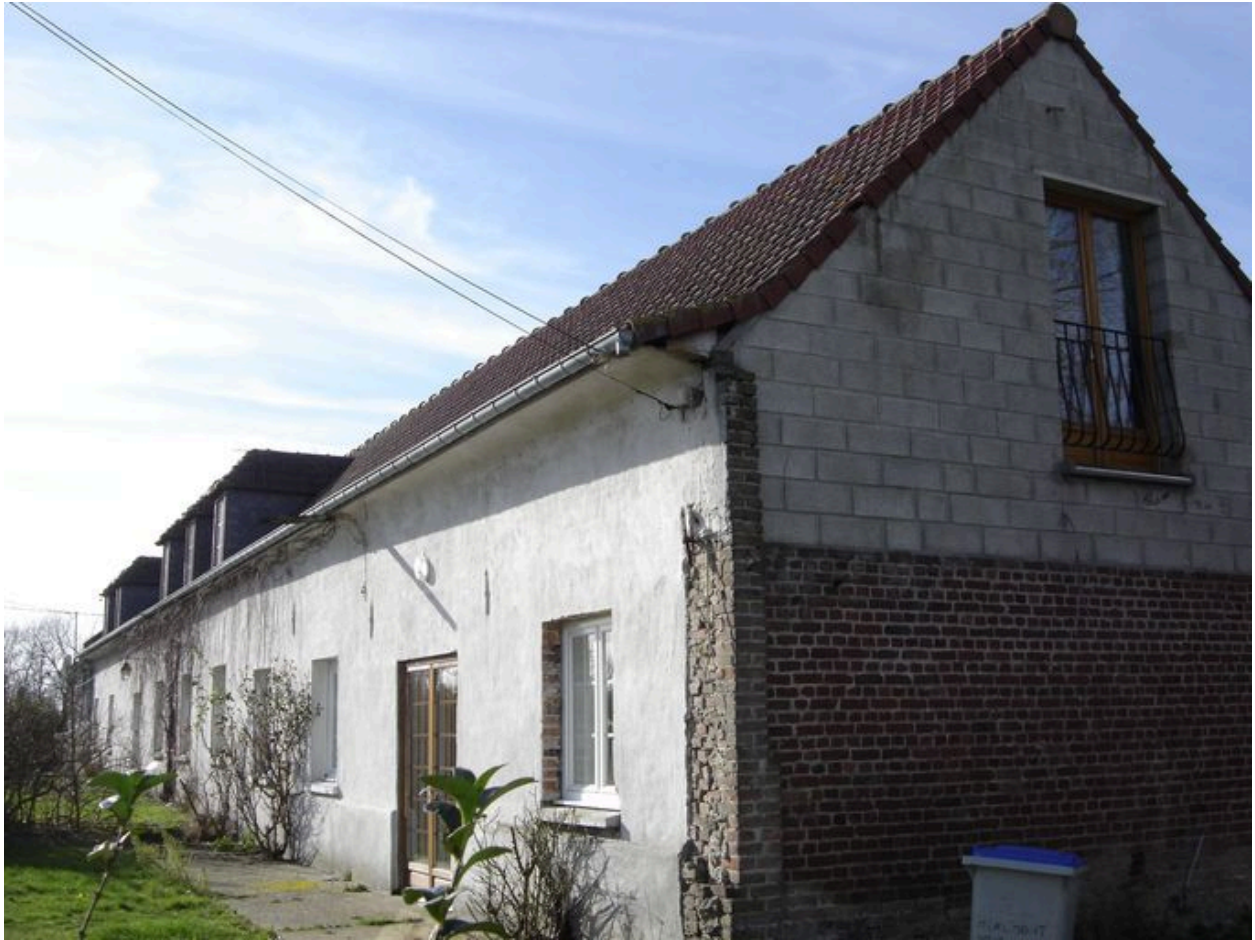
Vue de la façade du logis.