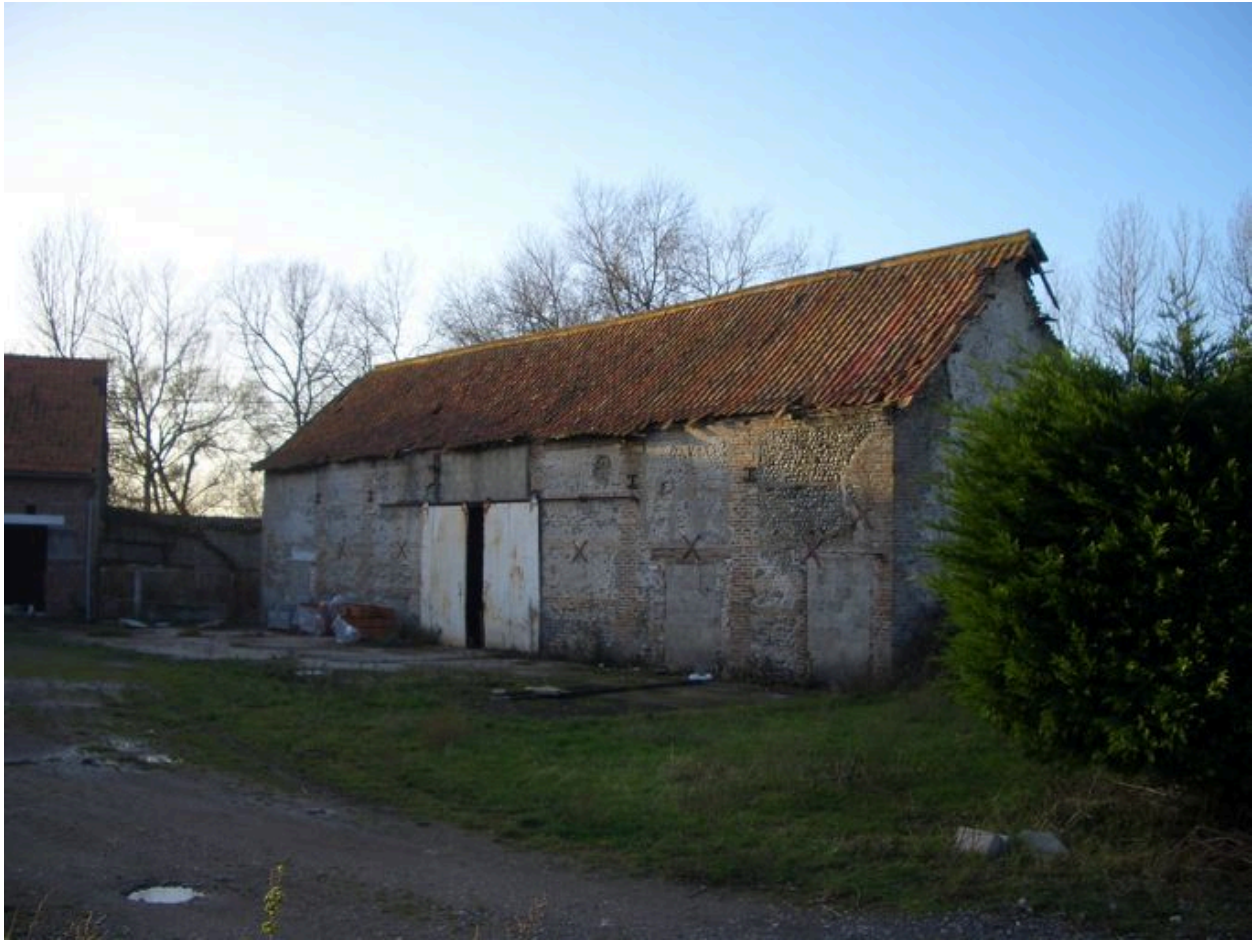
Vue de la grange.