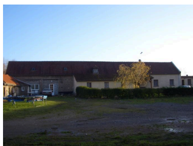
Vue postérieure du logis.