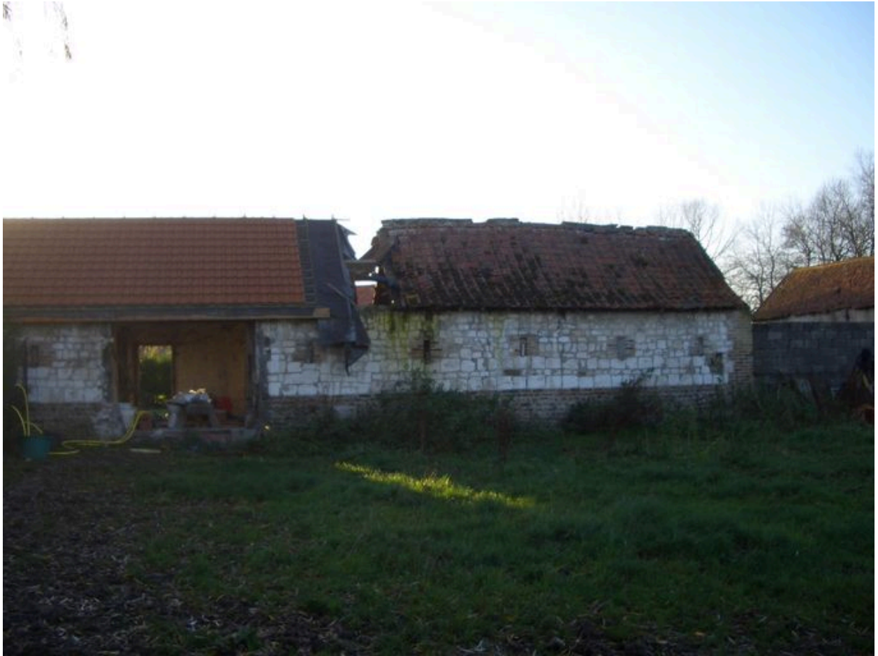
Vue postérieure des porcheries.