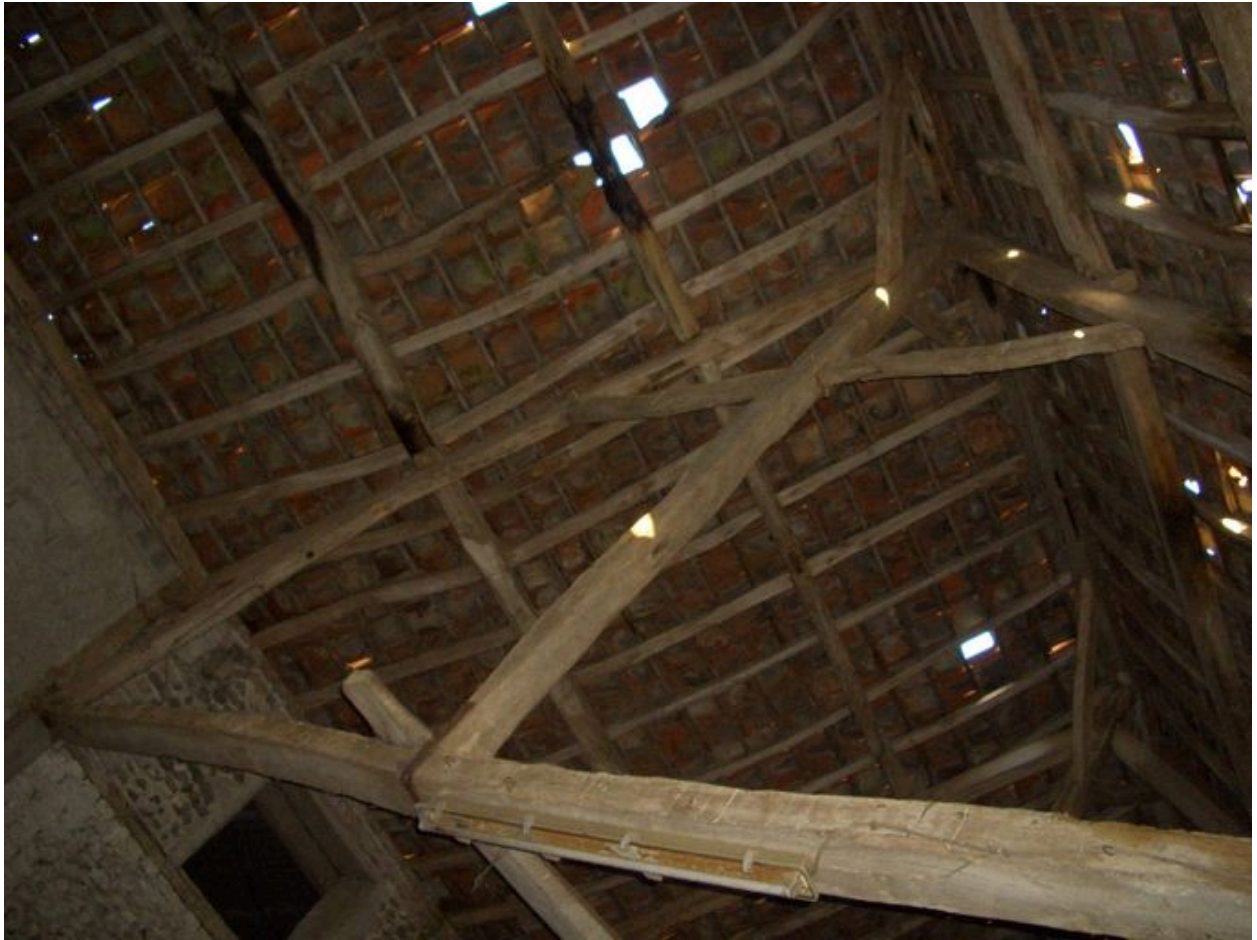
Vue d'une ferme de la grange.