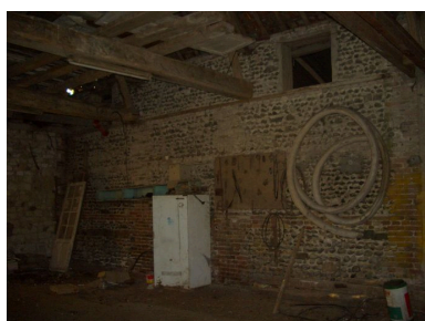
Vue intérieure.