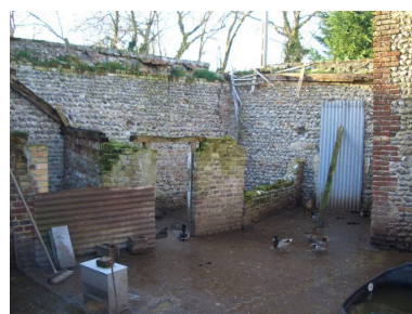
Vue de la cour du poulailler.