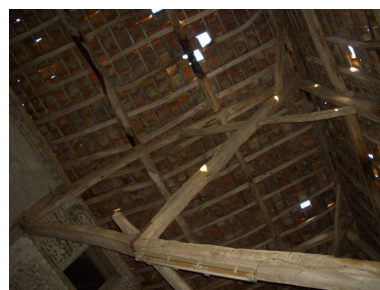
Vue d'une ferme de la grange. IVR22_20068005654NUCA