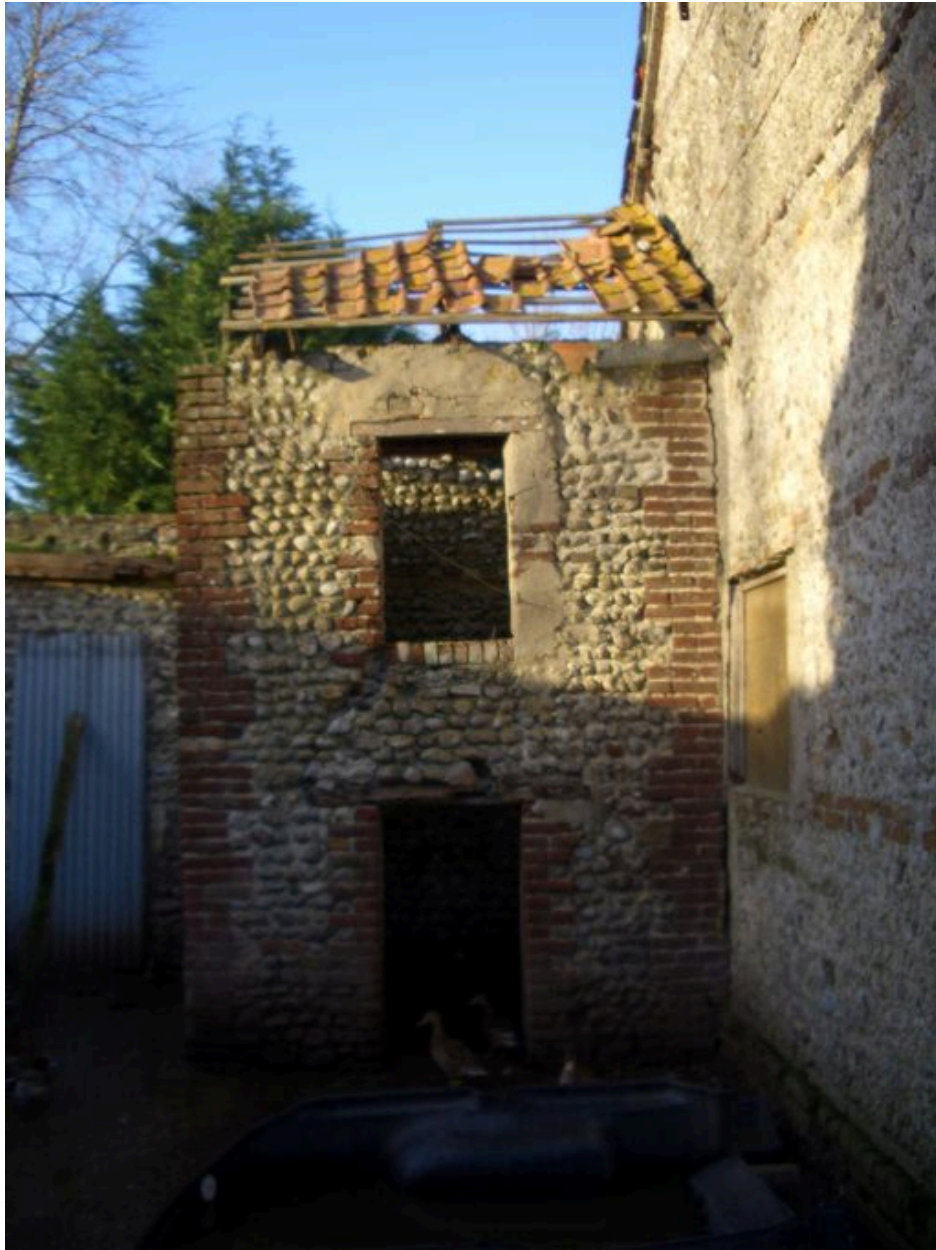
Vue du poulailler accolé à la grange.