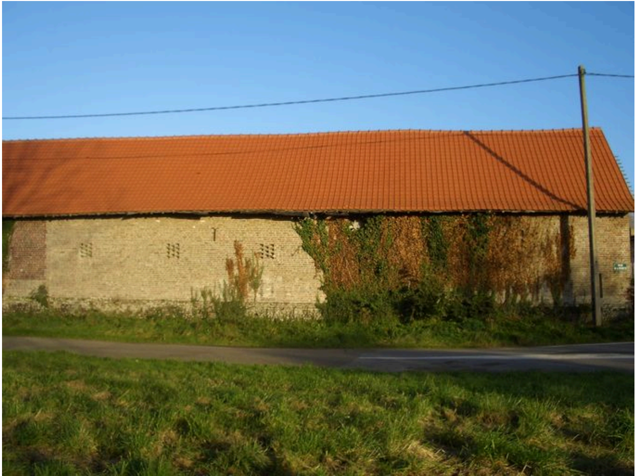
Vue depuis la rue de ce bâtiment.