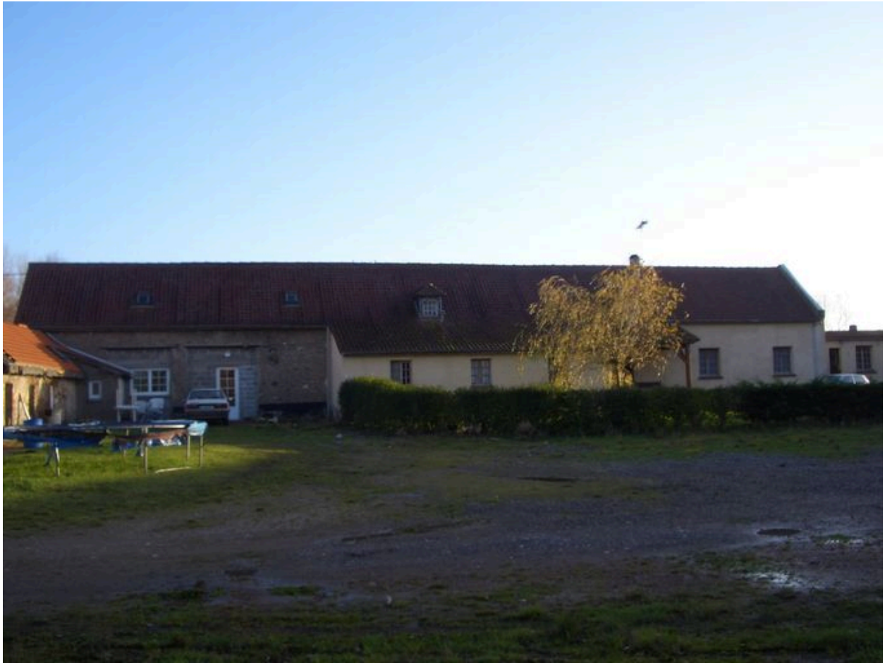
Vue postérieure du logis.