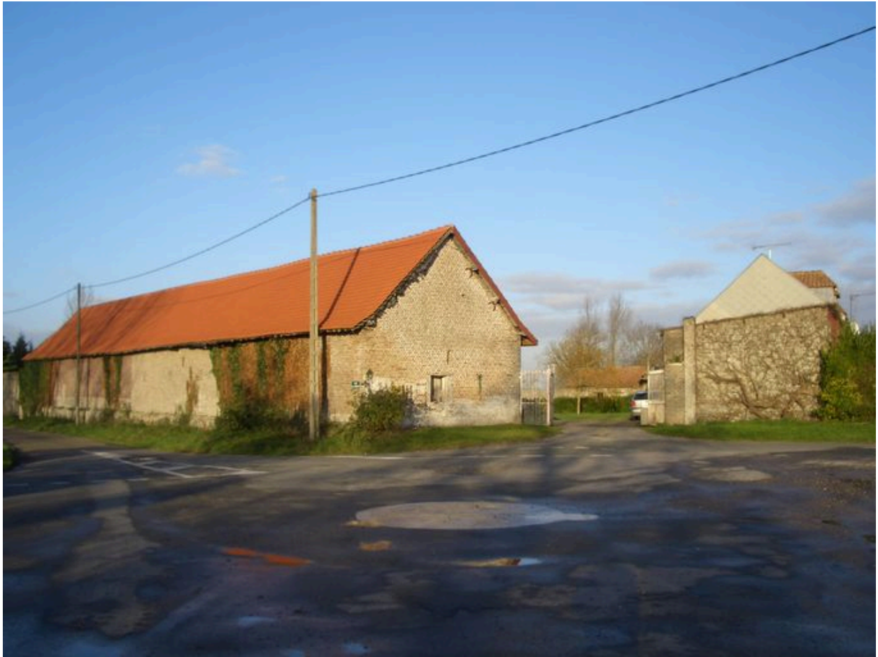
Vue générale depuis la rue.