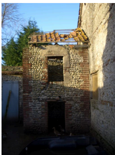
Vue du poulailler accolé à la grange.