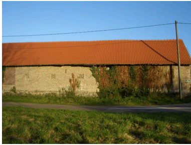
Vue depuis la rue de ce bâtiment. IVR22_20068005661NUCA