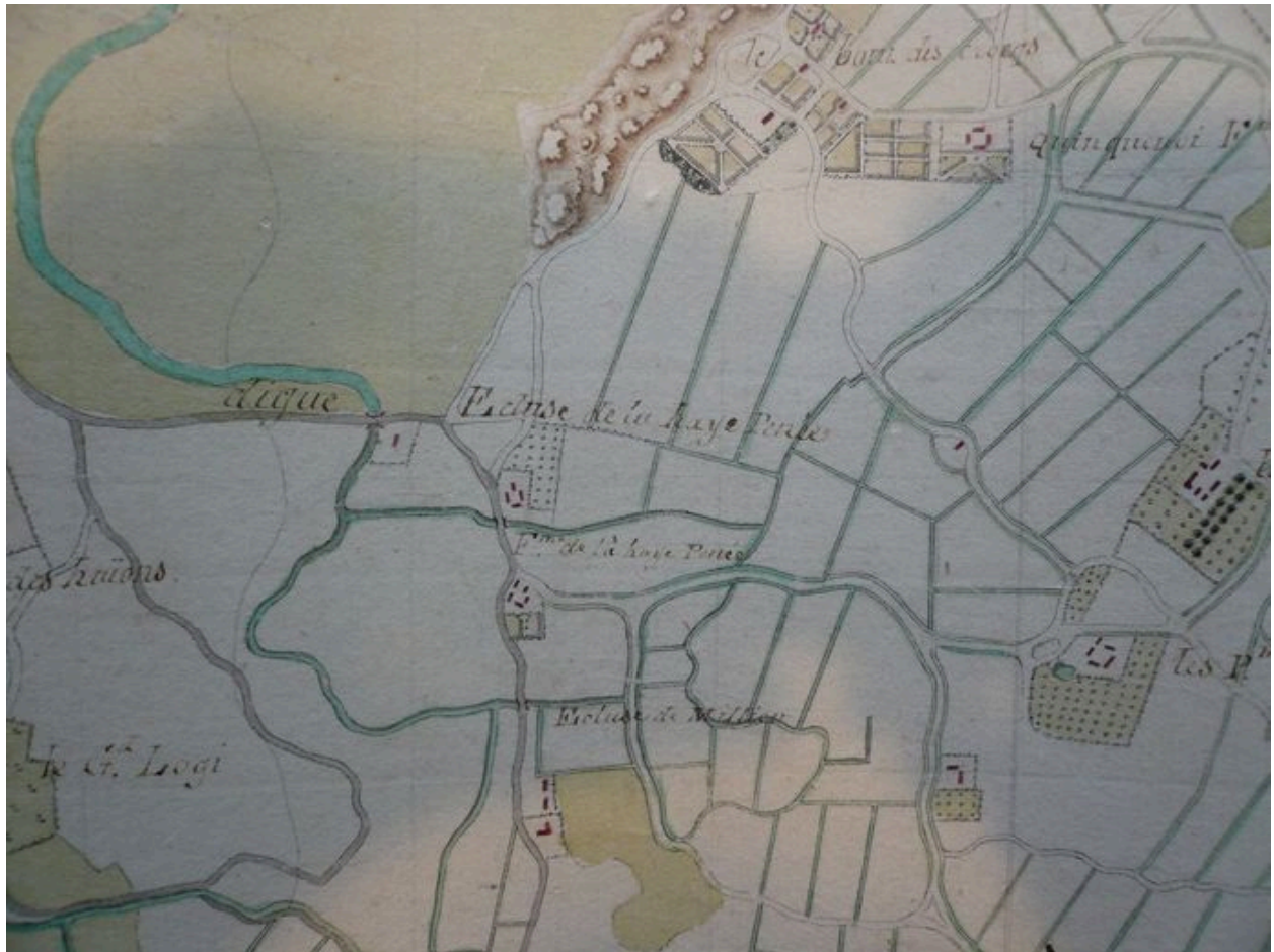
Plan des fermes composant le hameau de la Haie Penée au 18e siècle.