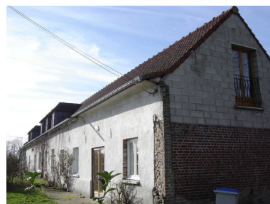
Vue de la façade du logis. IVR22_20078005380NUCA