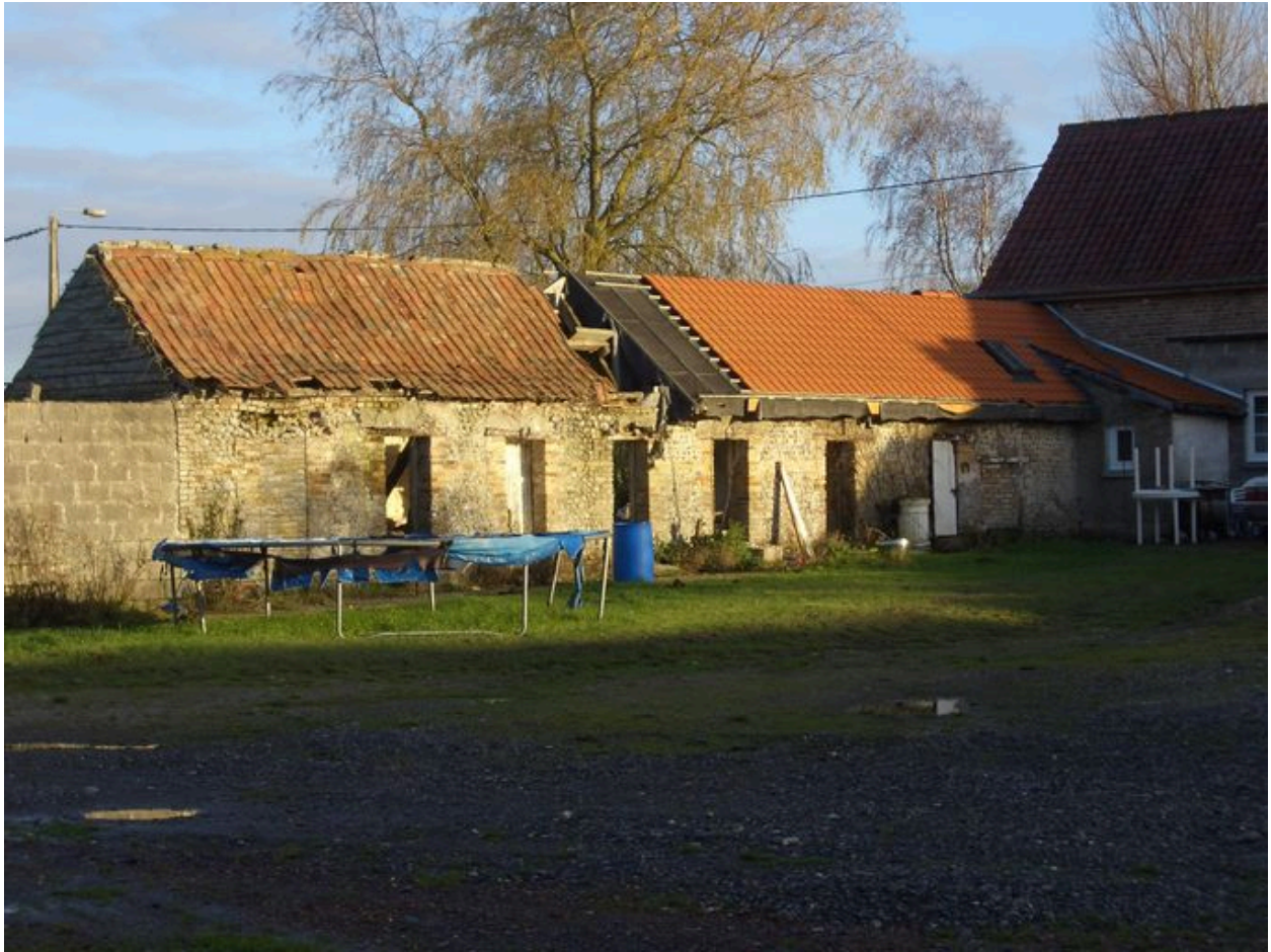
Vue des étables à cochons depuis la cour.