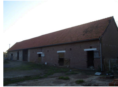
Vue des étables et écuries depuis la cour. IVR22_20068005660NUCA