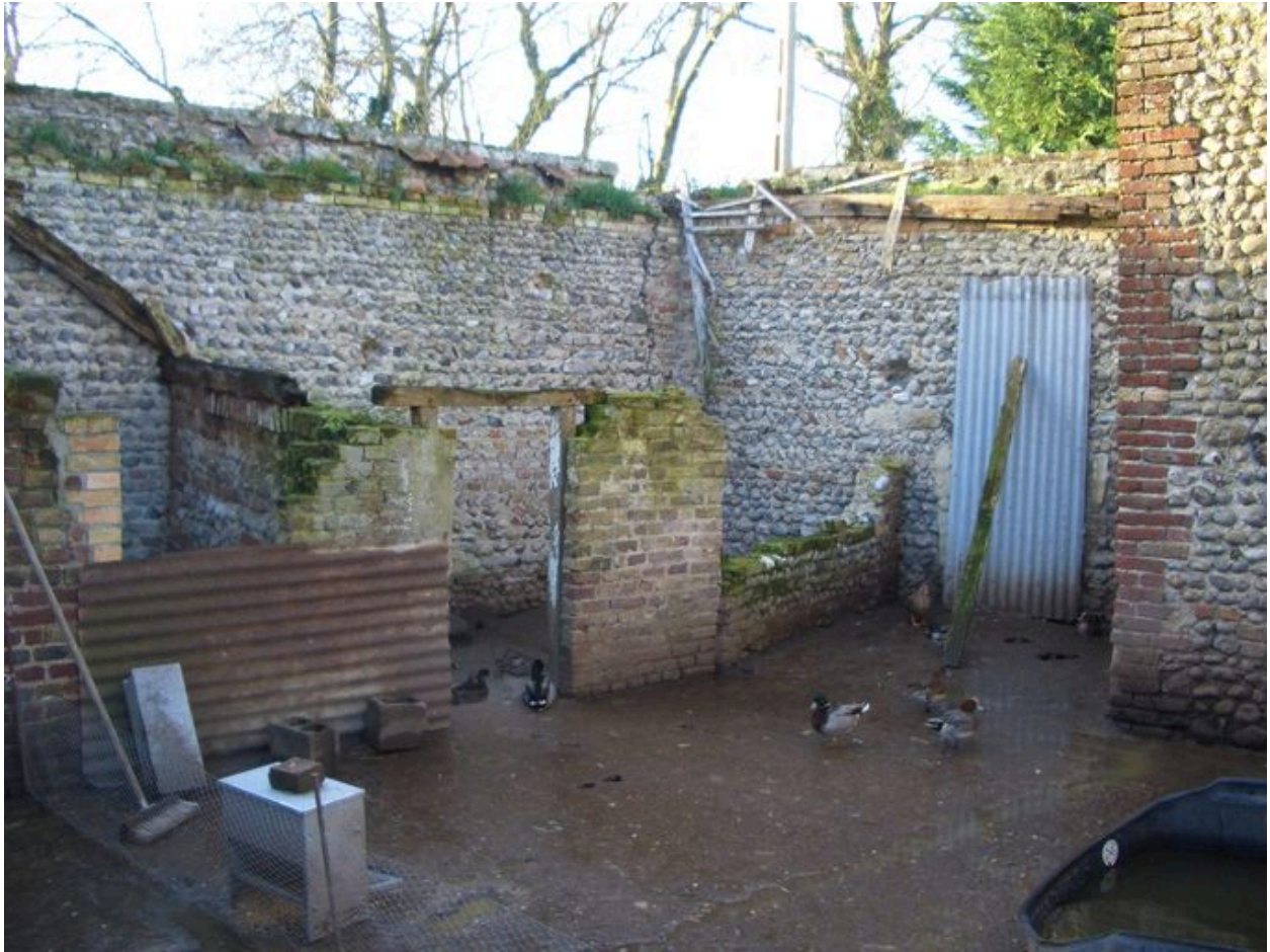
Vue de la cour du poulailler.