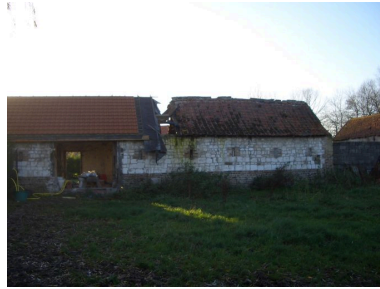
Vue postérieure des porcheries. IVR22_20068005659NUCA