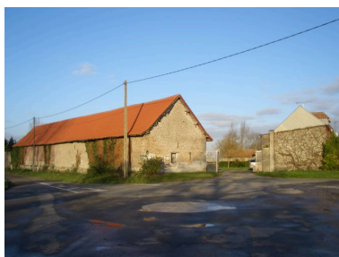
Vue générale depuis la rue. IVR22_20068005651NUCA