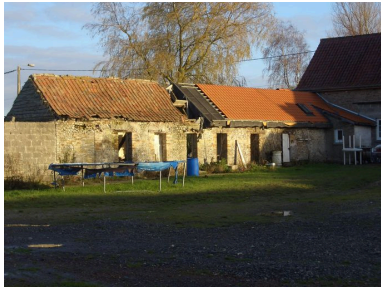
Vue des étables à cochons depuis la cour. IVR22_20068005658NUCA