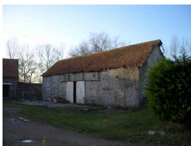
Vue de la grange.