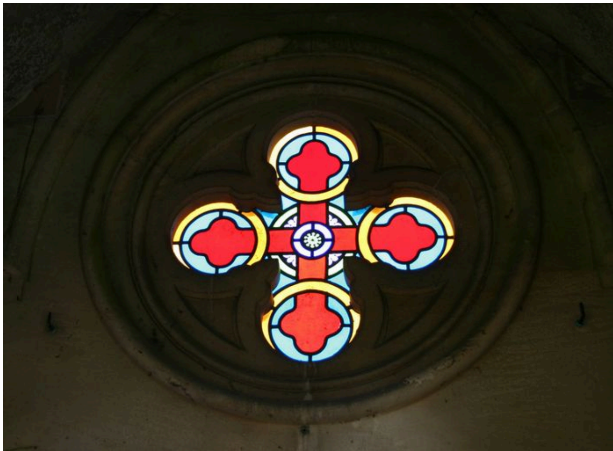
Détail du vitrail quadrilobé.