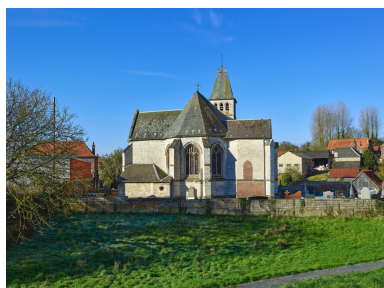
Vue du chevet de l'église.