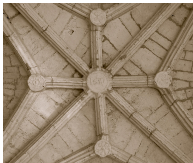
Vue de la voûte du porche avec la date portée "1677". IVR32_20236200196NUCA