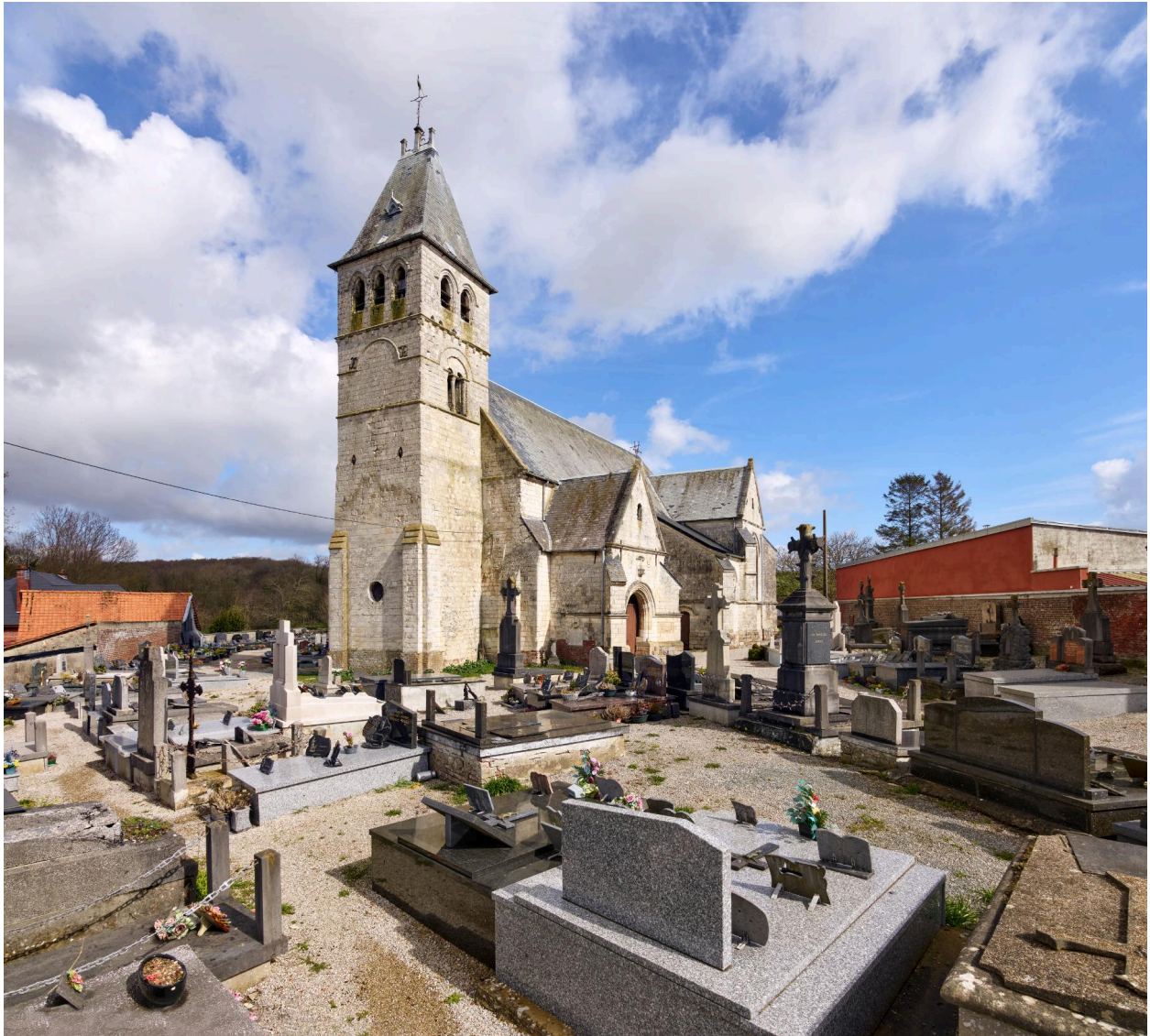
Vue de l'église entourée du cimetière depuis le sud.