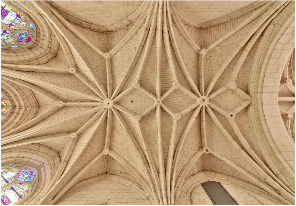
Vue de la voûte du chœur.