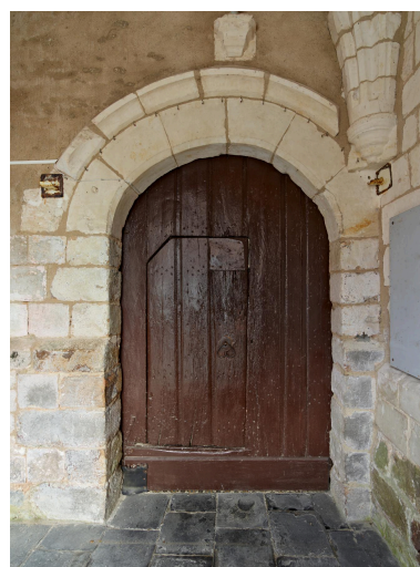
Porte d'entrée de l'église dans le porche. IVR32_20236200195NUCA