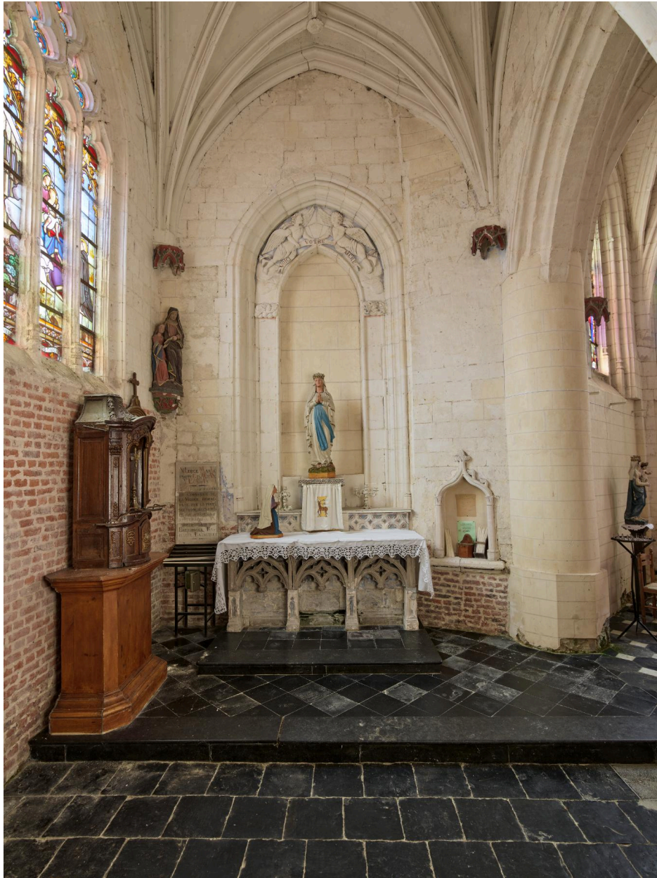
Vue intérieure de la chapelle nord .