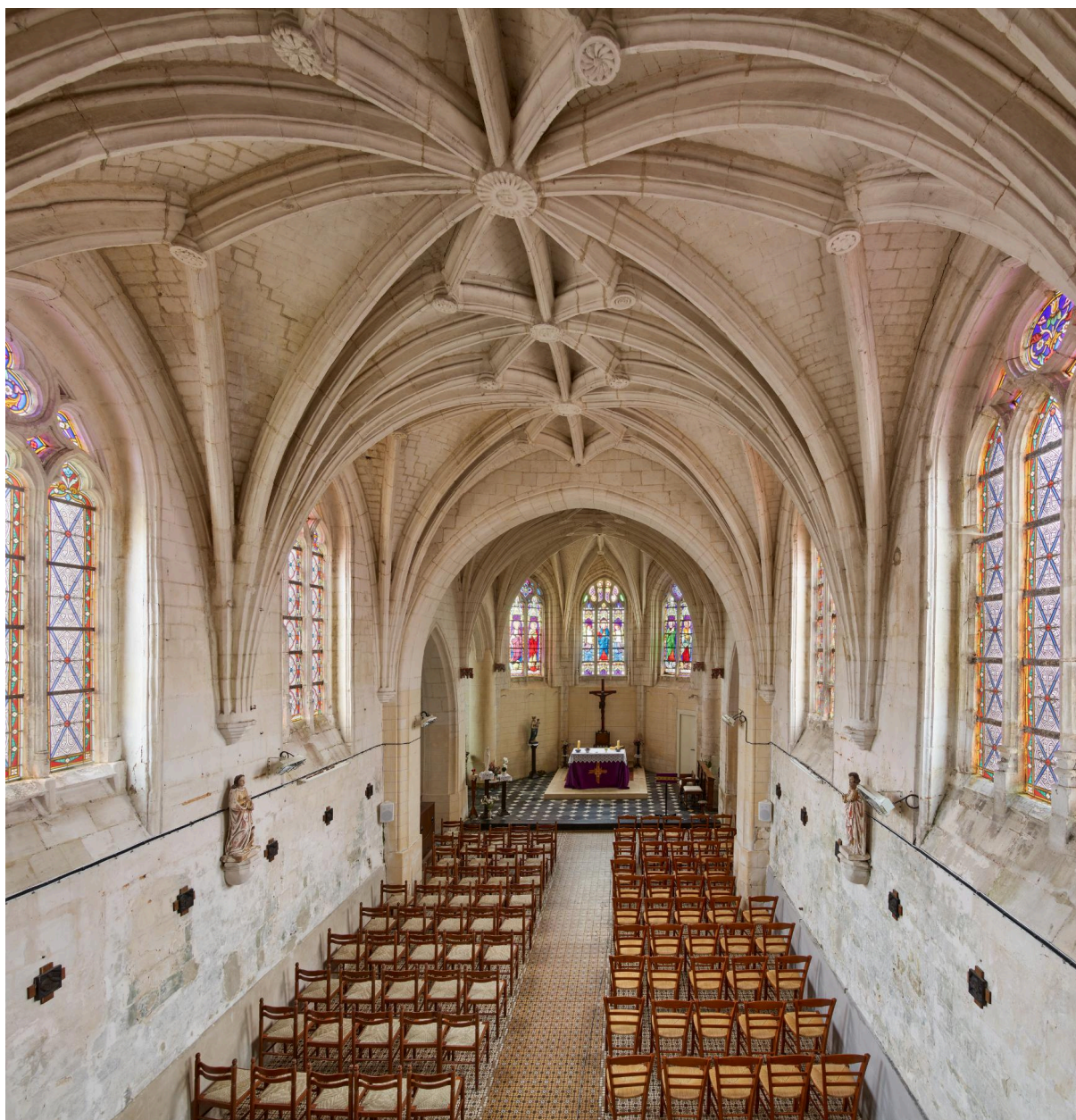
Vue de la nef et du chœur depuis la tribune.