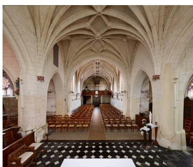
Vue de la nef et de la tribune depuis le chœur.