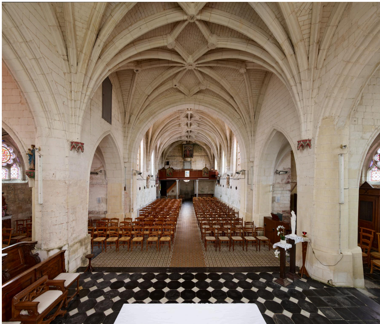
Vue de la nef et de la tribune depuis le chœur.