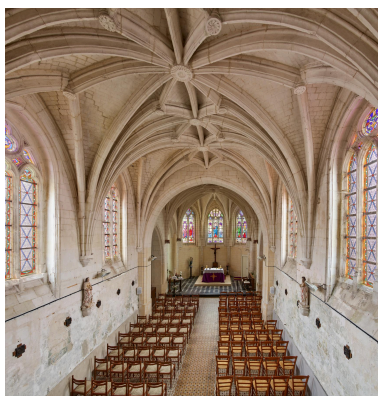
Vue de la nef et du choeur depuis la tribune.