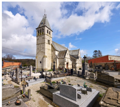
Vue de l'église entourée du cimetière depuis le sud. IVR32_20236200159NUCA