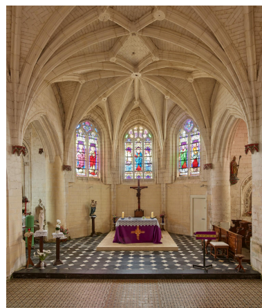
Vue du chœur. IVR32_20236200164NUCA