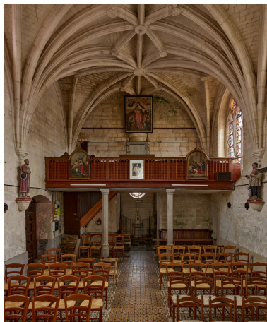
Vue de la tribune. IVR32_20236200192NUCA