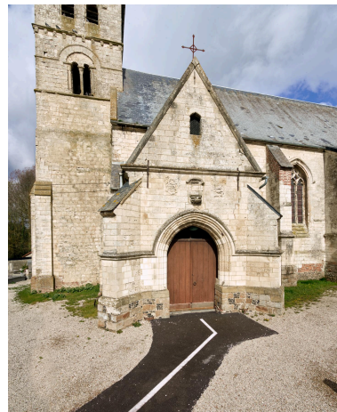
Vue du porche.