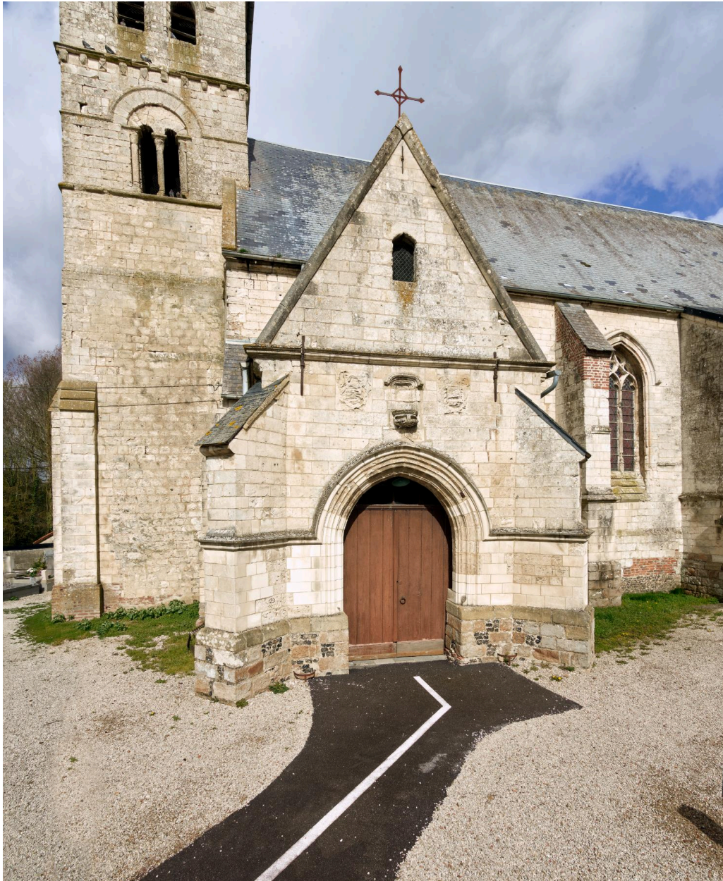
Vue du porche.