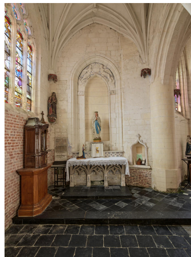
Vue intérieure de la chapelle nord. IVR32_20236200182NUCA