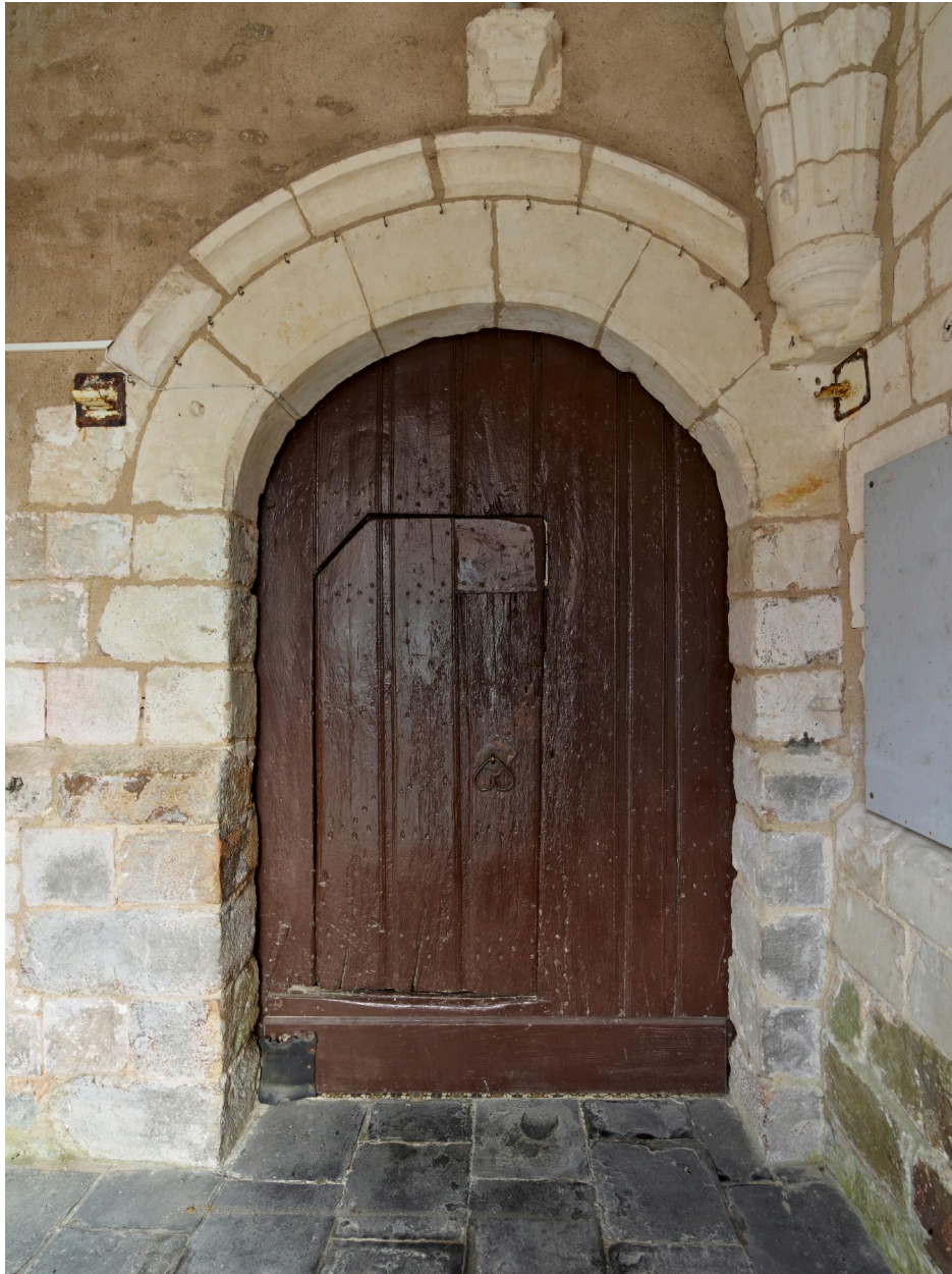
Porte d'entrée de l'église dans le porche.