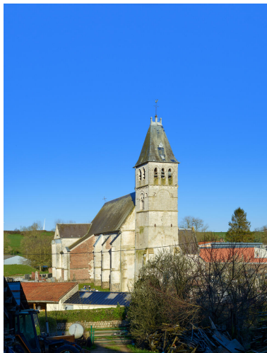
Vue de la tour depuis la rue Haute. IVR32_20236200352NUCA