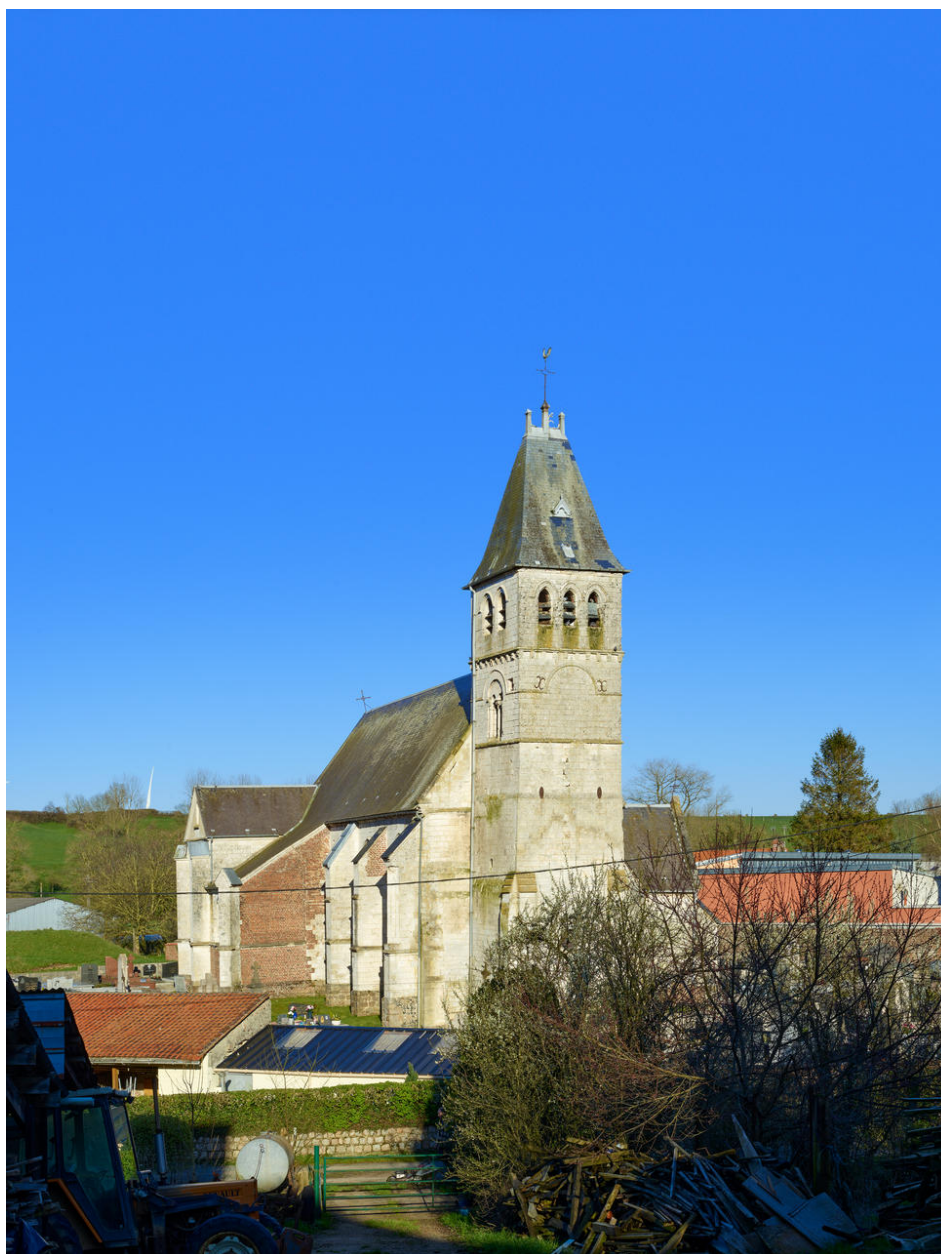
Vue de la tour depuis la rue Haute.