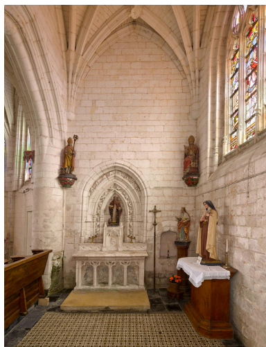
Vue intérieure de la chapelle sud. IVR32_20236200176NUCA