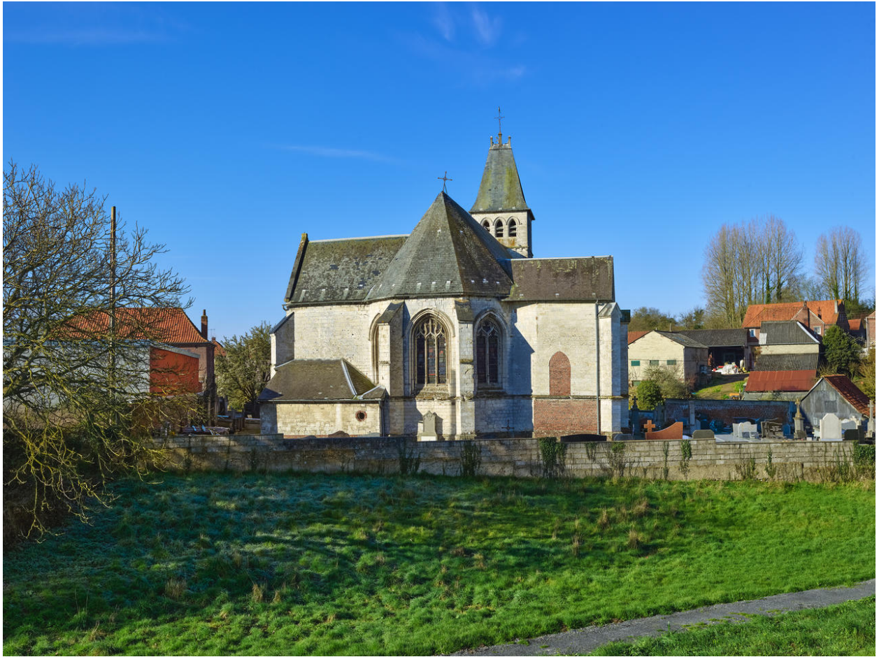
Vue du chevet de l'église.