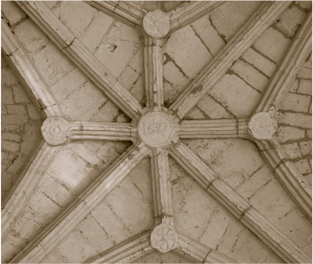
Vue de la voûte du porche avec la date portée "1677".