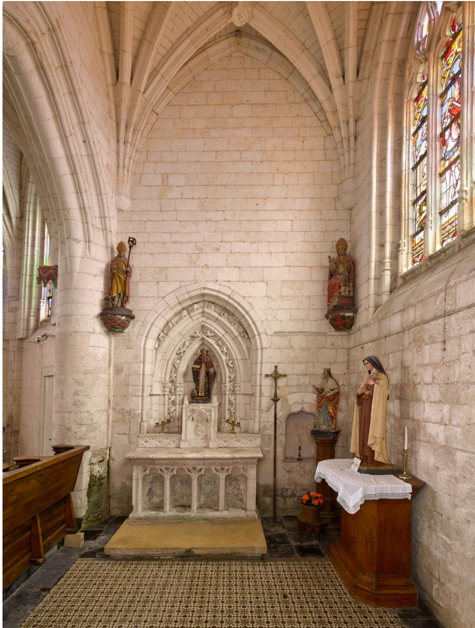
Vue intérieure de la chapelle sud.