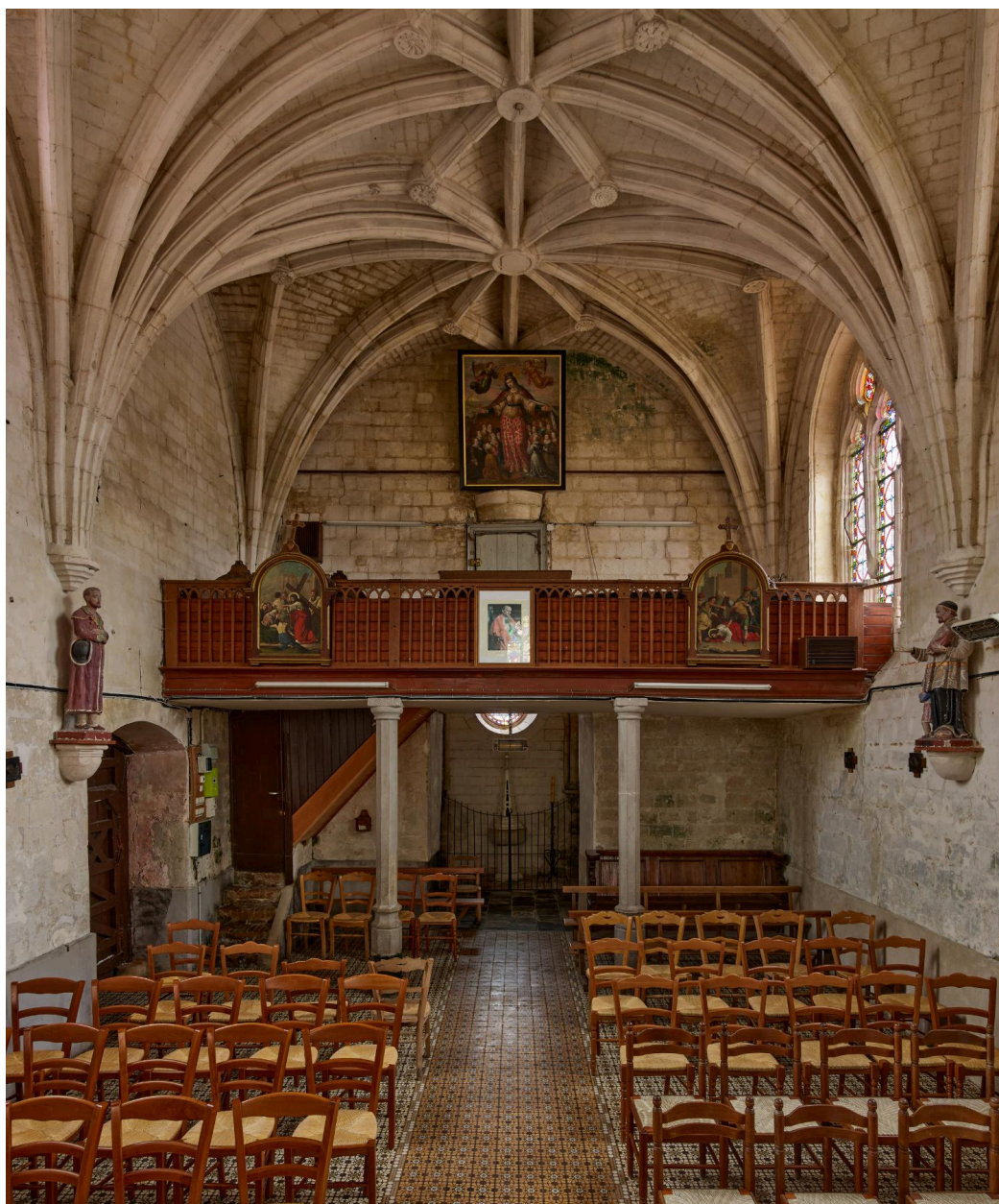
Vue de la tribune.