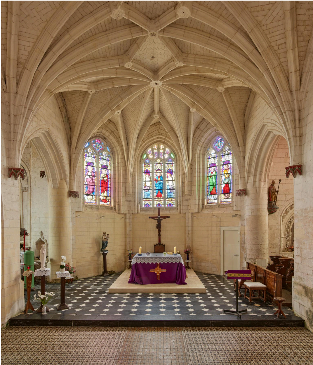
Vue du chœur.