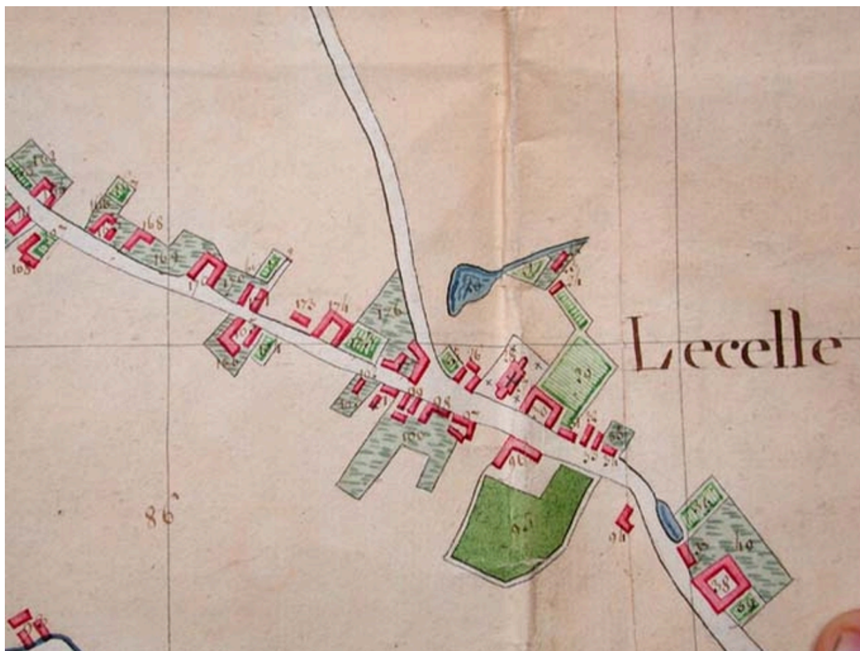
Cadastre de 1805, le centre autour de l'église et le presbytère (AD Nord P30/192).