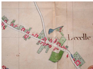
Cadastré de 1805, le centre autour de l'église et le presbytère (AD Nord P30/192). IVR31_20045905461NUCA