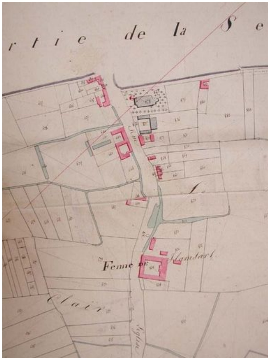
Plan de situation, cadastre de 1821 (AD Nord. P31/598).