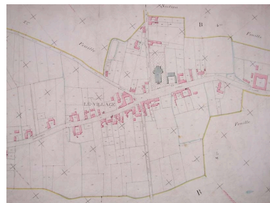
Plan de situation, cadastre de 1885 (AD Nord P31/598).