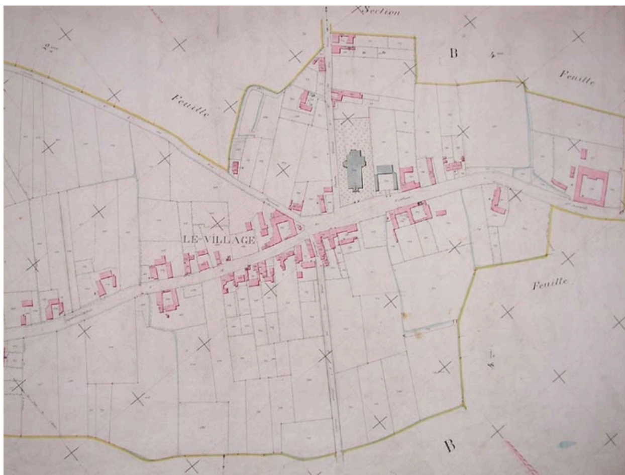
Plan de situation, cadastre de 1885 (AD Nord P31/598).