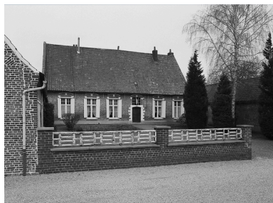
Vue générale. IVR31_20045900055X